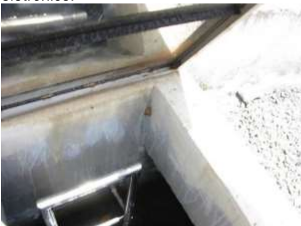
Figura 16 - Reservatório novo do bairro João Paulo II.