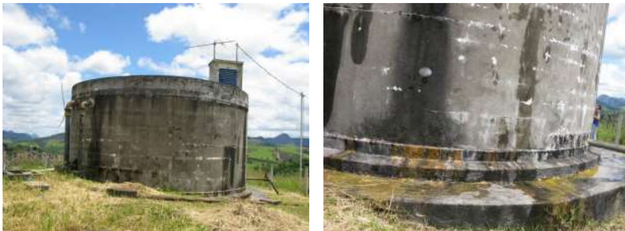
Figura 21 - Infiltrações nas paredes do Reservatório do bairro João Paulo II.

Não conformidade NC10: Artigo 14, inciso IV, da Resolução ARSP 018/2018. Deixar de realizar operação e manutenção adequada das unidades integrantes dos sistemas de abastecimento de água e/ou esgotamento sanitário, de acordo com as exigências dos regramentos vigentes.