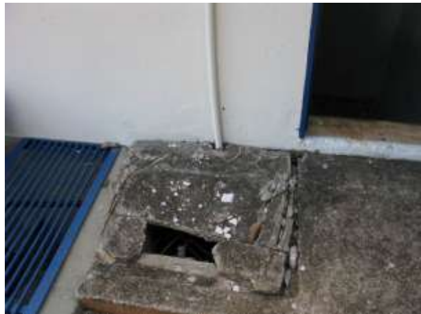
Figura 15 - Tampa de inspeção próxima à EEAT.