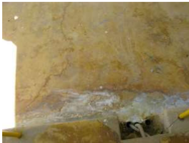
Figura 5 - Piso do nível superior da ETA.