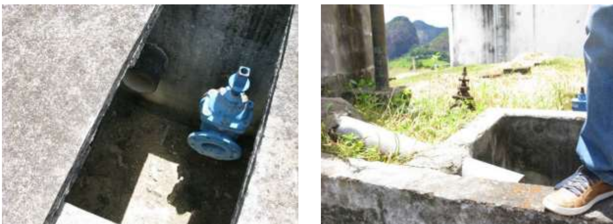
Figura 20 – Ausência de tampas.

CONSTATAÇÃO C9: Faltam tampas nas caixas de inspeção na área interna cercada dos reservatórios do bairro João Paulo II.