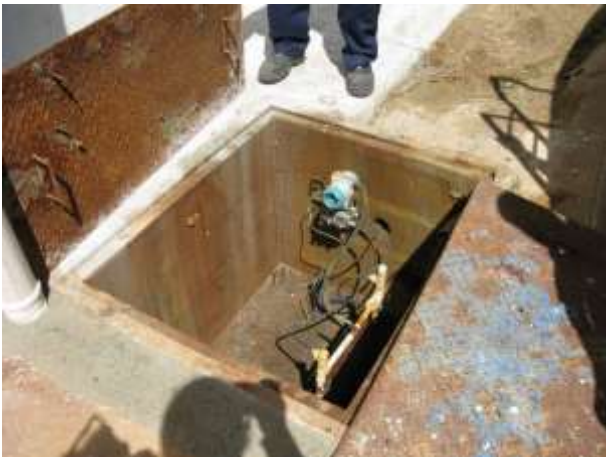
Figura 14 - Caixa que contém o medidor eletrônico.