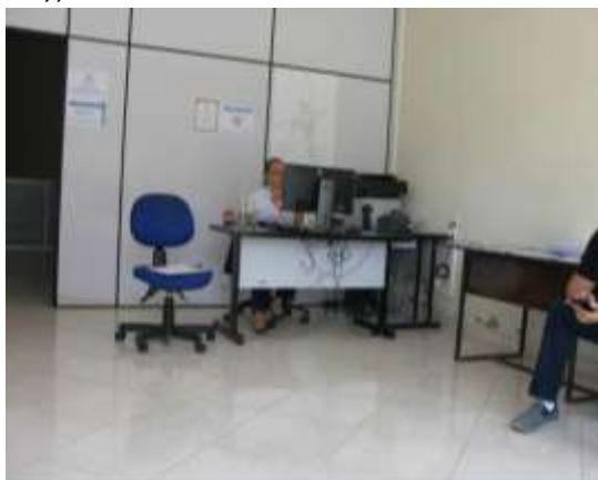
Figura 26 - Escritório de atendimento ao público.

CONSTATAÇÃO C16: Ausência de tabela de preços de serviços e tarifas para informação dos usuários no escritório de atendimento de Águia Branca. (Observar recomendação (R2)).