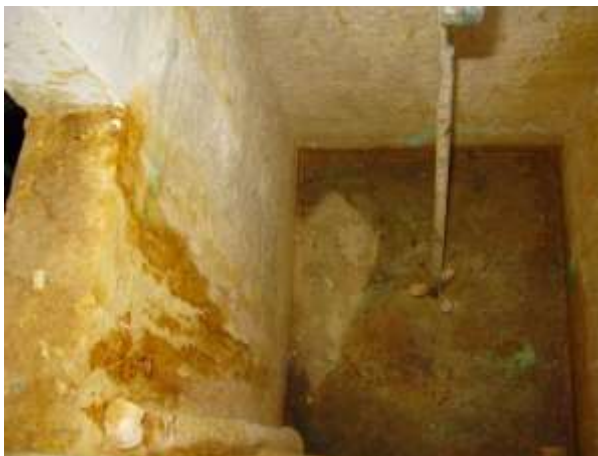
Figura 10 - Interior do tanque 3.

Não conformidade NC5: Artigo 14, inciso IV, da Resolução ARSP 018/2018. Deixar de realizar operação e manutenção adequada das unidades integrantes dos sistemas de abastecimento de água e/ou esgotamento sanitário, de acordo com as exigências dos regramentos vigentes.