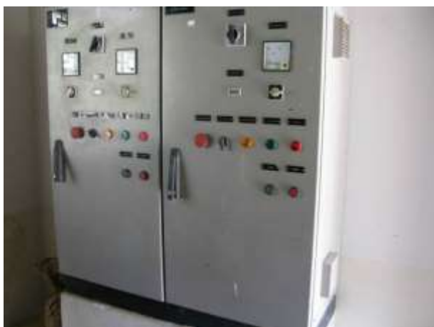
Figura 1 - EEAB de Água Branca.

CONSTATAÇÃO C1: Ausência de sinalização de Risco de Choque Elétrico no painel de comando / quadro de força da Estação Elevatória de Água Bruta (EEAB) de Água Branca e no quadro elétrico da EEAT localizada na área da ETA de Água Branca.