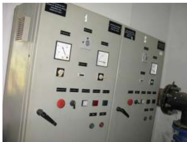
Figura 2 - EEAT localizada na área da ETA de Água Branca.

Não conformidade NC1: Artigo 11, inciso VI, Resolução ARSP 018/2018, “Deixar de prover as áreas de risco das instalações com sinalização de risco e/ou avisos de advertência de forma adequada à visualização de terceiros”.