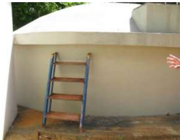
Figura 18 - Reservatório da ETA Água Branca.