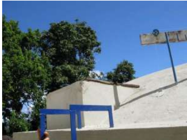
Figura 13 - Reservatório localizado na ETA.