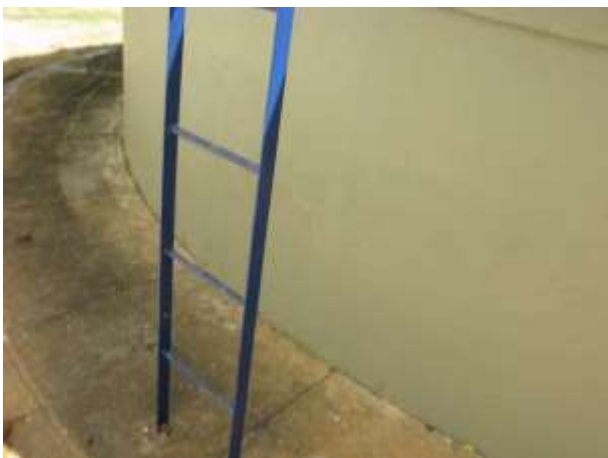
Figura 17 - Reservatório da ETA Água Branca.

CONSTATAÇÃO C8: Necessidade de manutenção das escadas de acessos aos reservatórios de Água Tratada da ETA Água Branca (150m 3 ), sinais de corrosão e bases soltas, e na escada de acesso do Reservatório antigo do bairro João Paulo II.