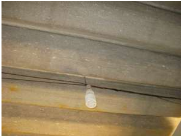
Figura 3 - EEAB de Águia Branca.

Não conformidade NC2: Artigo 14, inciso III, da Resolução ARSP 018/2018. Deixar de cumprir as normas técnicas, os procedimentos e/ou requisitos estabelecidos em regramento vigente para a implantação de todas as infraestruturas necessárias para a adequada prestação de serviços de abastecimento de água e de esgotamento sanitário.