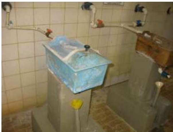
Figura 8 - Recipientes dosadores sem identificação.

Não conformidade NC4 – Artigo 11, inciso V da Resolução nº 18/2018. “Deixar de identificar as unidades operacionais e instalações pertencentes ao sistema de abastecimento de água e esgotamento sanitário, inclusive quanto ao horário de funcionamento dos postos de atendimento ao usuário”.