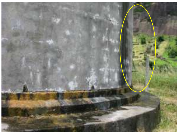
Figura 19 - Reservatório antigo do bairro João Paulo II.

Não conformidade NC8: Artigo 14, inciso III, da Resolução ARSP 018/2018. Deixar de cumprir as normas técnicas, os procedimentos e/ou requisitos estabelecidos em regramento vigente para a implantação de todas as infraestruturas necessárias para a adequada prestação de serviços de abastecimento de água e de esgotamento sanitário.