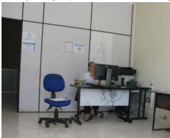
Figura 23 - Escritório de atendimento ao público.

CONSTATAÇÃO C13: O escritório de atendimento ao público não está dotado de instalações que ofereçam água para os usuários em Água Branca.