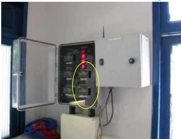
Figura 11 - Ausência de sinal das vazões.

CONSTATAÇÃO C6: Ausência de sinal das vazões de distribuição no painel de controle interno para monitoramento de dados da ETA de Águia Branca.