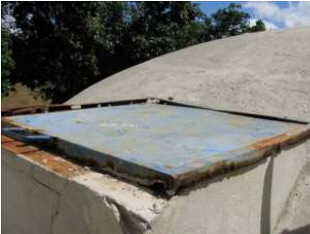
Figura 12 - Reservatório Localizado na ETA.