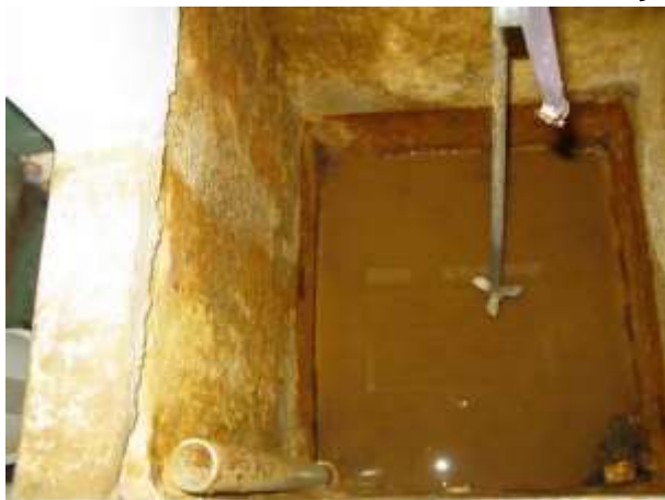
Figura 9 - Interior do tanque 1.

CONSTATAÇÃO C5: Unidades misturadoras dos produtos químicos apresentam sinais de corrosão, demandando manutenção.