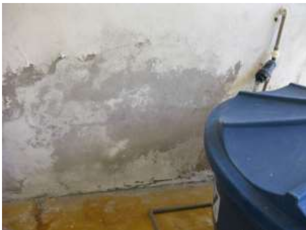
Figura 4 - Parede lateral à Salmoura.