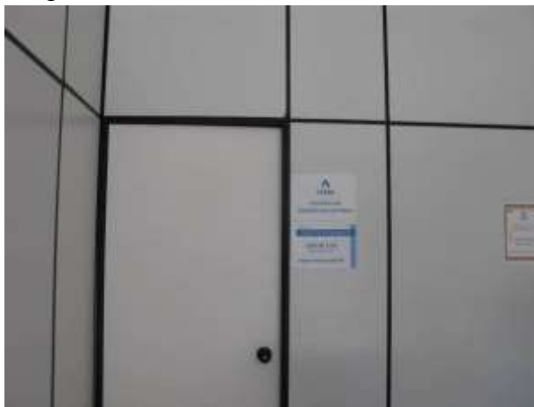
Figura 24 - Escritório de atendimento ao público.

CONSTATAÇÃO C14: Ausência de oferta de banheiro para o usuário no escritório de atendimento de Água Branca.