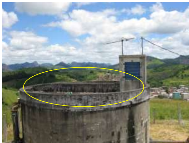
Figura 22 - Reservatório do bairro João Paulo II.

CONSTATAÇÃO C11: Armaduras expostas no vigamento superior do Reservatório antigo do bairro João Paulo II.