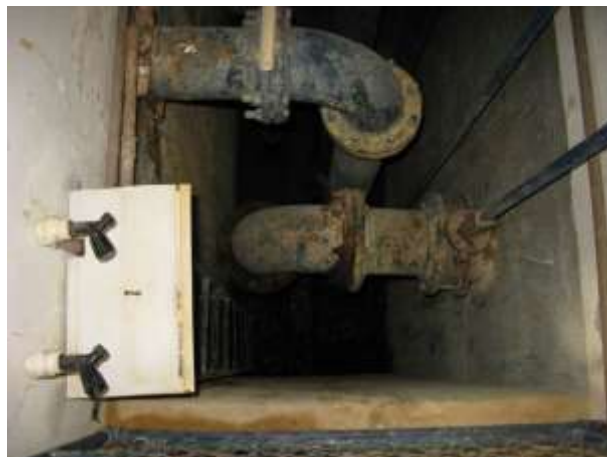
Figura 4 - ETA Santo Agostinho.