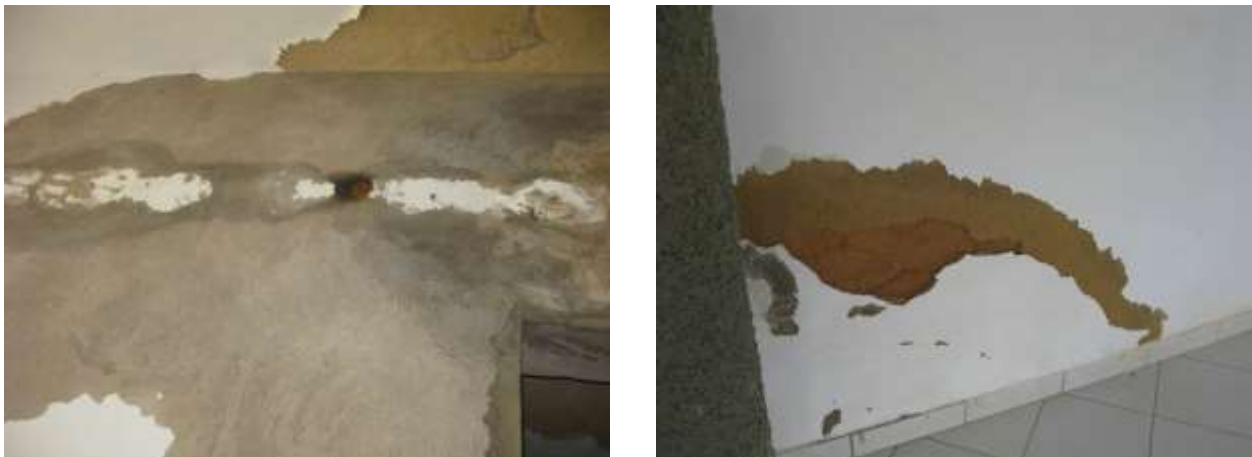
Figura 19 - ETA Santo Agostinho.

CONSTATAÇÃO C13: As edificações da ETA Santo Agostinho demandam manutenção na estrutura física: parede interna do andar superior e teto da laje da sala de descarga do filtro.