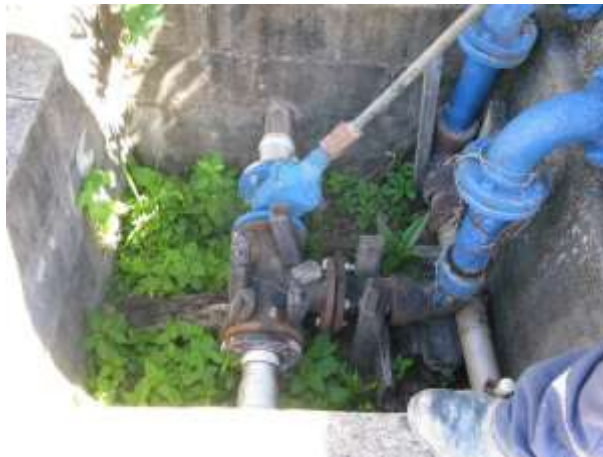
Figura 12 - Caixa de inspeção EEAT Bela Vista.

CONSTATAÇÃO C7: Ancoragem das tubulações na caixa de inspeção feita de forma provisória e demandando melhorias da EEAT Bela Vista.