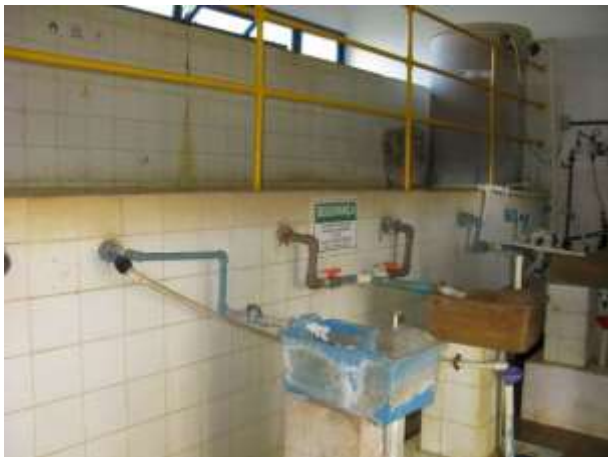
Figura 8 - ETA Sede .

CONSTATAÇÃO C5: Faltam identificações dos produtos químicos nos recipientes dosadores nas ETA's Sede, Santo Agostinho e Governador Lacerda de Aguiar em Água Doce do Norte.