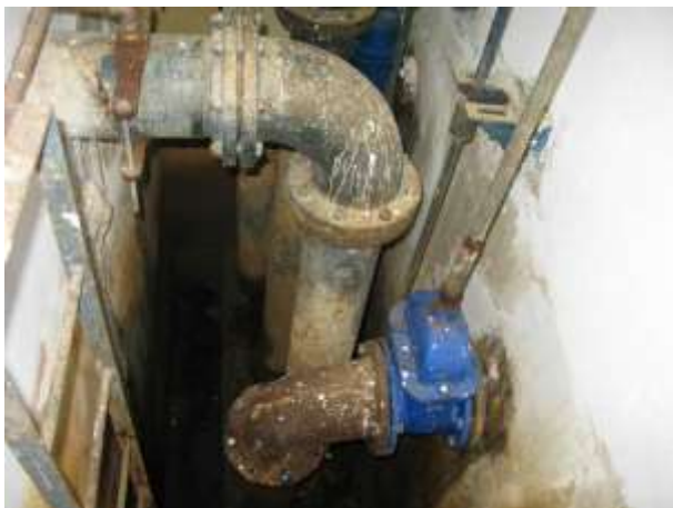
Figura 3 - ETA Sede.