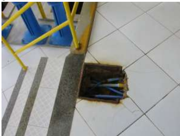
Figura 20 - ETA Santo Agostinho.

CONSTATAÇÃO C14: Ausência de Tampa em caixa de passagem no piso da área interna à ETA Santo Agostinho.