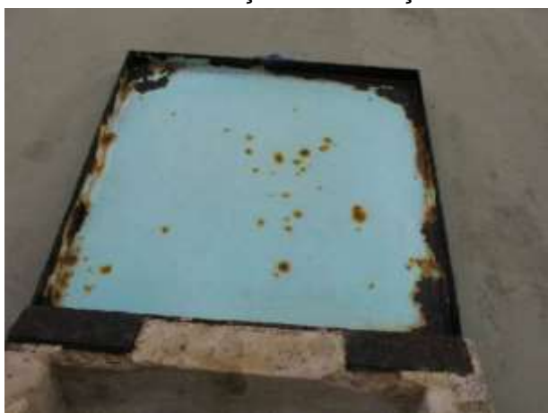
Figura 25 - Reservatório da ETA Sede.

CONSTATAÇÃO C19: Tampas de inspeção dos Reservatórios de concreto de água tratada encontram-se enferrujadas nas ETA's Água Doce do Norte Sede, Santo Agostinho e Governador Lacerda de Aguiar. As tampas de inspeção dos tanques de contato das ETA's Sede e Santo Agostinho também necessitam de manutenção/substituição.