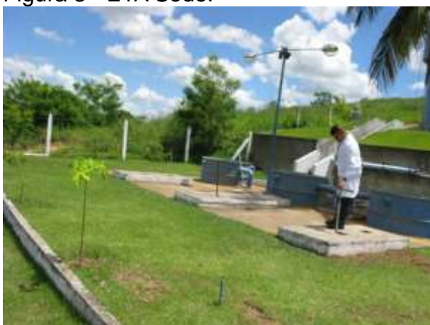
Figura 5 - ETA Governador Lacerda de Aguiar.

Não conformidade NC3 – Item IV do Artigo 14º da Resolução nº 018, de 30/05/2018. Deixar de realizar operação e manutenção adequada das unidades integrantes dos sistemas de abastecimento de água e/ou esgotamento sanitário, de acordo com as exigências dos regramentos vigentes.