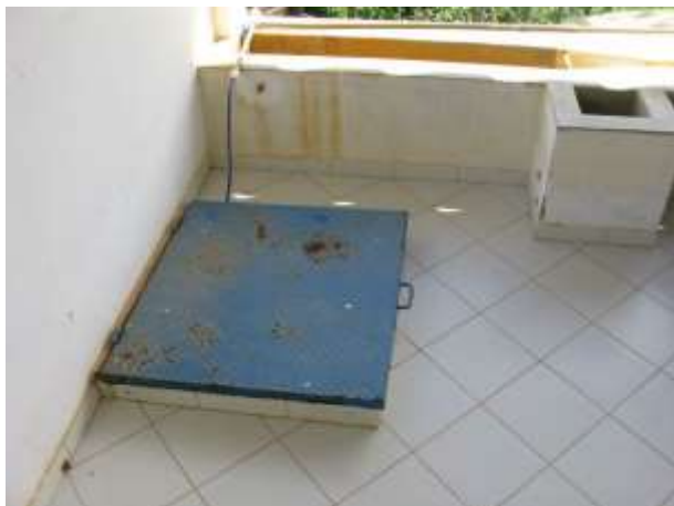
Figura 29 - ETA Santo Agostinho.

Não conformidade NC19 – Inciso IV do Artigo 14 da Resolução nº 018, de 30/05/2018, “Deixar de realizar operação e manutenção adequada das unidades integrantes dos sistemas de abastecimento de água e/ou esgotamento sanitário, de acordo com as exigências dos regramentos vigentes”.