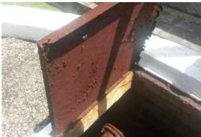
Figura 27 – Reservatório ETA Governador Lacerda de Aguiar.