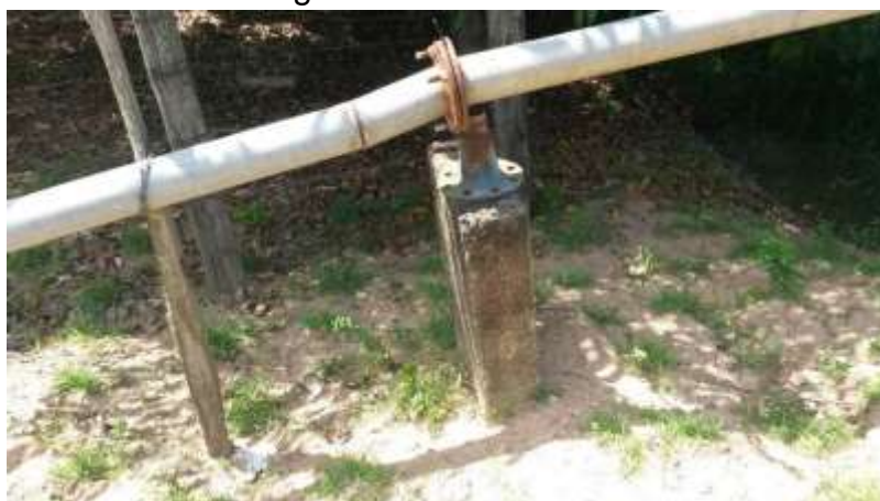
Figura 23 - Adutora da EEAB Governador Lacerda Aguiar.

CONSTATAÇÃO C17: Ausência de fixação no bloco de apoio à Adutora da EEAB Governador Lacerda de Aguiar.