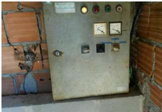
Figura 16 - Painel elétrico da EEAB de Governador Lacerda Aguiar.

Não conformidade NC10 – Item VI do Artigo 11º da Resolução nº 018, de 30/05/2018. Deixar de prover as áreas de risco das instalações com sinalização de risco e/ou avisos de advertência de forma adequada à visualização de terceiros.