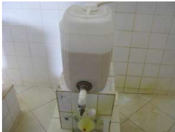
Figura 9 - ETA Santo Agostinho.