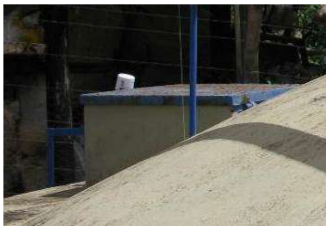
Figura 26 - Reservatório da ETA Santo Agostinho.