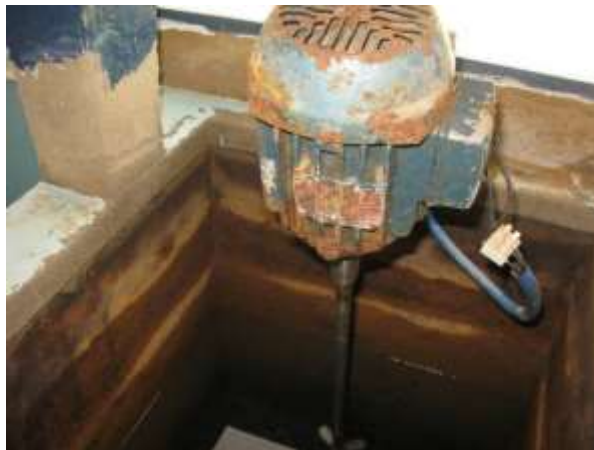
Figura 7 - ETA Santo Agostinho.

Não conformidade NC4 – Artigo 14, inciso IV, da Resolução ARSP 018 de 30/05/2018. Deixar de realizar operação e manutenção adequada das unidades integrantes dos sistemas de abastecimento de água e/ou esgotamento sanitário, de acordo com as exigências dos regramentos vigentes.