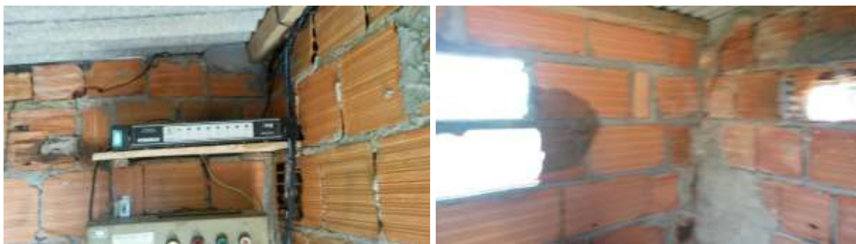
Figura 22 - EEAB da ETA Governador Lacerda.

Não conformidade NC16 – Inciso IV do Artigo 14 da Resolução nº 018, de 30/05/2018, “Deixar de realizar operação e manutenção adequada das unidades integrantes dos sistemas de abastecimento de água e/ou esgotamento sanitário, de acordo com as exigências dos regramentos vigentes”.