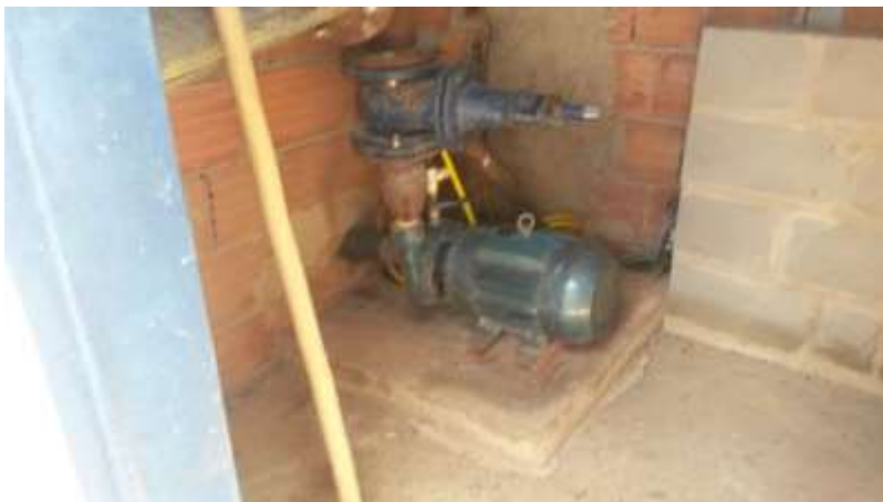
Figura 24 - EEAB de Governador Lacerda de Aguiar.

CONSTATAÇÃO C18: Ausência de bomba reserva na EEAB de Governador Lacerda de Aguiar.