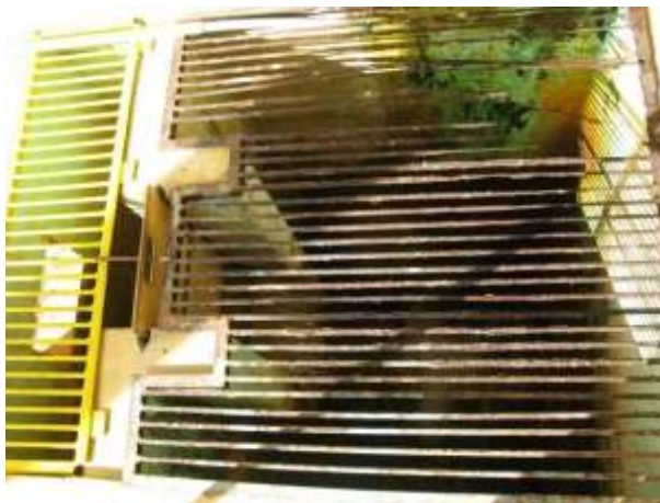
Figura 1 - Grades de proteção dos Filtros.

CONSTATAÇÃO C1: Grades de proteção dos Filtros em mau estado de conservação na ETA Sede de Água Doce do Norte.