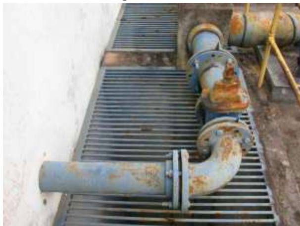
Figura 18 - EEAB da captação para a ETA Santo Agostinho.

CONSTATAÇÃO C12: Falta manutenção na tubulação da seguinte unidade: EEAB da captação para a ETA Santo Agostinho.