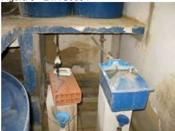
Figura 10 - ETA Governador Lacerda de Aguiar.

Não conformidade NC5 – Artigo 11, inciso V da Resolução nº 18/2018. “Deixar de identificar as unidades operacionais e instalações pertencentes ao sistema de abastecimento de água e esgotamento sanitário, inclusive quanto ao horário de funcionamento dos postos de atendimento ao usuário”.