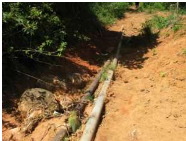
Figura 17 - Redes expostas.

Não conformidade NC11 – Item IV do Artigo 14º da Resolução nº 018, de 30/05/2018. Deixar de realizar operação e manutenção adequada das unidades integrantes dos sistemas de abastecimento de água e/ou esgotamento sanitário, de acordo com as exigências dos regramentos vigentes.