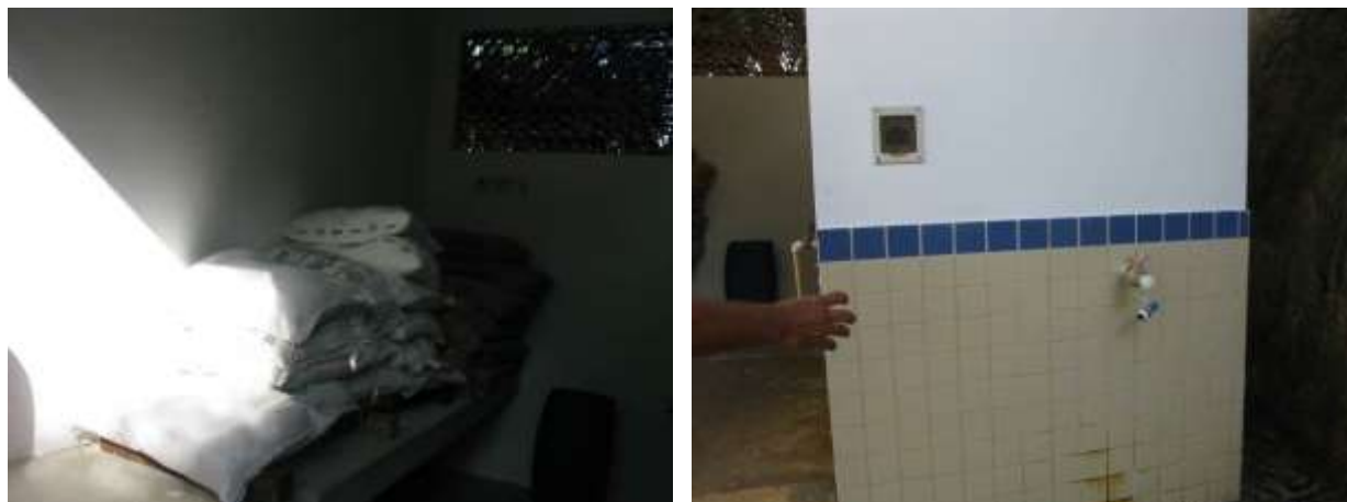
Figura 13 - Falta porta no depósito externo de produtos na ETA Sede

CONSTATAÇÃO C8: Falta porta no depósito externo de produtos na ETA Sede.