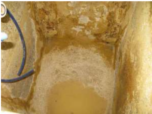
Figura 6 - ETA Sede.

CONSTATAÇÃO C4: Tanques de mistura para preparação de produtos químicos para bombas dosadoras em mau estado de conservação nas ETA's Sede e Santo Agostinho.