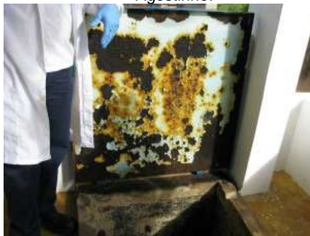
Figura 28 - ETA Sede.