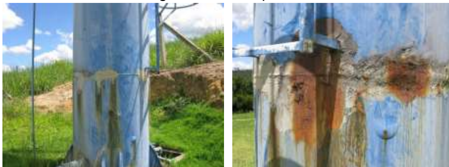
Figura 30 - Reservatório Elevado da ETA Governador Lacerda de Aguiar.

CONSTATAÇÃO C20: Paredes do Reservatório Elevado de lavagem dos filtros da ETA Governador Lacerda de Aguiar tomadas pela corrosão.