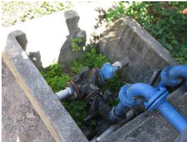
Figura 11 - Caixa de inspeção EEAT Bela Vista.

CONSTATAÇÃO C6: Ausência de tampa na caixa de inspeção em que fica localizada a válvula de descarga da EEAT Bela Vista.