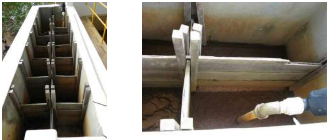
Figura 2 - Floculador da ETA Sede.

CONSTATAÇÃO C2: A última chicana do Floculador da ETA Sede de Água Doce do Norte está em mau estado de conservação.