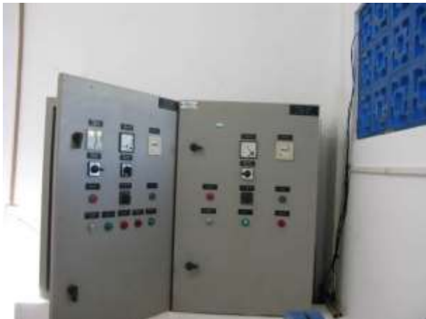
Figura 15 - Painel de comando na EEAT Bela Vista.

CONSTATAÇÃO C10: Ausência de sinalização de risco de choque elétrico no painel de comando na EEAT Bela Vista e EEAB de Governador Lacerda de Aguiar.