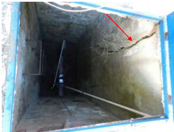
Figura 14 - Presença de trinca na Caixa onde está localizado o medidor de saída

CONSTATAÇÃO C9: Presença de trinca na caixa onde está localizado o medidor de saída na ETA Sede.