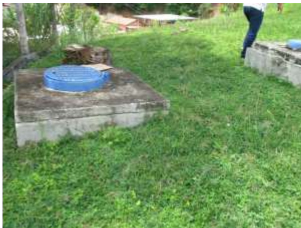
Figura 21 - ETA Santo Agostinho.

Não conformidade NC15 – Inciso VII do Artigo 11 da Resolução nº 018, de 30/05/2018, “Deixar de prover as áreas de risco com estruturas e equipamentos de segurança que possam evitar a ocorrência de acidentes e o acesso de terceiros a área física das unidades operacionais”.