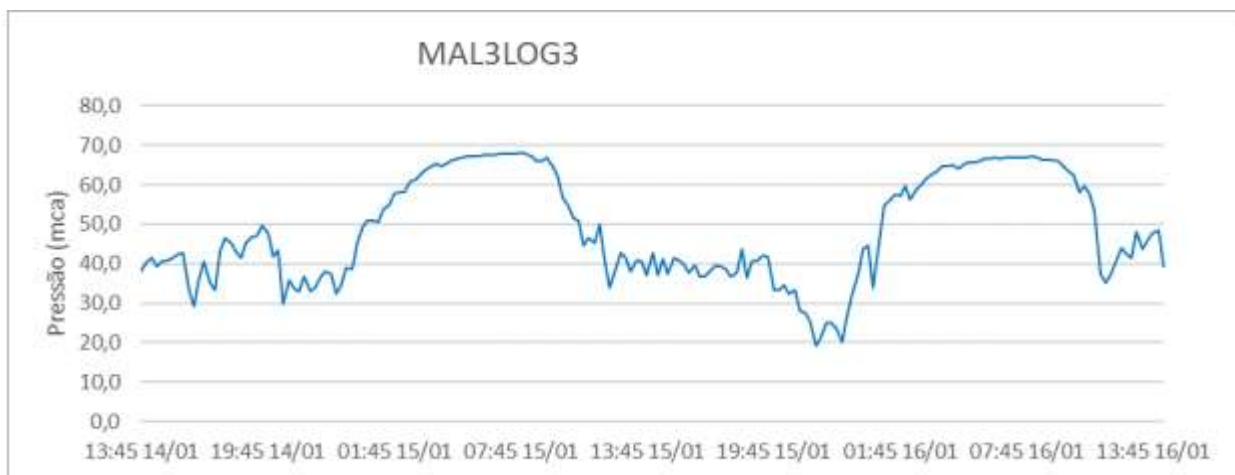
Gráfico 4 - Monitoramento da pressão no SAA do Município de Água Doce do Norte com a instalação às 15:00 horas do dia 14/01/2019 e retirada às 15:00 horas do dia 16/01/2019, do aparelho datalogger, no endereço localizado na Rua Sebastião Paulo Bredas, Nº 59, Vila Esperança, Água Doce do Norte - HD: Y11F154109 – ES.

Gráfico 3 - Monitoramento da pressão no SAA do Município de Água Doce do Norte com a instalação às 14:30 horas do dia 14/01/2019 e retirada às 15:00 horas do dia 16/01/2019, do aparelho datalogger, no endereço localizado na Rua Sebastião Santos, Nº 14, Vila Marinho, Água Doce do Norte - HD: Y11S314476 – ES.