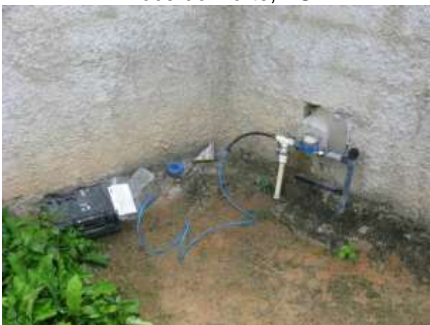
Figura 5 - Equipamento de medição instalado no Ponto 05 - Município de Água Doce do Norte