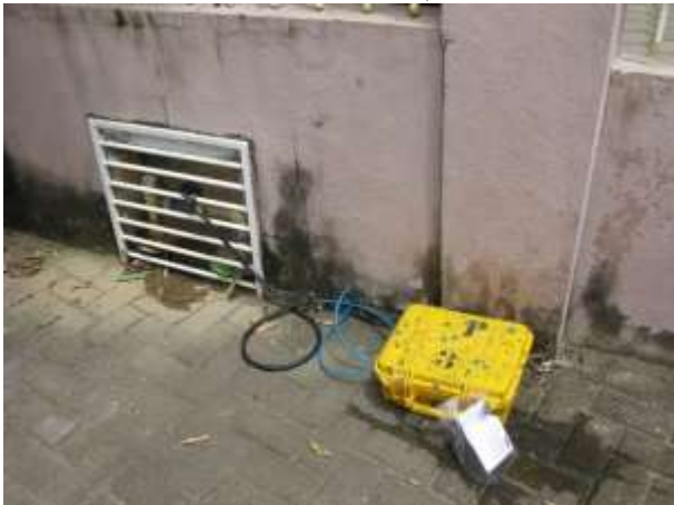
Figura 3 - Equipamento de medição instalado no Ponto 03 - Município de Água Doce do Norte, ES