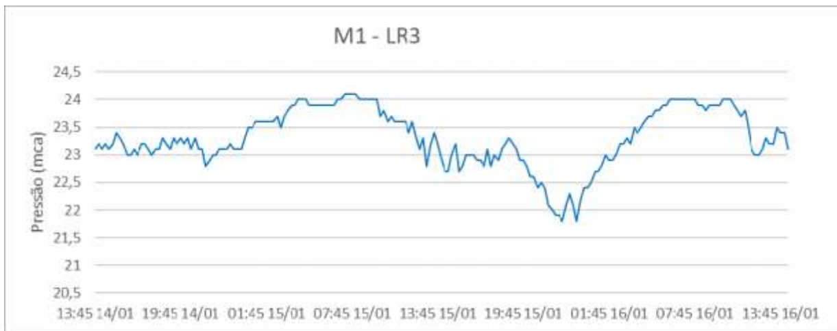
Gráfico 2 - Monitoramento da pressão no SAA do Município de Água Doce do Norte com a instalação às 14:15 horas do dia 14/01/2019 e retirada às 14:30 horas do dia 16/01/2019, do aparelho datalogger, no endereço localizado na Rodovia ES 080, Nº 633, Centro, Água Doce do Norte - HD: Y06L392996 – ES.

Gráfico 1 - Monitoramento da pressão no SAA do Município de Água Doce do Norte com a instalação às 13:45 horas do dia 14/01/2019 e retirada às 14:00 horas do dia 16/01/2019, do aparelho datalogger, no endereço localizado no Bairro Bela Vista, Nº 195, Água Doce do Norte - HD: Y06C025932 – ES.