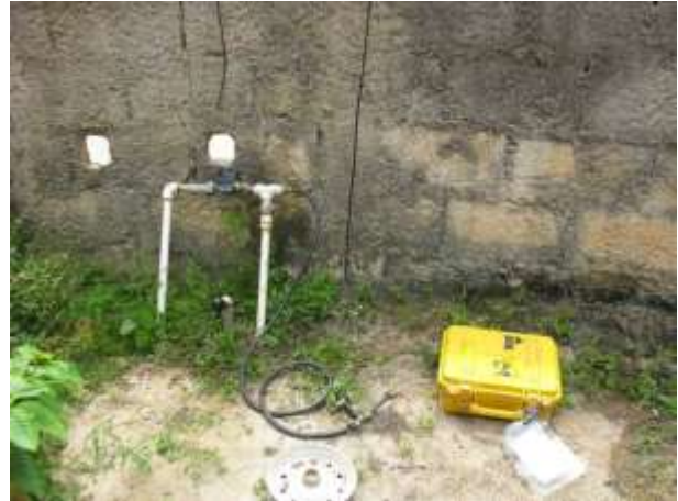
Figura 2 - Equipamento de medição instalado no Ponto 02 - Município de Água Doce do Norte, ES