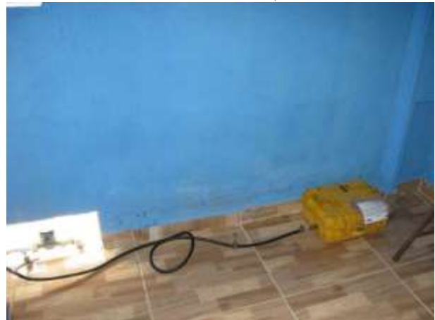
Figura 4 - Equipamento de medição instalado no Ponto 04- Município de Água Doce do Norte, ES