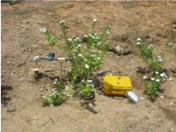
Figura 1 - Equipamento de medição instalado no Ponto 01 - Município da Água Doce do Norte, ES