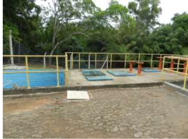
Figura 13 - Captação da ETA Jucu Xurí.