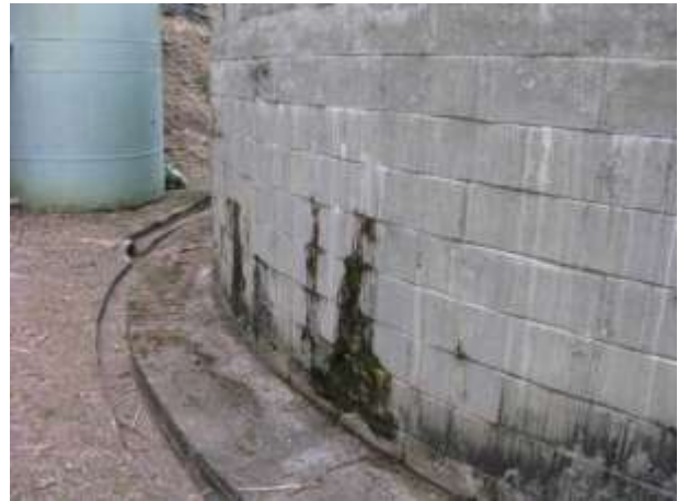
Figura 7 - Reservatório Antigo.