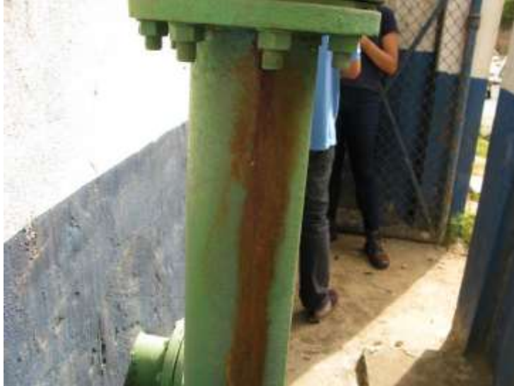
Figura 23 -EEAT Universal .

Não conformidade NC13 – Inciso IV do Artigo 14º da Resolução nº 018, de 30/05/2018. “Deixar de realizar operação e manutenção adequada das unidades integrantes dos sistemas de abastecimento de água e/ou esgotamento sanitário, de acordo com as exigências dos regramentos vigentes”.