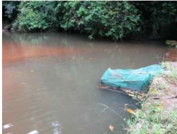
Figura 9 - Barramento do Rio Formate.

CONSTATAÇÃO C4: Necessidade de melhorias no mecanismo de remoção de sólidos grosseiros na captação no barramento do Rio Formate.