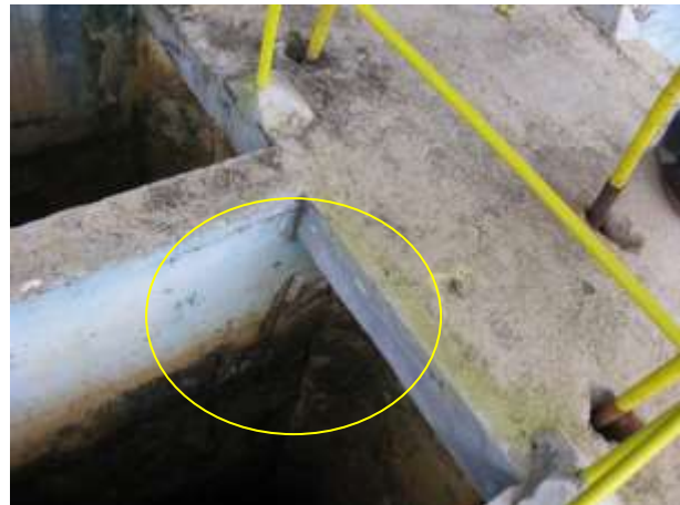
Figura 18 - Filtro.

Não conformidade NC8 – Inciso IV do Artigo 14º da Resolução nº 018, de 30/05/2018. “Deixar de realizar operação e manutenção adequada das unidades integrantes dos