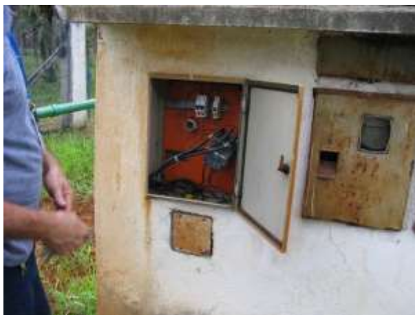
Figura 11 - Quadro elétrico do Poço de Captação.

CONSTATAÇÃO C6: Mau estado de conservação do quadro elétrico do Poço de Captação da ETA Jucu Antártica Compacta.