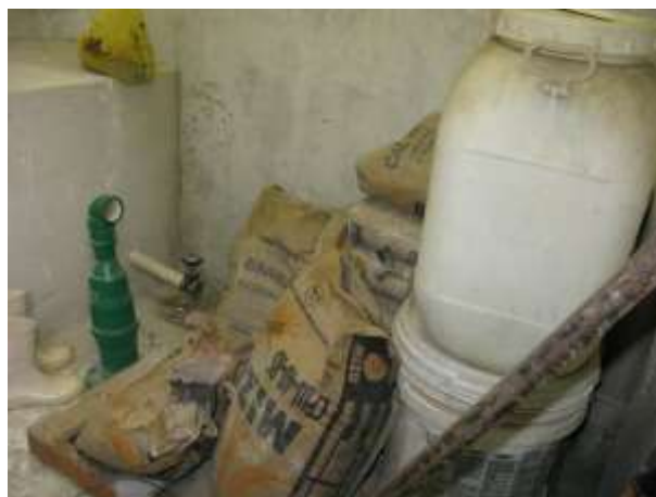
Figura 3 - Depósito da ETA Jucu Xurí.

Não conformidade NC2 – Inciso III, Artigo 14, da Resolução ARSP 018/2018. “Deixar de cumprir as normas técnicas, os procedimentos e/ou requisitos estabelecidos em regramento vigente para a implantação de todas as infraestruturas necessárias para a adequada prestação de serviços de abastecimento de água e de esgotamento sanitário”.