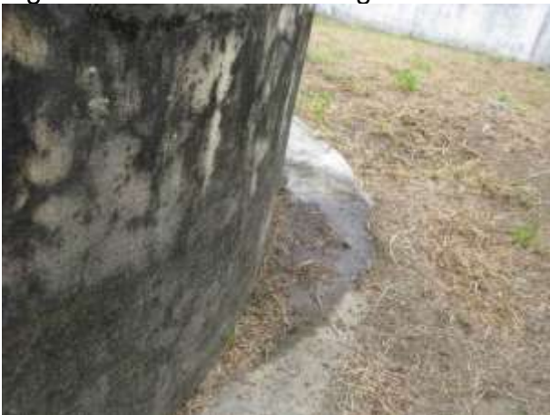
Figura 8 - Reservatório Ipanema.

Não conformidade NC3 – Inciso IV do Artigo 14º da Resolução nº 018, de 30/05/2018. “Deixar de realizar operação e manutenção adequada das unidades integrantes dos sistemas de abastecimento de água e/ou esgotamento sanitário, de acordo com as exigências dos regramentos vigentes”