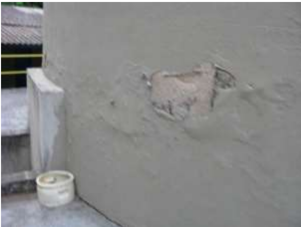
Figura 4 - Reservatório Novo.

CONSTATAÇÃO C3: Há sinais de infiltração nas paredes externas do Reservatório novo e antigo da ETA Viana, bem como no reservatório Ipanema.