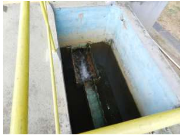
Figura 16 - Decantador.