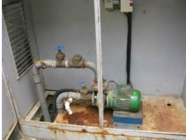
Figura 31 - EEAT Nova Belém .

CONSTATAÇÃO C19: Estrutura da EEAT Nova Belém com sinais de corrosão.