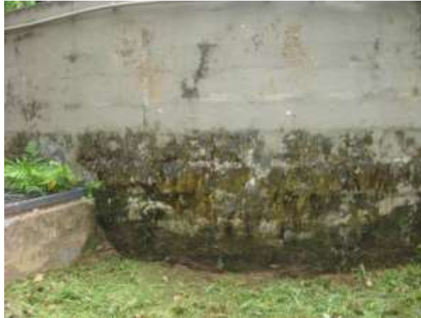
Figura 33 - Reservatório de concreto da ETA Jucu Antártica.

Não conformidade NC23 – Inciso IV do Artigo 14º da Resolução nº 018, de 30/05/2018. “Deixar de realizar operação e manutenção adequada das unidades integrantes dos sistemas de abastecimento de água e/ou esgotamento sanitário, de acordo com as exigências dos regramentos vigentes”.