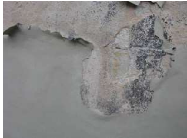
Figura 5 - Reservatório Novo.