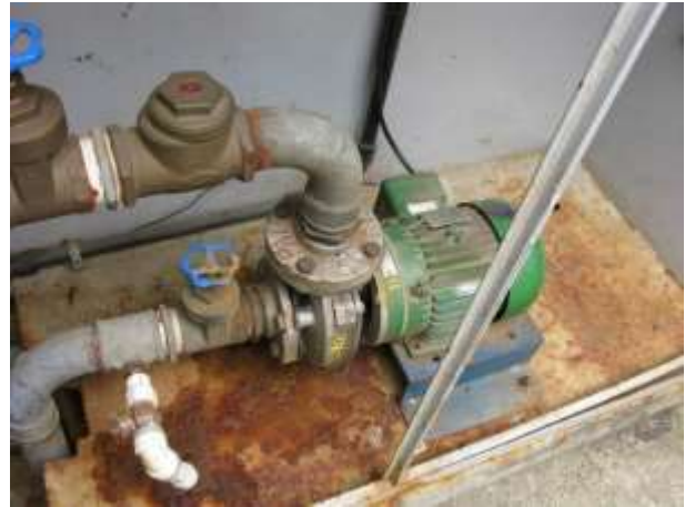
Figura 25 - EEAT Nova Belém.

Não conformidade NC14 – Inciso III, Artigo 14, da Resolução ARSP 018/2018. “Deixar de cumprir as normas técnicas, os procedimentos e/ou requisitos estabelecidos em regramento vigente para a implantação de todas as infraestruturas necessárias para a adequada prestação de serviços de abastecimento de água e de esgotamento sanitário”.