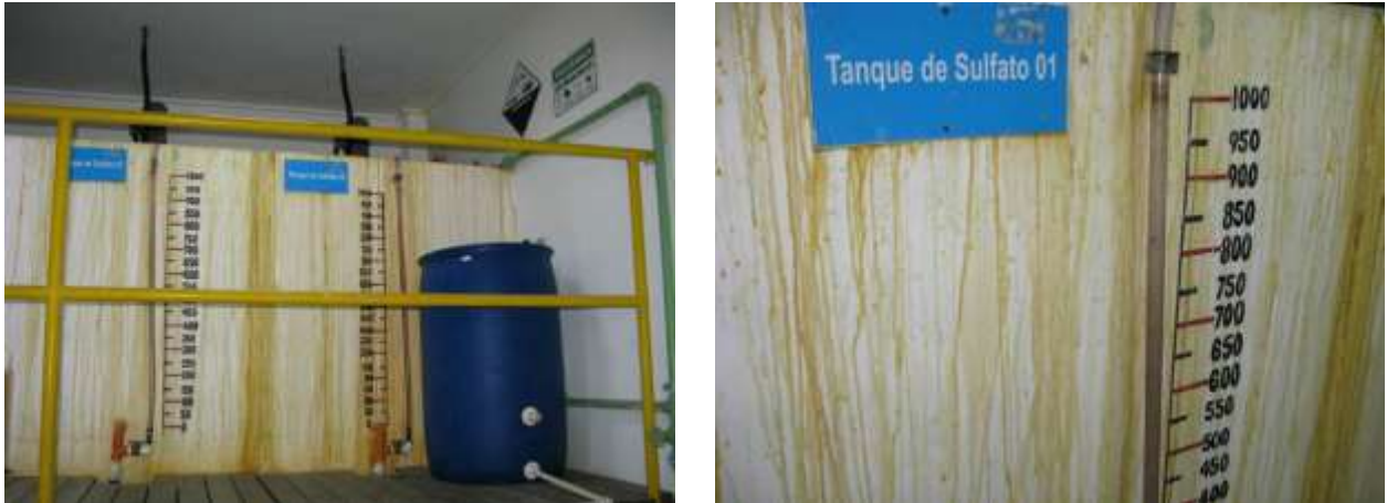
Figura 10 - Tanques de Sulfato na ETA Viana.

Não conformidade NC5 – Inciso IV do Artigo 14º da Resolução nº 018, de 30/05/2018. “Deixar de realizar operação e manutenção adequada das unidades integrantes dos sistemas de abastecimento de água e/ou esgotamento sanitário, de acordo com as exigências dos regramentos vigentes”