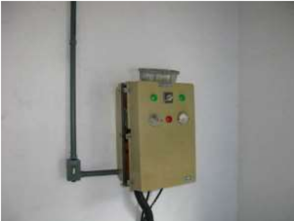
Figura 27 - EEAT Nova Viana .