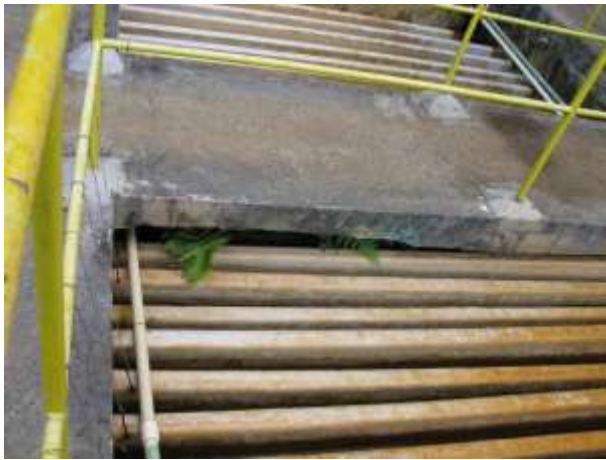
Figura 15 - Floculador.

CONSTATAÇÃO C8: Necessidade de melhorias na conservação e manutenção do Floculador, decantador e filtros da ETA Jucu Antártica em Viana.