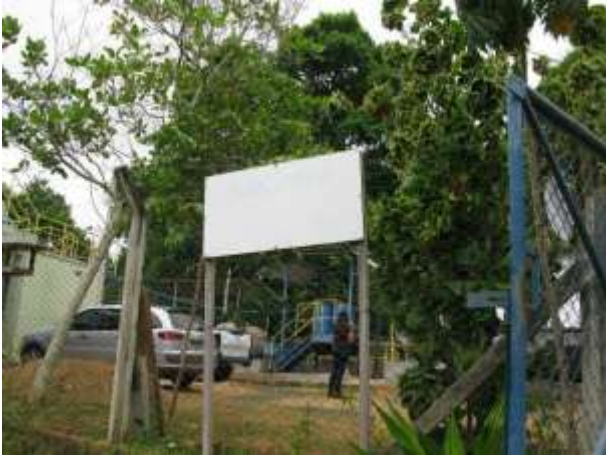
Figura 12 - ETA Jucu Antártica.

CONSTATAÇÃO C7: Faltam identificações na ETA Jucu Antártica em Viana, na Captação da ETA Jucu Xurí e na Captação do Rio Formate.