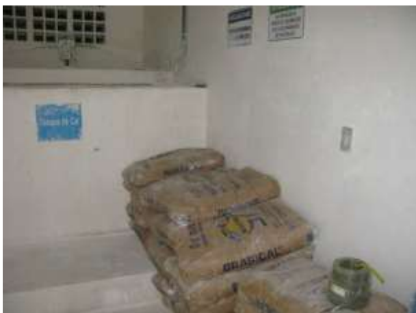
Figura 2 - Depósito da ETA Viana.

CONSTATAÇÃO C2: Armazenagem incorreta de sacos de cal nos depósitos das ETA's Viana e Jucu Xurí.