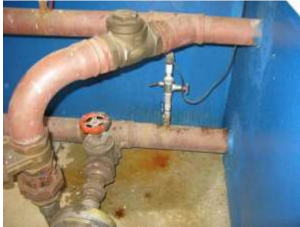
Figura 30 - EEAT Bom Pastor.

Não conformidade NC18 – Inciso IV do Artigo 14º da Resolução nº 018, de 30/05/2018. “Deixar de realizar operação e manutenção adequada das unidades integrantes dos sistemas de abastecimento de água e/ou esgotamento sanitário, de acordo com as exigências dos regramentos vigentes”.