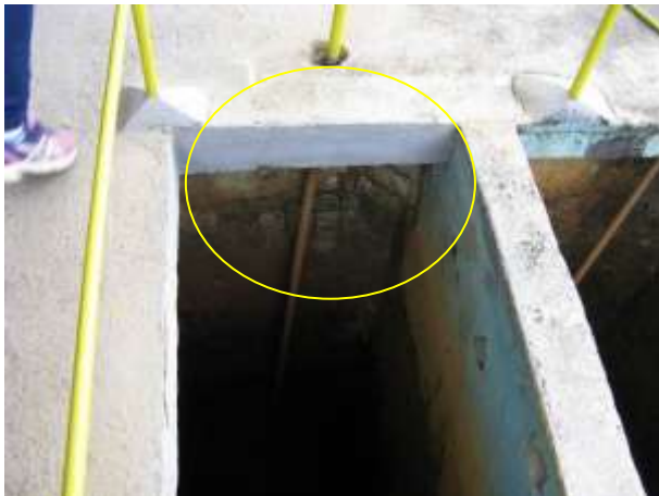
Figura 17 - Filtro.