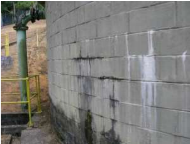
Figura 6 - Reservatório Antigo