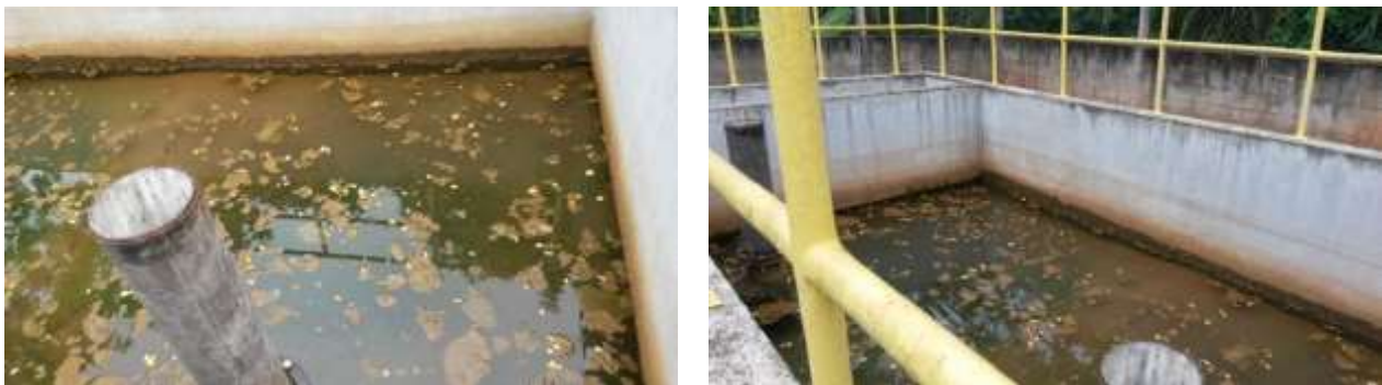
Figura 20 - Sistema de tratamento do lodo na ETA Jucu Xurí.

CONSTATAÇÃO C10: Sistema de tratamento do lodo na ETA Jucu Xurí necessitando melhorias.