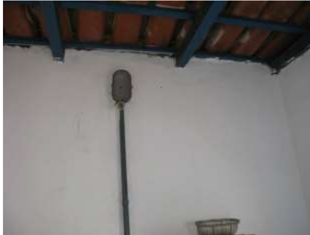
Figura 26 - EEAT Nova Viana.

Não conformidade NC15 – Inciso III do Artigo 14º da Resolução nº 018, de 30/05/2018. “Deixar de cumprir as normas técnicas, os procedimentos e/ou requisitos estabelecidos em regramento vigente para a implantação de todas as infraestruturas necessárias para a adequada prestação de serviços de abastecimento de água e de esgotamento sanitário”.