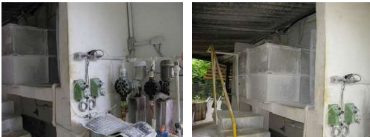
Figura 19 - Recipiente dosador sem identificação.

CONSTATAÇÃO C9: Falta identificação de produtos no recipiente dosador na ETA Jucu Antártica.