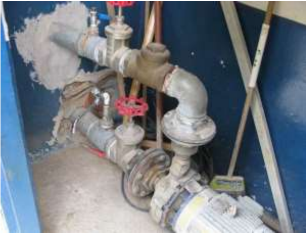
Figura 24 - EEAT Ipanema.