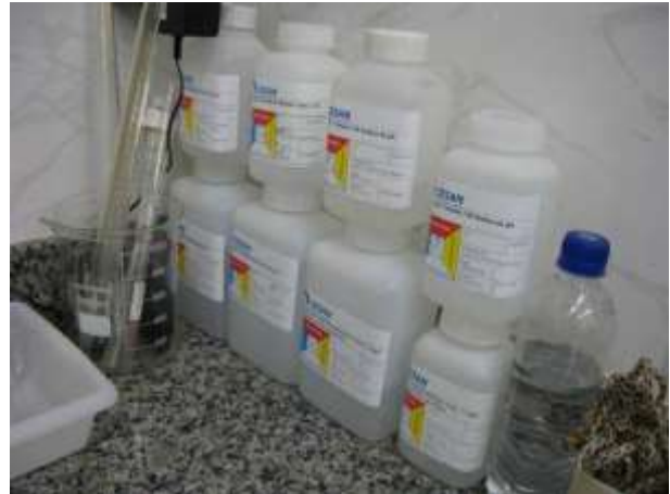
Figura 22 - Frasco de Eriocromo Cianina-R e Cloreto de Potássio vencidos.

Não conformidade NC12 – Inciso XVI do Artigo 13º da Resolução nº 018, de 30/05/2018. “Deixar de manter os laboratórios de análises físico-químicas e microbiológicas em condições de organização e limpeza, com adequado armazenamento e conservação dos produtos químicos e/ou reagentes e equipamentos calibrados”.