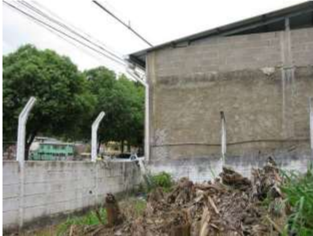
Figura 29 - EEAT Nova Viana.

Não conformidade NC17 – Inciso VII do Artigo 11º da Resolução nº 018, de 30/05/2018. “Deixar de prover as áreas de risco com estruturas e equipamentos de segurança que possam evitar a ocorrência de acidentes e o acesso de terceiros a área física das unidades operacionais”.