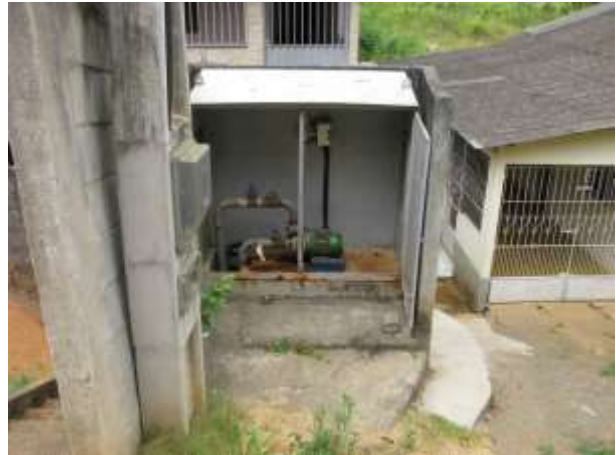
Figura 28 - EEAT Nova Belém .

Não conformidade NC16 – Inciso VI do Artigo 11º da Resolução nº 018, de 30/05/2018. “Deixar de prover as áreas de risco das instalações com sinalização de risco e/ou avisos de advertência de forma adequada à visualização de terceiros”.