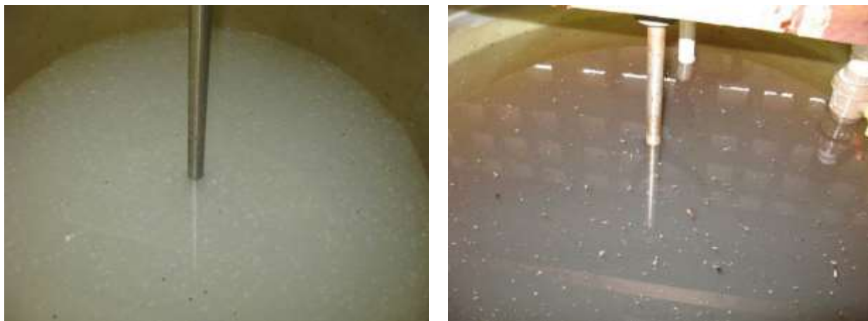
Figura 21 - Tanques expostos na Casa de Química.

Não conformidade NC11 – Inciso IV do Artigo 14º da Resolução nº 018, de 30/05/2018. “Deixar de realizar operação e manutenção adequada das unidades integrantes dos sistemas de abastecimento de água e/ou esgotamento sanitário, de acordo com as exigências dos regramentos vigentes”.