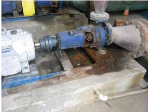
Figura 32 - EEAT Areinha.

CONSTATAÇÃO C20: Ausência de capa proteção no eixo de acoplamento do motor e a bomba na EEAT Areinha.