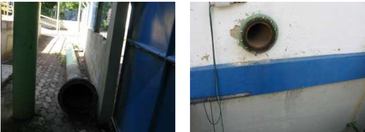
Figura 1 - EEAB Santo Agostinho.

CONSTATAÇÃO C1: Ausência de tubulação de sucção na EEAB Santo Agostinho de Viana.