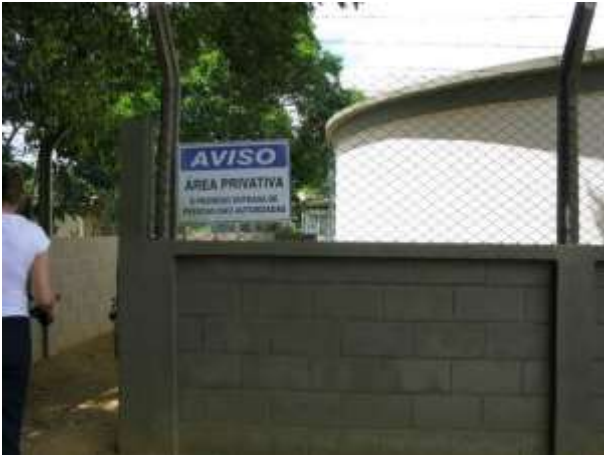
Figura 16 - Reservatório R2.

CONSTATAÇÃO C12: Ausência de placa de identificação das unidades do prestador de serviços no Reservatório R2 e no Booster Bela Vista.