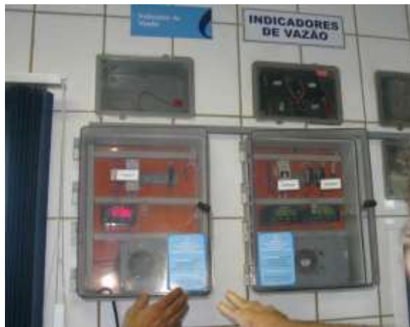
Figura 20 - Painel localizado no laboratório.

CONSTATAÇÃO C15: Painel de informações localizado no laboratório está com defeito na ETA de Nova Venécia.