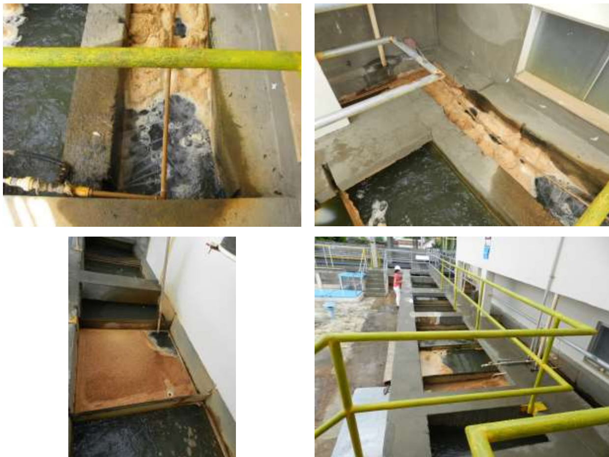
Figura 19 - Flocculador.

Não conformidade NC14 – Artigo 14, inciso IV, da Resolução ARSP 018 de 30/05/2018. Deixar de realizar operação e manutenção adequada das unidades integrantes dos sistemas de abastecimento de água e/ou esgotamento sanitário, de acordo com as exigências dos regramentos vigentes.