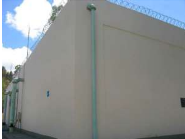
Figura 15 - Reservatório R3.

CONSTATAÇÃO C11: Ausência de escada para verificação de estado de conservação de tampas, dutos de ventilação e estado de conservação da laje de cobertura do reservatório R3.