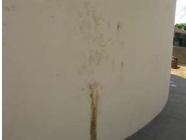
Figura 18 - Reservatório R2.

CONSTATAÇÃO C13: Presença de sinais de infiltração na parede externa do Reservatório R2.