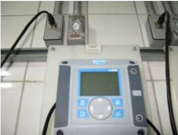
Figura 6 - Sistema de controle de pH de Água Bruta .