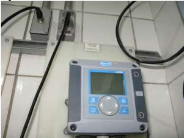
Figura 8 - Sistema de controle de pH da Água Tratada.