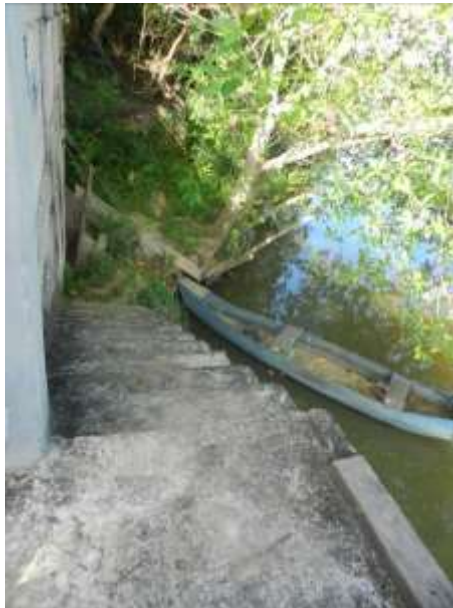
Figura 2 - Escada que dá acesso ao manancial.

CONSTATAÇÃO C2: Ausência de guarda corpo na escada que dá acesso ao manancial de captação de água bruta de Nova Venécia.