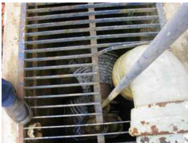
Figura 3 - Válvula de descarga da lavagem dos Filtros.

CONSTATAÇÃO C3: Vazamento na válvula de descarga da lavagem dos Filtros da ETA de Nova Venécia.