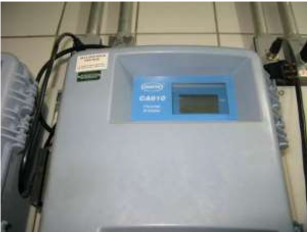
Figura 10 - Sistema de controle do Flúor da água tratada.

Não conformidade NC6 – Inciso IV do Artigo 14º da Resolução nº 018, de 30/05/2018, “Deixar de realizar operação e manutenção adequada das unidades integrantes dos sistemas de abastecimento de água e/ou esgotamento sanitário, de acordo com as exigências dos regramentos vigentes”.