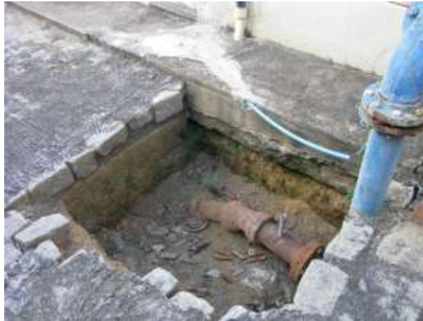
Figura 13 - Tubulações expostas na área do Booster Bela Vista.

CONSTATAÇÃO C9: Tubulações expostas na área do Booster Bela Vista em caixa de inspeção sem tampa.