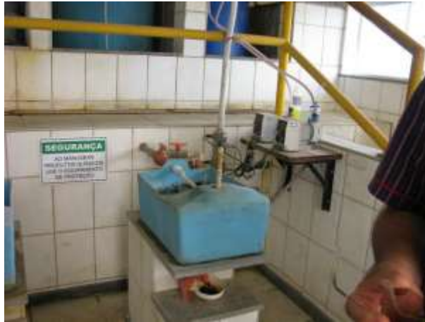
Figura 21 - Ausência de identificação no recipiente dosador.

CONSTATAÇÃO C16: Ausência de placa de identificação no recipiente dosador na Casa de Química da ETA Nova Venécia.