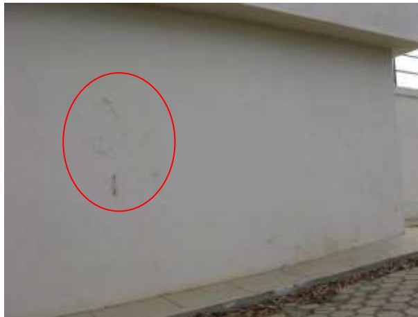
Figura 11 - Infiltração na parede externa do Decantador.

Não conformidade NC7 – Inciso IV do Artigo 14º da Resolução nº 018, de 30/05/2018, “Deixar de realizar operação e manutenção adequada das unidades integrantes dos sistemas de abastecimento de água e/ou esgotamento sanitário, de acordo com as exigências dos regramentos vigentes”.