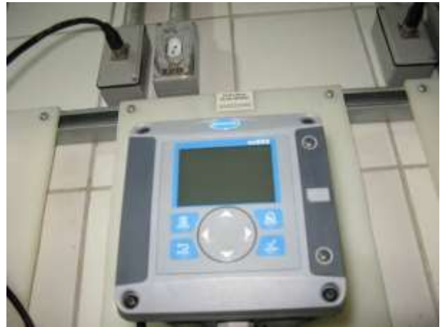
Figura 7 - Sistema de controle de pH da água alcalinizada.