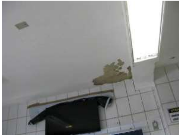
Figura 5 - Teto do Laboratório da ETA.

CONSTATAÇÃO C5: Mau estado de conservação do teto do Laboratório da ETA de Nova Venécia.