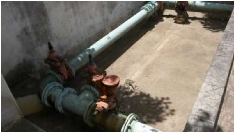
Figura 14 - Ausência de bomba reserva no Booster Aeroporto.

Não conformidade NC10 – Item III do Artigo 14º da Resolução nº 018, de 30/05/2018. Deixar de cumprir as normas técnicas, os procedimentos e/ou requisitos estabelecidos em regramento vigente para a implantação de todas as infraestruturas necessárias para a adequada prestação de serviços de abastecimento de água e de esgotamento sanitário.