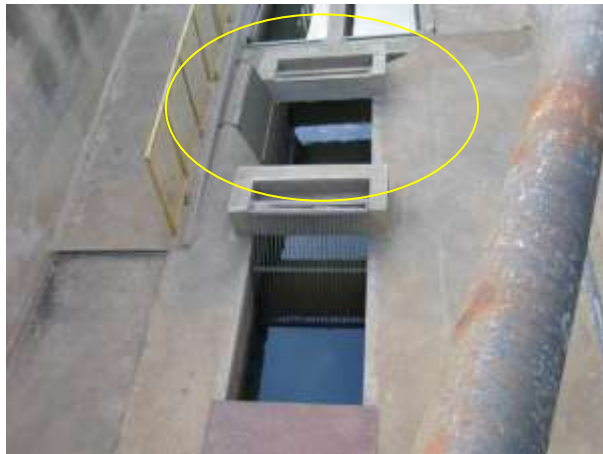
Figura 1 - Tratamento preliminar da captação de água bruta.

CONSTATAÇÃO C1: Gradeamento do tratamento preliminar da captação de água bruta da ETA de Nova Venécia está fora do lugar.