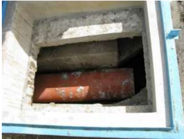
Figura 12 - interior do reservatório da ETA.

CONSTATAÇÃO C8: Presença de resíduos de obra no interior do reservatório da ETA de Nova Venécia.