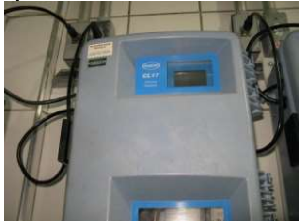
Figura 9 - Sistema de controle de Cloro da Água Tratada.