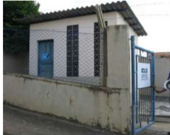
Figura 17 - Booster Bela Vista.

Não conformidade NC12 – Artigo 11, inciso V, da Resolução ARSP 018 de. 30/05/2018. Deixar de identificar as unidades operacionais e instalações pertencentes ao sistema de abastecimento de água e esgotamento sanitário, inclusive quanto ao horário de funcionamento dos postos de atendimento ao usuário.