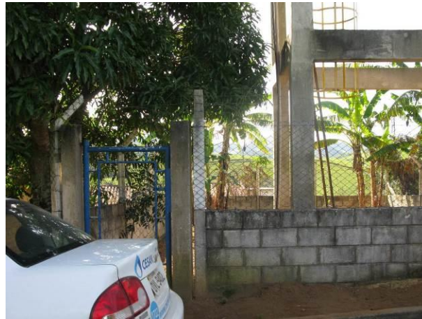
Figura 18 - Reservatório Morro do Quiabo.

Não conformidade NC18 – Art 11º, inciso V da Resolução ARSP nº 018/2018. Deixar de identificar as unidades operacionais e instalações pertencentes ao sistema de abastecimento de água e esgotamento sanitário, inclusive quanto ao horário de funcionamento dos postos de atendimento ao usuário.