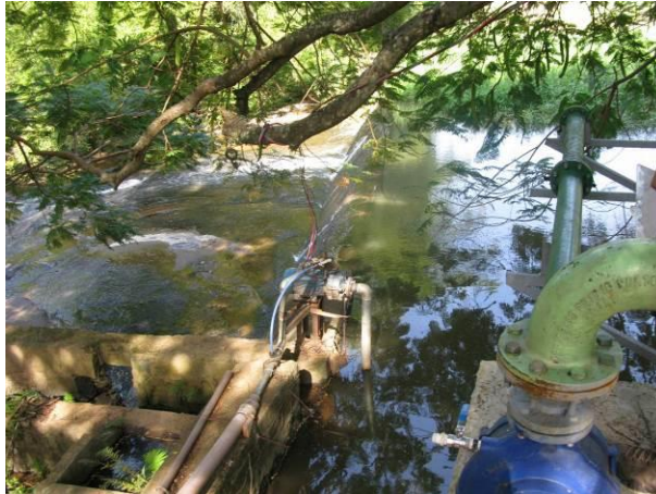
Figura 13- Captação no Rio Muqui em Camará

CONSTATAÇÃO C13: Falta isolamento da Captação no Rio Muqui em Camará.