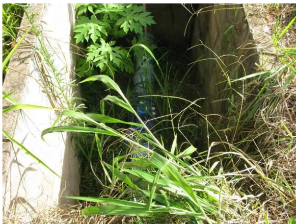
Figura 19 - Caixa de inspeção onde está instalado do medidor eletromagnético na ETA Camará.

Não conformidade NC19 – Art 14º, inciso IV da Resolução ARSP nº 018/2018. Deixar de realizar operação e manutenção adequada das unidades integrantes dos sistemas de abastecimento de água e/ou esgotamento sanitário, de acordo com as exigências dos regramentos vigentes.