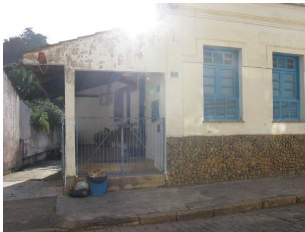
Figura 12 - Escritório de Atendimento de Muqui.

CONSTATAÇÃO C12: Ausência de rampa de acessibilidade ao Escritório de Atendimento de Muqui.