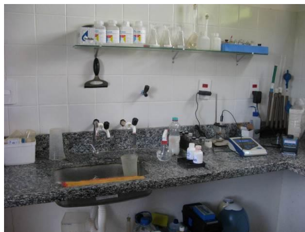
Figura 2 - ETA Camará.