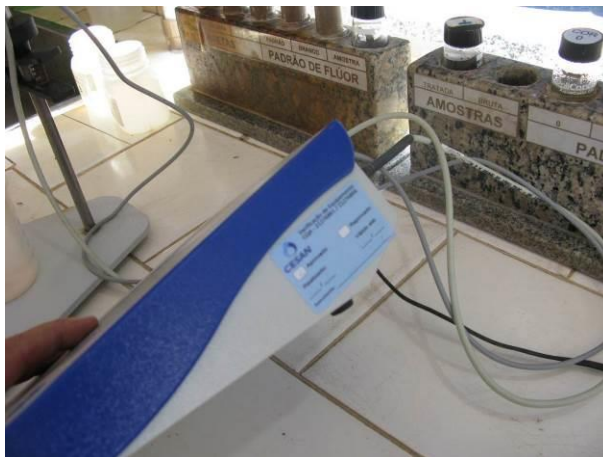
Figura 5 - Medidor de pH do laboratório da ETA Muqui.

CONSTATAÇÃO C4: Faltava o registro da calibração do medidor de pH do laboratório da ETA Muqui.