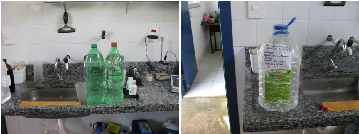
Figura 15 - ETA Camará.

Não conformidade NC15 – Inciso XVI do Artigo 13º da Resolução nº 018, de 30/05/2018, “Deixar de manter os laboratórios de análises físico-químicas e microbiológicas em condições de organização e limpeza, com adequado armazenamento e conservação dos produtos químicos e/ou reagentes e equipamentos calibrados”.