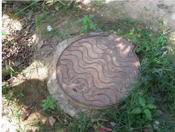
Figura 17 - Descarga da Rua Projetada no bairro São Gabriel em Camará.

Não conformidade NC17 – Art 14º, inciso IV da Resolução ARSP nº 018/2018. Deixar de realizar operação e manutenção adequada das unidades integrantes dos sistemas de abastecimento de água e/ou esgotamento sanitário, de acordo com as exigências dos regramentos vigentes.