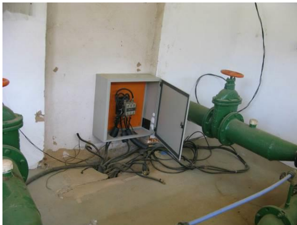
Figura 3 - EEAB do Córrego Rio Claro em Muqui.

CONSTATAÇÃO C2: Necessidade de organização do cabeamento elétrico na EEAB do Córrego Rio Claro em Muqui.