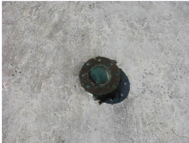
Figura 6 - Tela de proteção está rompida.

Não conformidade NC5 – Art 14º, inciso III da Resolução ARSP nº 018/2018. Deixar de cumprir as normas técnicas, os procedimentos e/ou requisitos estabelecidos em regramento vigente para a implantação de todas as infraestruturas necessárias para a adequada prestação de serviços de abastecimento de água e de esgotamento sanitário.