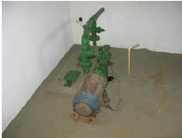
Figura 8 - Booster 03 – São Pedro.

Não conformidade NC7 – Art 14º, inciso III da Resolução ARSP nº 018/2018. Deixar de cumprir as normas técnicas, os procedimentos e/ou requisitos estabelecidos em regramento vigente para a implantação de todas as infraestruturas necessárias para a adequada prestação de serviços de abastecimento de água e de esgotamento sanitário.