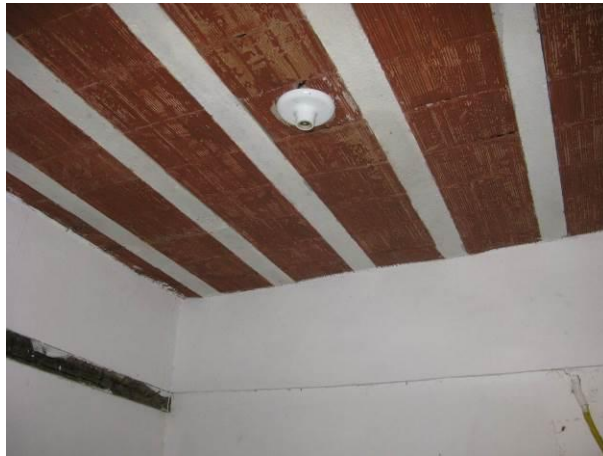
Figura 9 – EEAT da ETA Muqui.

Não conformidade NC8 – Art 14º, inciso III da Resolução ARSP nº 018/2018. . Deixar de cumprir as normas técnicas, os procedimentos e/ou requisitos estabelecidos em regramento vigente para a implantação de todas as infraestruturas necessárias para a adequada prestação de serviços de abastecimento de água e de esgotamento sanitário.