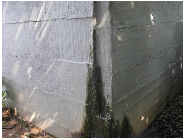
Figura 10 - Reservatório 05 – Alto Cruzeiro.

Não conformidade NC9 – Art 14º, inciso IV da Resolução ARSP nº 018/2018. Deixar de realizar operação e manutenção adequada das unidades integrantes dos sistemas de abastecimento de água e/ou esgotamento sanitário, de acordo com as exigências dos regramentos vigentes.