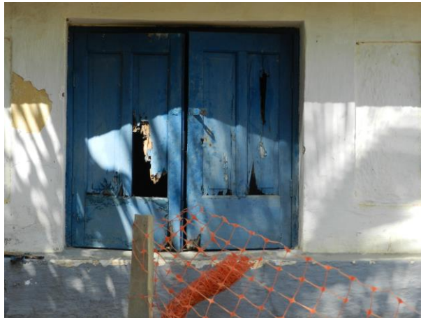
Figura 7 - Portinhola de acesso ao reservatório R2 da ETA Muqui.

Não conformidade NC6 – Art 14º, inciso IV da Resolução ARSP nº 018/2018. Deixar de realizar operação e manutenção adequada das unidades integrantes dos sistemas de abastecimento de água e/ou esgotamento sanitário, de acordo com as exigências dos regramentos vigentes.