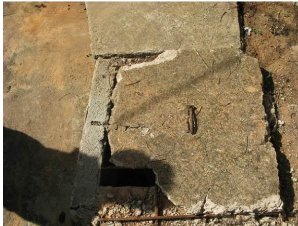
Figura 16 - Tampa quebrada no Booster 01 - Camará.

Não conformidade NC16 – Art 14º, inciso IV da Resolução ARSP nº 018/2018. Deixar de realizar operação e manutenção adequada das unidades integrantes dos sistemas de abastecimento de água e/ou esgotamento sanitário, de acordo com as exigências dos regramentos vigentes.