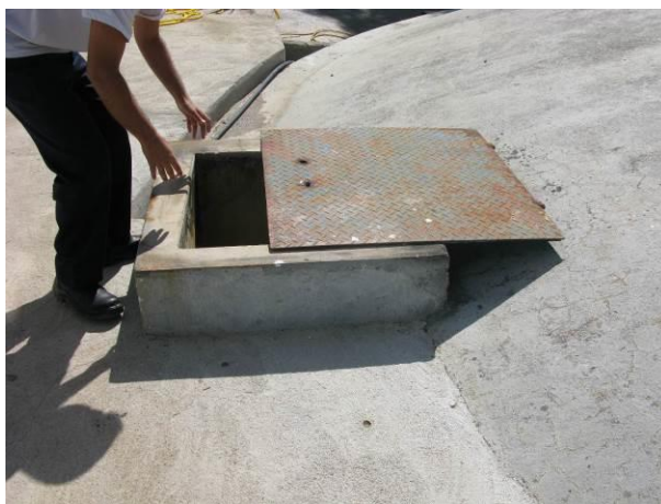
Figura 11 - Reservatório Principal (R1) da ETA Muqui.

CONSTATAÇÃO C11: Necessidade de adequação da Tampa do Reservatório Principal (R1) da ETA Muqui.