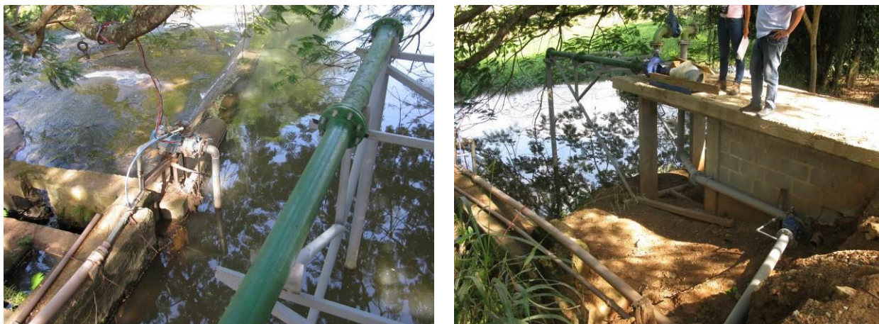
Figura 14 - Captação do Rio Muqui em Camará.

Não conformidade NC14 – Art 14º, inciso III da Resolução ARSP nº 018/2018. Deixar de cumprir as normas técnicas, os procedimentos e/ou requisitos estabelecidos em regramento vigente para a implantação de todas as infraestruturas necessárias para a adequada prestação de serviços de abastecimento de água e de esgotamento sanitário.