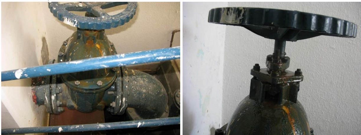
Figura 4 - Registro de descarga do decantador 2.

CONSTATAÇÃO C3: Registro de descarga do decantador 2 com vazamento na ETA Muqui Sede.