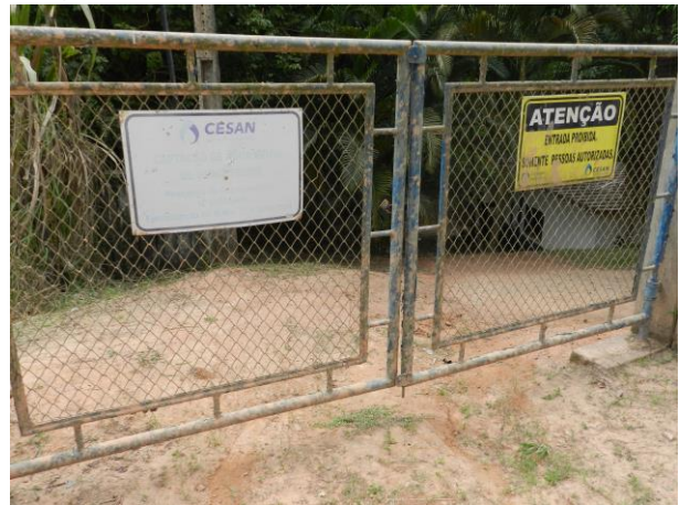
Figura 3 - Entrada captação Muniz Freire Sede.

Não conformidade NC2 – Artigo 11, inciso V, da Resolução ARSP 018 de 30/05/2018. Deixar de identificar as unidades operacionais e instalações pertencentes ao sistema de abastecimento de água e esgotamento sanitário, inclusive quanto ao horário de funcionamento dos postos de atendimento ao usuário.