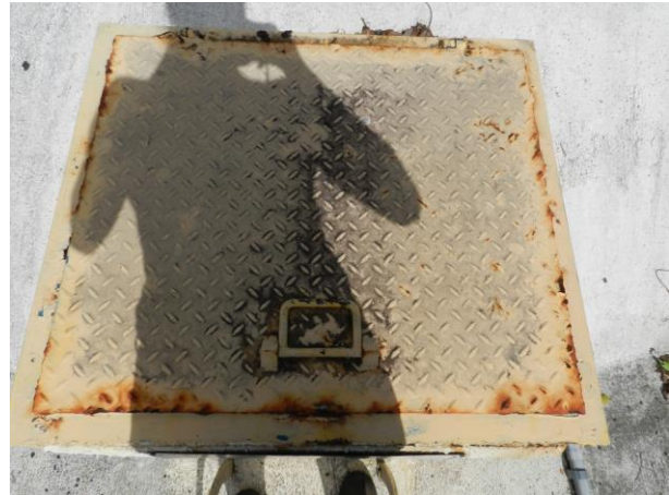
Figura 8 - Tampa do reservatório 01 da ETA Muniz Freire Sede.