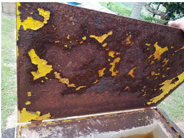
Figura 11 - Tampa do tanque de constato da ETA Piaçú.

Não conformidade NC6 – Artigo 14, inciso IV, da Resolução ARSP 018 de. 30/05/2018. Deixar de realizar operação e manutenção adequada das unidades integrantes dos sistemas de abastecimento de água e/ou esgotamento sanitário, de acordo com as exigências dos regramentos vigentes.