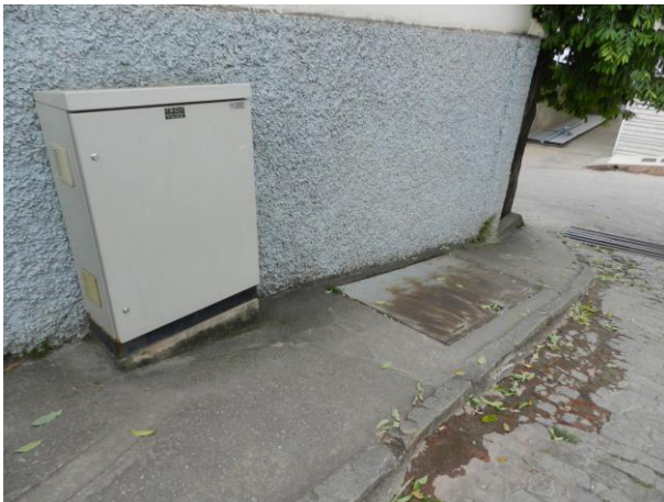
Figura 2 - Booster Lino Ribeiro Soares.

CONSTATAÇÃO C2: Ausência de identificação no booster Lino Ribeiro Soares e identificação deficiente na Captação de Água Bruta de Muniz Freire Sede.