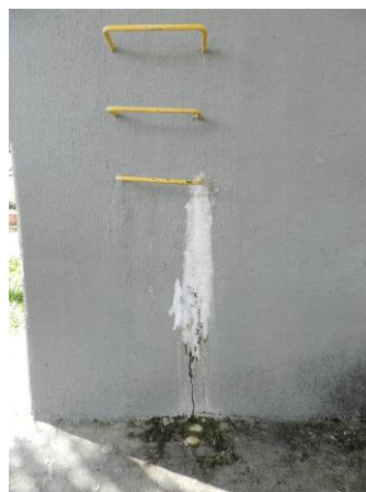
Figura 13 - Reservatório 02.

Não conformidade NC7 – Artigo 14, inciso IV, da Resolução ARSP 018 de. 30/05/2018. Deixar de realizar operação e manutenção adequada das unidades integrantes dos sistemas de abastecimento de água e/ou esgotamento sanitário, de acordo com as exigências dos regramentos vigentes.