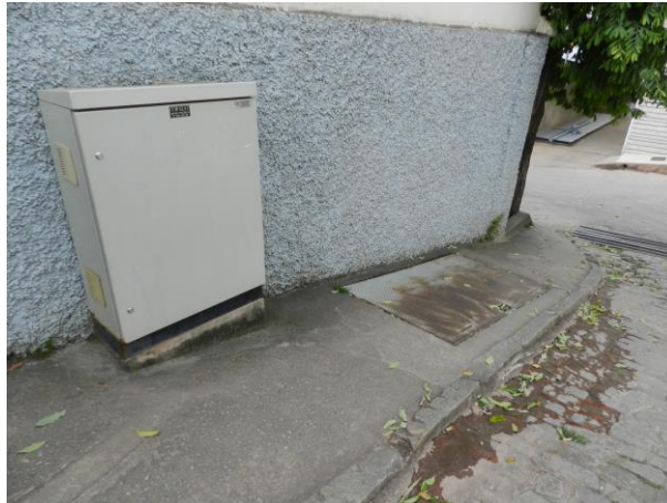
Figura 5 – Booster Lino Ribeiro Soares.

CONSTATAÇÃO C4: Ausência de sinalização de risco de choque elétrico no Booster Lino Ribeiro Soares.