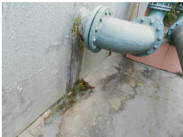
Figura 12 - ETA Muniz Freire - Sede.