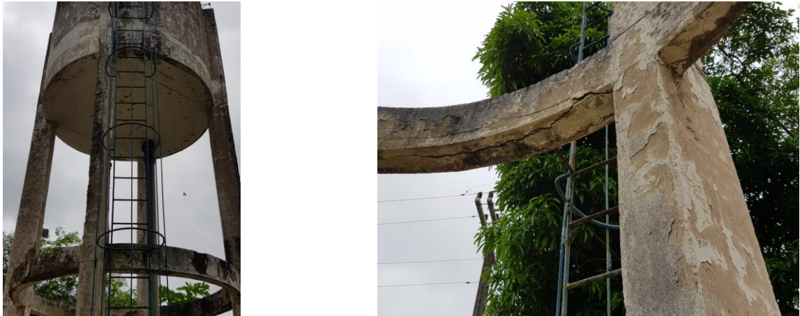
Figura 18 - Reservatório elevado ETA Piaçú.

Não conformidade NC12 – Artigo 14, inciso IV, da Resolução ARSP 018 de. 30/05/2018. Deixar de realizar operação e manutenção adequada das unidades integrantes dos sistemas de abastecimento de água e/ou esgotamento sanitário, de acordo com as exigências dos regramentos vigentes.