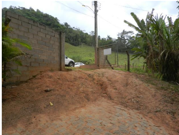
Figura 6 – Acesso à captação.

Não conformidade NC5 - Inciso IV do Artigo 14º da Resolução nº 018, de 30/05/2018 Deixar de realizar operação e manutenção adequada das unidades integrantes dos sistemas de abastecimento de água e/ou esgotamento sanitário, de acordo com as exigências dos regramentos vigentes.