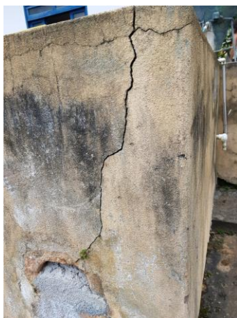
Figura 16 - ETA Piaçú.

Não conformidade NC10 – Artigo 14, inciso IV, da Resolução ARSP 018 de. 30/05/2018. Deixar de realizar operação e manutenção adequada das unidades integrantes dos sistemas de abastecimento de água e/ou esgotamento sanitário, de acordo com as exigências dos regramentos vigentes.