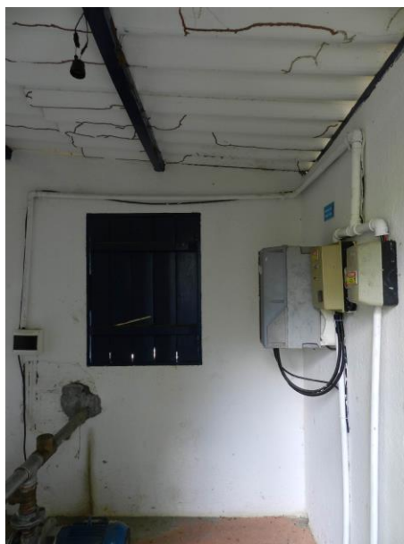
Figura 14 - Booster 01.

Não conformidade NC8 – Artigo 14, inciso III, da Resolução ARSP 018 de 30/05/2018. Deixar de cumprir as normas técnicas, os procedimentos e/ou requisitos estabelecidos em regramento vigente para a implantação de todas as infraestruturas necessárias para a adequada prestação de serviços de abastecimento de água e de esgotamento sanitário.