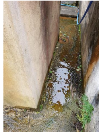
Figura 15 - ETA Piaçú.

Não conformidade NC9 – Artigo 14, inciso IV, da Resolução ARSP 018 de. 30/05/2018. Deixar de realizar operação e manutenção adequada das unidades integrantes dos sistemas de abastecimento de água e/ou esgotamento sanitário, de acordo com as exigências dos regramentos vigentes.