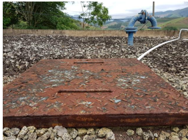
Figura 10 - Tampa do reservatório retangular da ETA Piaçú.