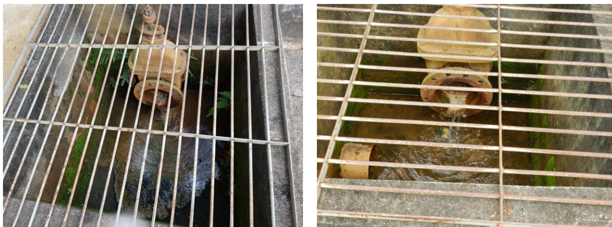
Figura 17 - Válvulas dos filtros da ETA Piaçú.

Não conformidade NC11 – Artigo 14, inciso IV, da Resolução ARSP 018 de. 30/05/2018. Deixar de realizar operação e manutenção adequada das unidades integrantes dos sistemas de abastecimento de água e/ou esgotamento sanitário, de acordo com as exigências dos regramentos vigentes.