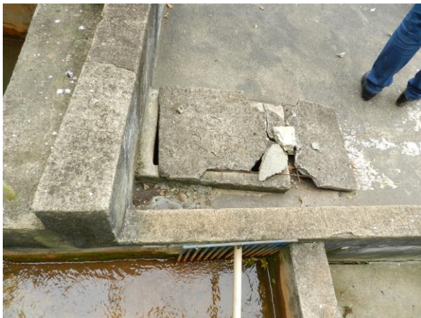
Figura 9 - Tampa do decantador da ETA Piaçú.