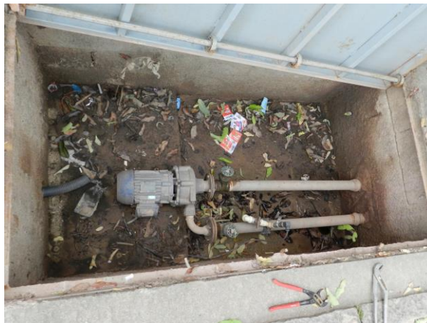
Figura 1 - Booster Lino Ribeiro Soares.

CONSTATAÇÃO C1: Ausência de bom reserva instalada no booster Lino Ribeiro Soares.