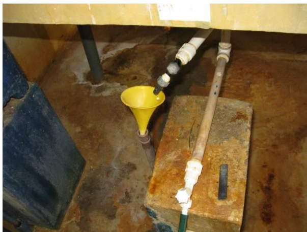
Figura 22 - Dosadoras na Casa de Química da ETA do Distrito de Pequiá - Iúna

CONSTATAÇÃO C20: Falta identificação em uma das dosadoras na Casa de Química da ETA do Distrito de Pequiá - Iúna.