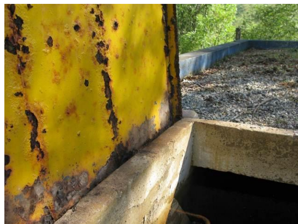
Figura 27 - Tapa do reservatório quadrado.