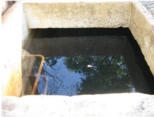
Figura 33 - Reservatório quadrado da ETA do Distrito de Pequiá - Iúna

Não conformidade NC27 – Art 14º, inciso IV da Resolução ARSP nº 018/2018. Deixar de realizar operação e manutenção adequada das unidades integrantes dos sistemas de abastecimento de água e/ou esgotamento sanitário, de acordo com as exigências dos regramentos vigentes.