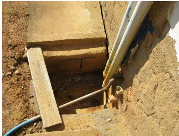
Figura 30 - ETA do Distrito de Pequiá - Iúna

CONSTATAÇÃO C24: Caixa de passagem sem tampa e em mau estado de conservação na ETA do Distrito de Pequiá - Iúna.