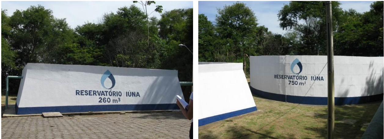
Figura 15 - Reservatórios 260 e 750 m 3 da ETA Iúna.

CONSTATAÇÃO C13: Não há escada de acesso ao topo dos reservatórios reservatórios de 260 e 750 m 3 da ETA Iúna.