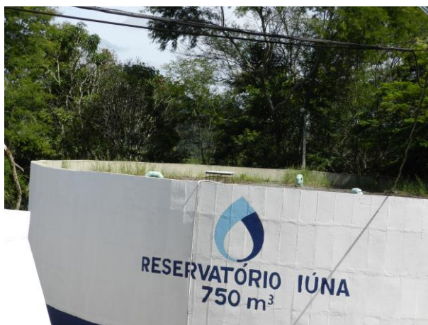
Figura 16 - Reservatório de 750m 3 da ETA Iúna.

CONSTATAÇÃO C14: Há vegetação na laje superior do reservatório de 750m 3 da ETA Iúna.