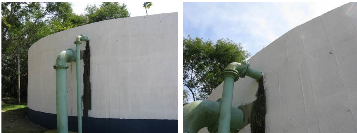
Figura 17 - Reservatório de 750m 3 na ETA de Lúna.

CONSTATAÇÃO C15: Há vazamento aparente no encontro do tubo de drenagem da laje de cobertura com a parede do reservatório de 750m 3 na ETA de Lúna.