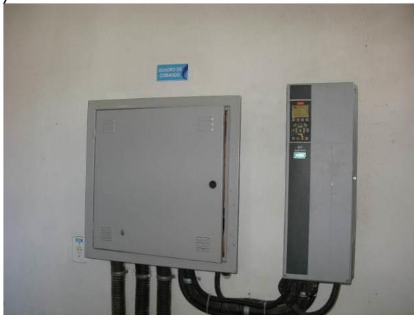
Figura 18 - Painel da EEAT da ETA de Lúna.

CONSTATAÇÃO C16: Ausência de sinalização de risco de choque elétrico no painel da EEAT do Pito (ETA Lúna).