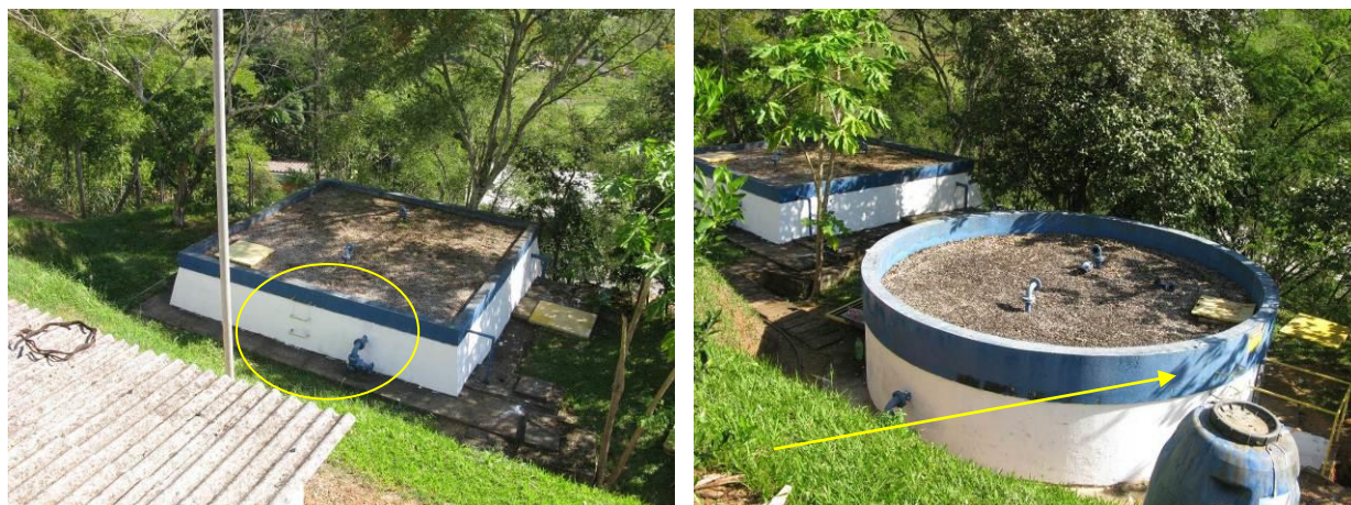
Figura 31 - Reservatórios da ETA do Distrito de Pequiá - Iúna

CONSTATAÇÃO C25: Escadas antigas e em mau estado de conservação dos reservatórios da ETA do Distrito de Pequiá - Iúna.