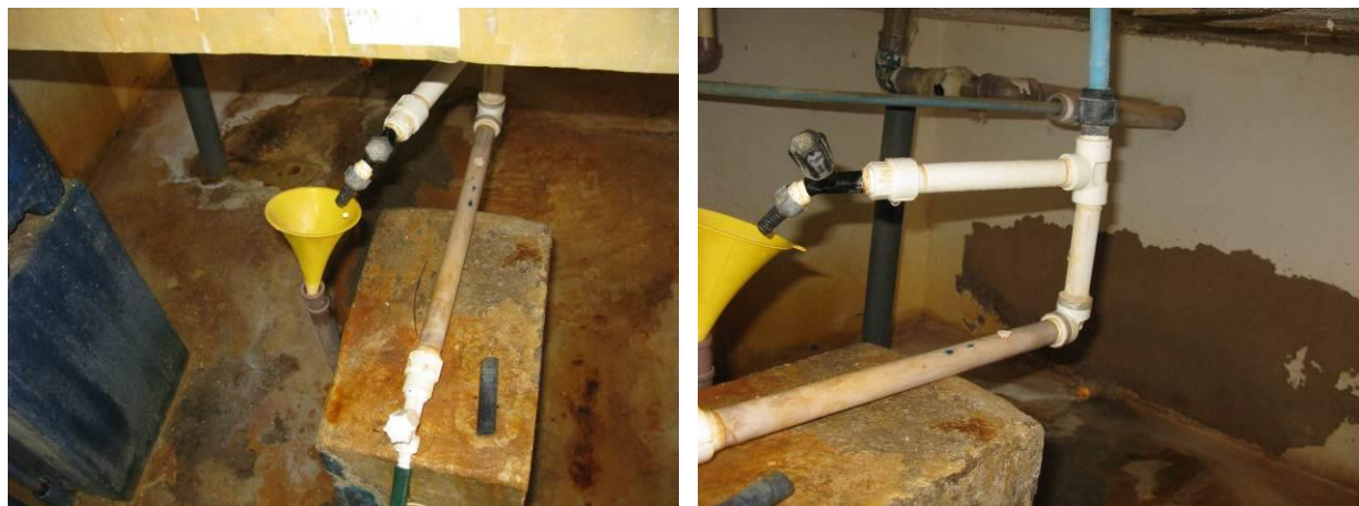
Figura 21 - ETA do Distrito de Pequiá - Iúna

CONSTATAÇÃO C19: A edificação da Casa de Química está em mau estado de conservação na ETA do Distrito de Pequiá - Iúna.