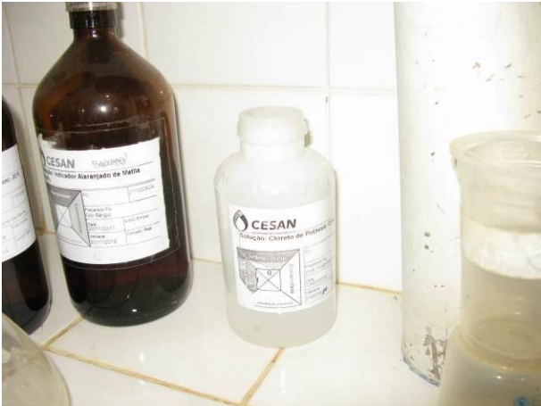
Figura 23 - Alaranjado de Metila.

CONSTATAÇÃO C21: Há produtos químicos fora da validade na ETA do Distrito de Pequiá – Iúna: Alaranjado de Metila, Arsenito de Sódio e Cloreto de Potássio.