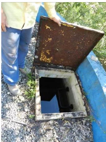
Figura 28 - Tapa do reservatório circular.