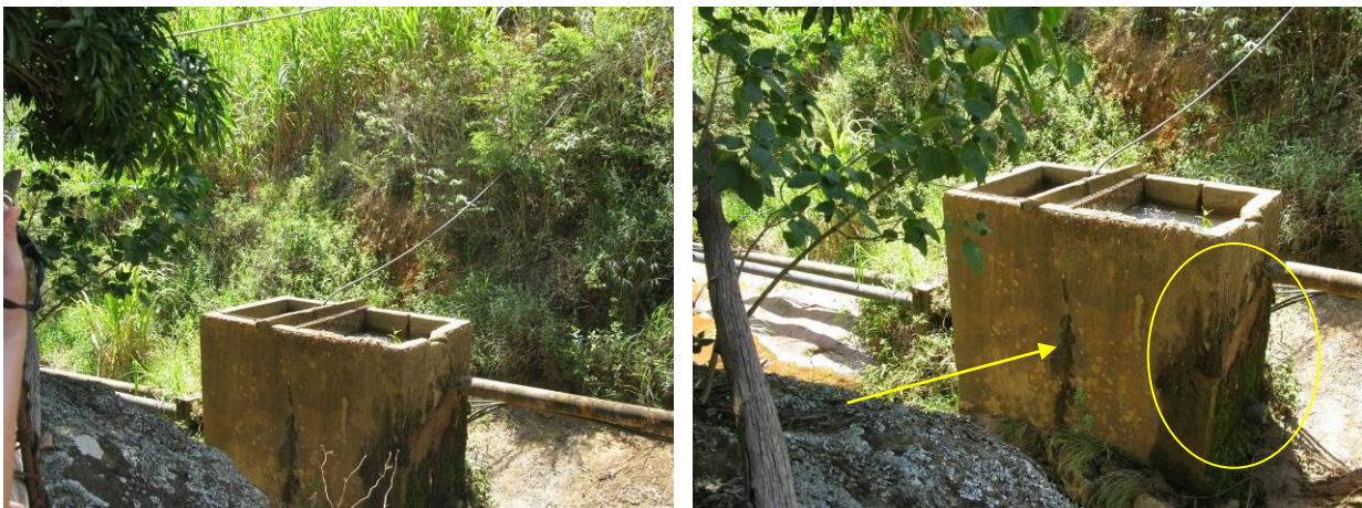
Figura 1- Captação do Córrego Boa Vista (Serrinha) - Iúna

CONSTATAÇÃO C1: A caixa do gradeamento apresenta trincas na Captação do Córrego Boa Vista (Serrinha) de Iúna.