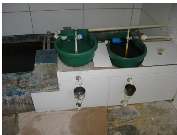
Figura 7 - Dosadoras da ETA Lúna..

CONSTATAÇÃO C8: Faltam identificações dos produtos químicos nas dosadoras da ETA Lúna.