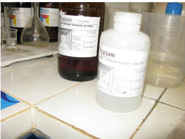
Figura 25 - Cloreto de Potássio.

Não conformidade NC21 – Art 13º, inciso XVI da Resolução ARSP nº 018/2018. Deixar de manter os laboratórios de análises físico-químicas e microbiológicas em condições de organização e limpeza, com adequado armazenamento e conservação dos produtos químicos e/ou reagentes e equipamentos calibrados.