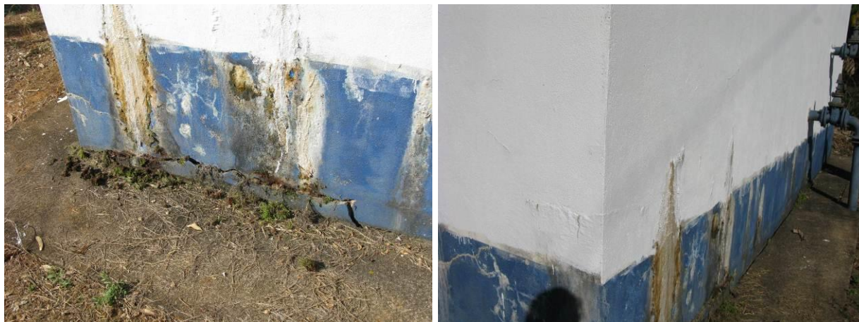
Figura 19 - Decantador no Distrito de Pequiá - Iúna.

CONSTATAÇÃO C17: Há sinais de infiltração nas paredes externas do Decantador da ETA do Distrito de Pequiá - Iúna.