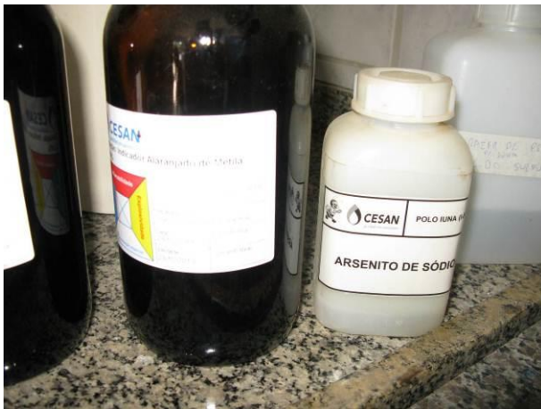
Figura 9 - Arsenito de Sódio.

CONSTATAÇÃO C10: Há dois frascos de produtos químicos sem conter data de validade: Ácido Sulfúrico e Arsenito de sódio; e um frasco de cloreto de potássio (Conc: 3 M) fora do prazo de validade (18/05/2018) na ETA Iúna.