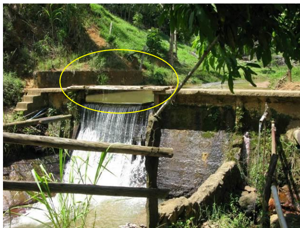
Figura 2- Captação do Córrego Boa Vista (Serrinha) - Iúna

CONSTATAÇÃO C2: A passarela de acesso está provisória desde a última cheia que causou a quebra da passagem de concreto existente na Captação do Córrego Boa Vista (Serrinha) de Iúna.