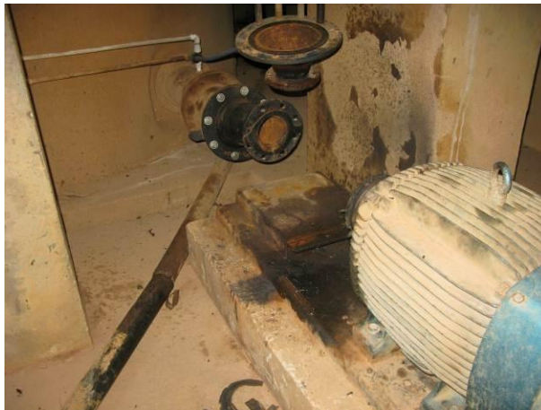
Figura 5 - Captação do Rio Pardo em Iúna.

Não conformidade NC5 – Inciso III do Artigo 14º da Resolução nº 018, de 30/05/2018, “Deixar de cumprir as normas técnicas, os procedimentos e/ou requisitos estabelecidos em regramento vigente para a implantação de todas as infraestruturas necessárias para a adequada prestação de serviços de abastecimento de água e de esgotamento sanitário”.