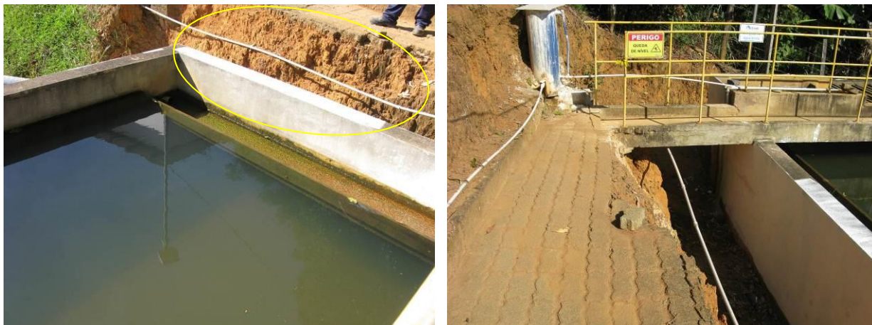
Figura 20 - ETA do Distrito de Pequiá - Iúna

CONSTATAÇÃO C18: Há trechos das calçadas de acesso em mau estado de conservação, devido à queda de solo de sustentação na ETA do Distrito de Pequiá - Iúna.