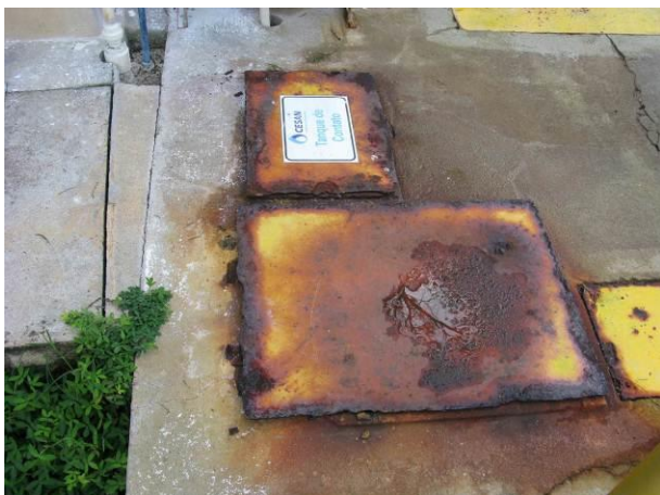
Figura 12 -Tampa de acesso ao Tanque de contato.

CONSTATAÇÃO C11: Tampas enferrujadas na ETA lúna no acesso ao Tanque de contato e no acesso ao canal dos Filtros.