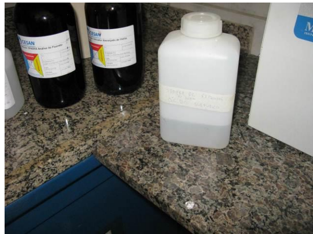
Figura 10 - Ácido Sulfúrico.