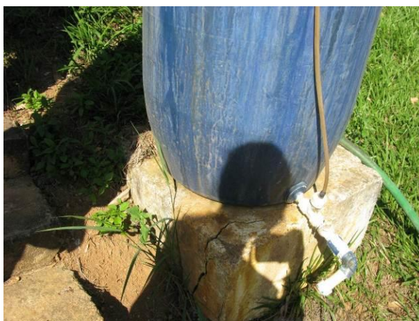
Figura 29 - Inexistência de tanque de contenção.

CONSTATAÇÃO C23: Inexistência de tanque de contenção para o tanque de recebimento de sulfato na ETA de Pequiá (Iúna).