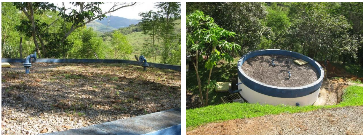
Figura 32 - Dutos de ventilação dos reservatórios da ETA do Distrito de Pequiá - Iúna

Não conformidade NC26 – Artigo 14, inciso III, da Resolução ARSP 018 de. 30/05/2018. Deixar de cumprir as normas técnicas, os procedimentos e/ou requisitos estabelecidos em regramento vigente para a implantação de todas as infraestruturas necessárias para a adequada prestação de serviços de abastecimento de água e de esgotamento sanitário.