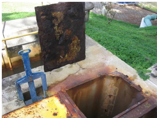
Figura 13 - Tampa de acesso ao canal dos Filtros.

Não conformidade NC11 – Art 14º, inciso IV da Resolução ARSP nº 018/2018. Deixar de realizar operação e manutenção adequada das unidades integrantes dos sistemas de abastecimento de água e/ou esgotamento sanitário, de acordo com as exigências dos regramentos vigentes.