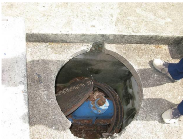
Figura 14 - Caixa da válvula de manobra.

CONSTATAÇÃO C12: Caixa da válvula de manobra de distribuição do reservatório de 260m³ com tampa deslocada na ETA Iúna.