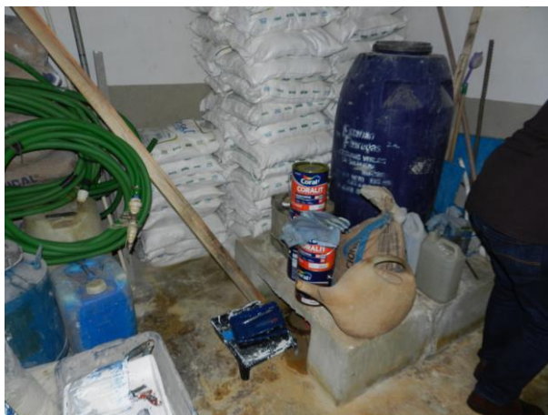
Figura 8 - Armazenamento de produtos na ETA Iúna.

CONSTATAÇÃO C9: Faltam condições adequadas para armazenamento de produtos na ETA Iúna.