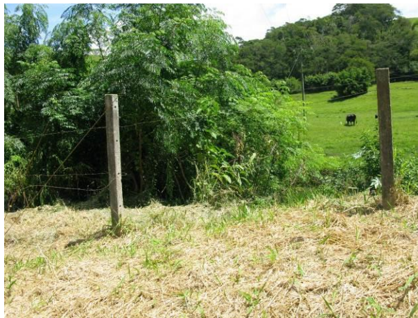
Figura 3 - Captação do Rio Pardo em Iúna.

CONSTATAÇÃO C3: Falhas no cercamento da captação do Rio Pardo em Iúna.