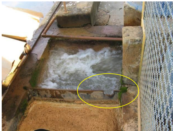
Figura 6 - ETA Iúna.

CONSTATAÇÃO C7: Há uma chicana do floculador em mau estado de conservação na ETA Iúna.