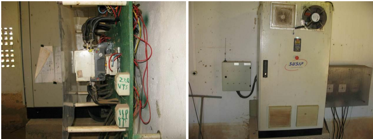
Figura 4 - Quadros elétricos da Captação do Rio Pardo em Iúna.

Não conformidade NC4 – Art 14º, inciso IV da Resolução ARSP nº 018/2018. Deixar de realizar operação e manutenção adequada das unidades integrantes dos sistemas de abastecimento de água e/ou esgotamento sanitário, de acordo com as exigências dos regramentos vigentes.