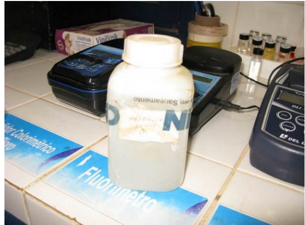
Figura 24 - Arsenito de Sódio.