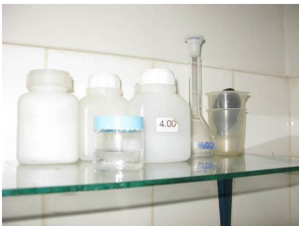
Figura 5 - Ácido Sulfúrico e Arsenito de sódio.

CONSTATAÇÃO C6: Dois frascos de produtos químicos sem conter data de validade: Ácido Sulfúrico e Arsenito de sódio; e Solução tampão 7,0 para análise de pH vencida desde 07/02/2019 no laboratório da ETA Irupi.