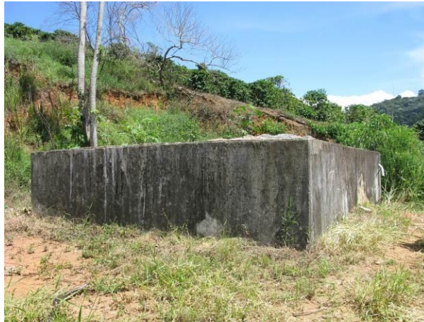
Figura 17 - Ausência de escada de acesso ao topo do reservatório.

Não conformidade NC14 – Inciso III do Artigo 14º da Resolução nº 018, de 30/05/2018, “Deixar de cumprir as normas técnicas, os procedimentos e/ou requisitos estabelecidos em regramento vigente para a implantação de todas as infraestruturas necessárias para a adequada prestação de serviços de abastecimento de água e de esgotamento sanitário”.