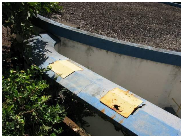
Figura 8 - Reservatório da ETA Irupi.