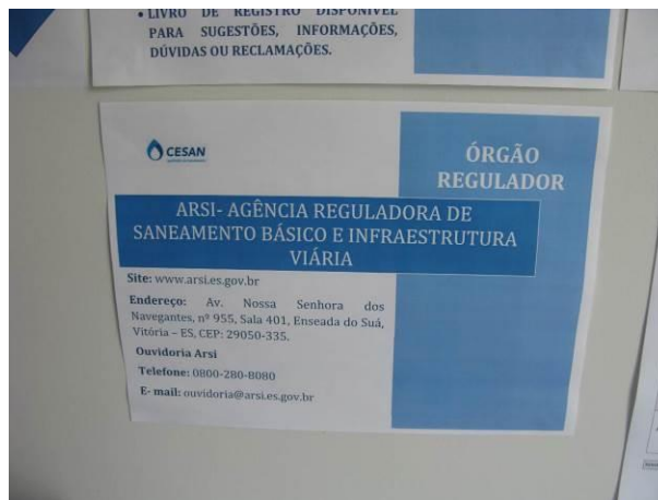
Figura 21 – Informações desatualizadas.

CONSTATAÇÃO C18: Encontram-se desatualizadas no escritório de atendimento: Placa de identificação do órgão regulador (a existente é da antiga ARSI e não ARSP), bem como informações sobre site da ARSP e endereço de e-mail da Ouvidoria (Observar recomendação (R1)).