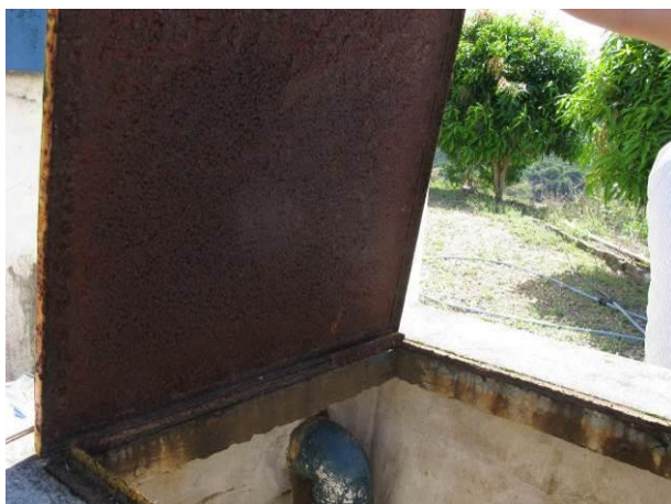
Figura 9 - Tampa de acesso à descarga do reservatório.