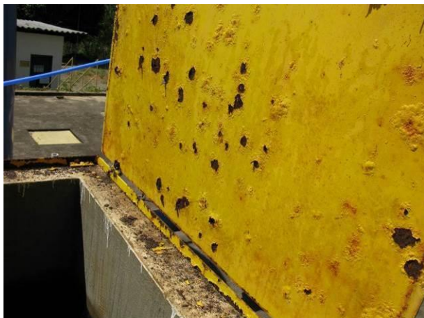
Figura 7 - Tampa do Tanque de Contato.

CONSTATAÇÃO C7: Tampa do tanque de Contato, tampas metálicas no reservatório e tampa de acesso à descarga do reservatório estão enferrujadas na ETA Irupi. A tampa do reservatório Eucalipto também necessita de manutenção.