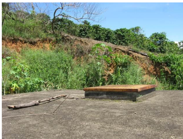
Figura 10 - Reservatório Eucalipto.

Não conformidade NC7 – Art 14º, inciso IV da Resolução ARSP nº 018/2018. Deixar de realizar operação e manutenção adequada das unidades integrantes dos sistemas de abastecimento de água e/ou esgotamento sanitário, de acordo com as exigências dos regramentos vigentes.