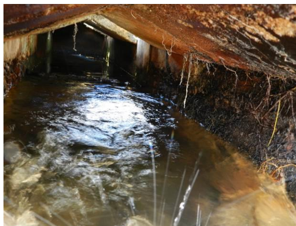
Figura 13 - Necessidade de limpeza e manutenção no canal de entrada da água no reservatório da ETA de Irupi.

Não conformidade NC10 – Art 14º, inciso IV da Resolução ARSP nº 018/2018. Deixar de realizar operação e manutenção adequada das unidades integrantes dos sistemas de abastecimento de água e/ou esgotamento sanitário, de acordo com as exigências dos regramentos vigentes.