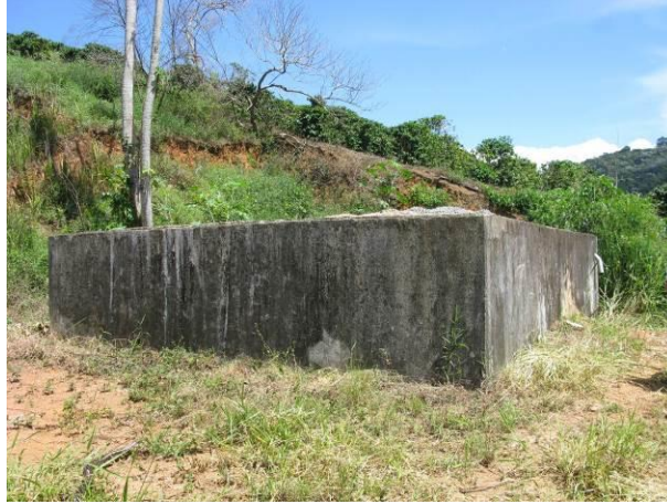
Figura 19 - Ausência de cercamento.

Não conformidade NC16 – Art 11º, inciso VII da Resolução ARSP nº 018/2018. Deixar de prover as áreas de risco com estruturas e equipamentos de segurança que possam evitar a ocorrência de acidentes e o acesso de terceiros a área física das unidades operacionais.