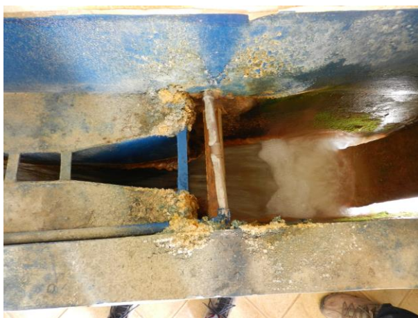
Figura 2 - Calha parshall da ETA de Irupi.

CONSTATAÇÃO C2: Há corrosão na calha parshall da ETA de Irupi e incrustação de material, demandando manutenção.