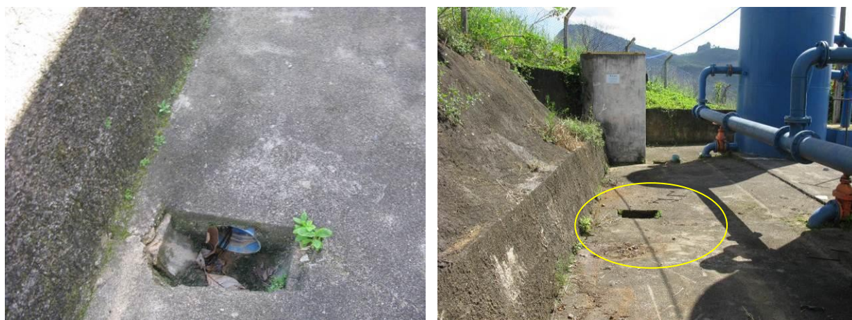
Figura 11 - Caixas de inspeção na ETA Irupi.

CONSTATAÇÃO C8: Caixas de inspeção do pátio sem tampas na ETA Irupi.