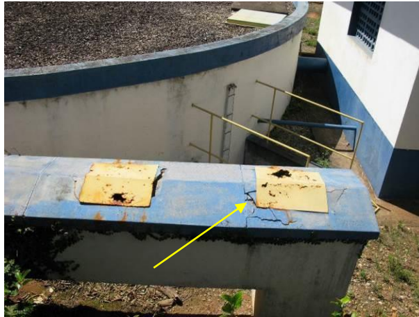
Figura 12 - Cobertura de concreto trincadas.

CONSTATAÇÃO C9: Cobertura de concreto trincadas na calha de recepção da água tratada no Reservatório da ETA Irupi.