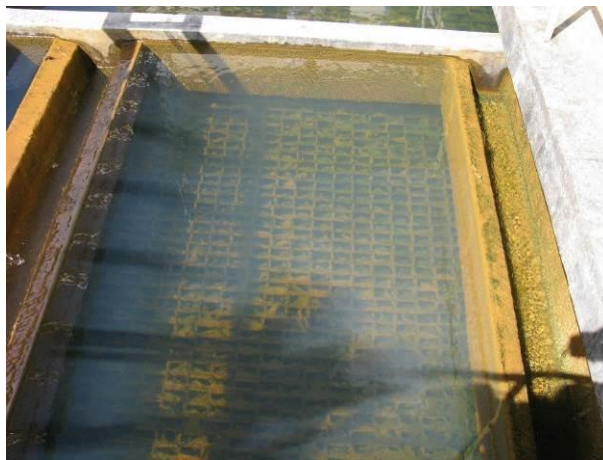
Figura 4 – Decantador da ETA de Irupi

CONSTATAÇÃO C4: Excesso de lodo no decantador da ETA de Irupi.