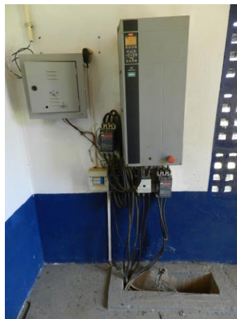
Figura 1- EEAB de Irupi

CONSTATAÇÃO C1: Instalações elétricas desprotegidas na captação da EEAB de Irupi.