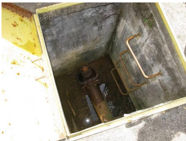
Figura 14 - Caixa da válvula de controle da distribuição.

CONSTATAÇÃO C11: Caixa da válvula de controle da distribuição com muita água no Reservatório da ETA Irupi indicando aparente vazamento na válvula.