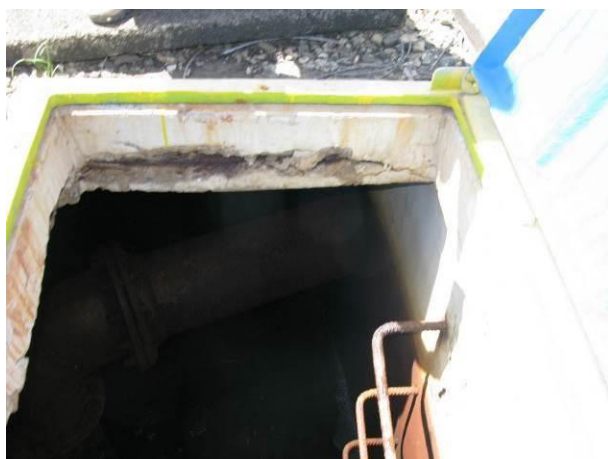
Figura 16 - Corrosão na borda da abertura da tampa de inspeção do reservatório da ETA Irupi.

CONSTATAÇÃO C13: Há corrosão na borda da abertura da tampa de inspeção do reservatório da ETA Irupi.