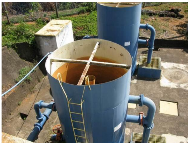
Figura 20 - Filtro da ETA de Irupi

CONSTATAÇÃO C17: Ausência de guarda corpo na escada de acesso ao topo do filtro da ETA de Irupi.