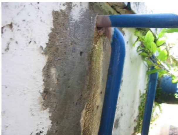
Figura 15 - Vazamento entre a parede e a tubulação de dosagem de produto químico na entrada do reservatório.

CONSTATAÇÃO C12: Vazamento entre a parede e a tubulação de dosagem de produto químico na entrada do reservatório na ETA Irupi.