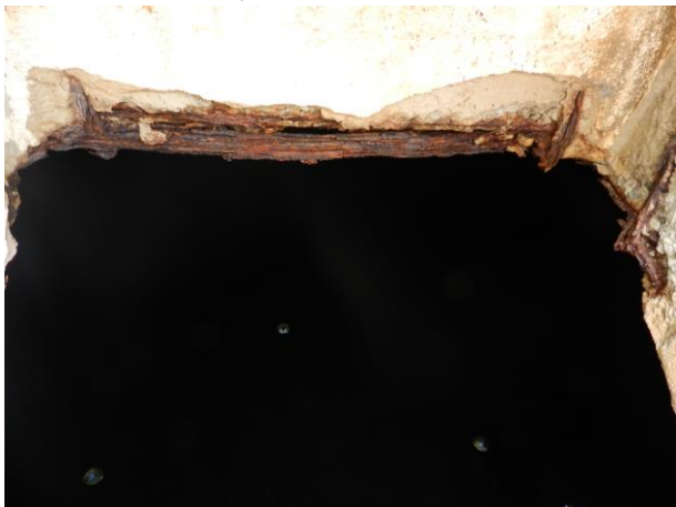
Figura 14 - Armadura exposta na caixa de inspeção do reservatório.

CONSTATAÇÃO C10: Armadura exposta e demanda de manutenção da caixa de inspeção e tampa do reservatório de 150 m 3 localizado na ETA de Ibatiba.