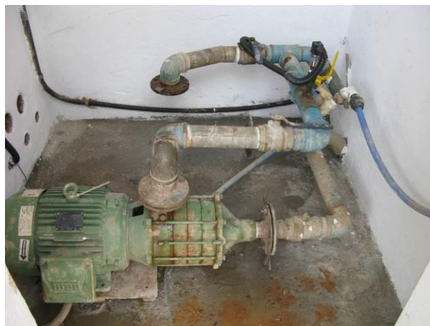
Figura 8 - Booster 3 – Novo Brasil.