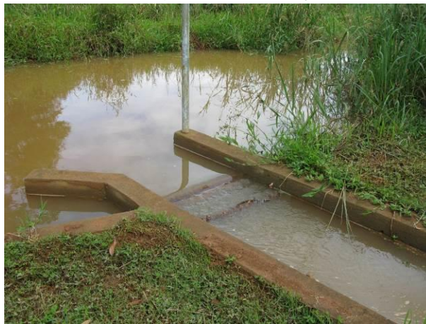
Figura 1 - Captação do Córrego São José.

Não conformidade NC1 – Inciso IV do Artigo 14º da Resolução nº 018, de 30/05/2018 Deixar de realizar operação e manutenção adequada das unidades integrantes dos sistemas de abastecimento de água e/ou esgotamento sanitário, de acordo com as exigências dos regramentos vigentes.