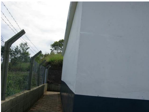
Figura 12 - Reservatório São José.

CONSTATAÇÃO C9: Ausência de escadas de acesso ao topo dos reservatórios: São José e do reservatório de 200m 3 localizado na ETA de Ibatiba.