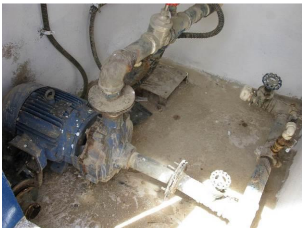
Figura 7 - Booster Armindo José.

CONSTATAÇÃO C7: Ausência de bomba reserva nas seguintes unidades: Booster Armindo José, Booster 3 – Novo Brasil e Booster 2 – Bairro Floresta.