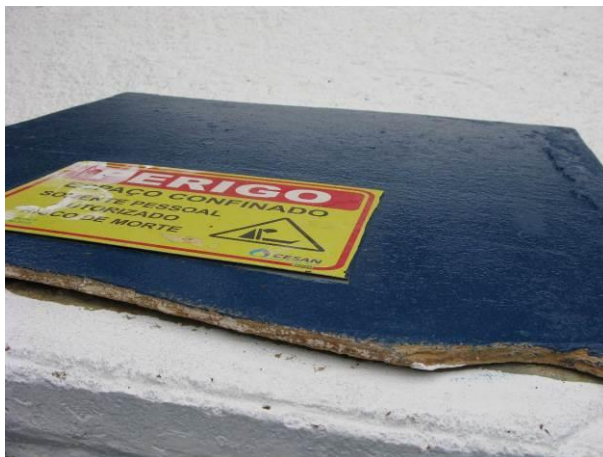
Figura 15 - Demanda de manutenção da tampa do reservatório de 150 m 3 .

Não conformidade NC10 – Inciso IV do Artigo 14 da Resolução nº 018, de 30/05/2018, “Deixar de realizar operação e manutenção adequada das unidades integrantes dos sistemas de abastecimento de água e/ou esgotamento sanitário, de acordo com as exigências dos regramentos vigentes”.