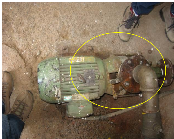
Figura 11 - Booster Floresta.

Não conformidade NC8 – Inciso IV do Artigo 14 da Resolução nº 018, de 30/05/2018, “Deixar de realizar operação e manutenção adequada das unidades integrantes dos sistemas de abastecimento de água e/ou esgotamento sanitário, de acordo com as exigências dos regramentos vigentes”.