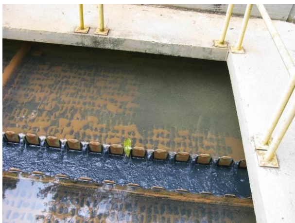
Figura 2 - Decantador 01.

CONSTATAÇÃO C2: Decantador 01 com parte das lamelas quebradas na ETA Ibatiba.