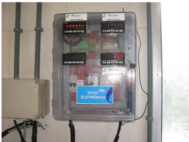
Figura 4 - Leitores de nível dos reservatórios.

CONSTATAÇÃO C4: Leitores de nível dos reservatórios não funcionam no painel do laboratório da ETA de Ibatiba.