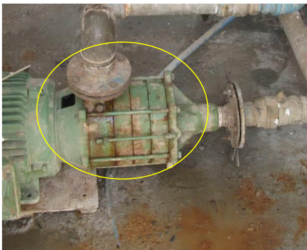
Figura 10 - Booster 3 – Novo Brasil.

CONSTATAÇÃO C8: Vazamentos de água nas bombas dos Booster 3 – Novo Brasil e Booster Floresta.