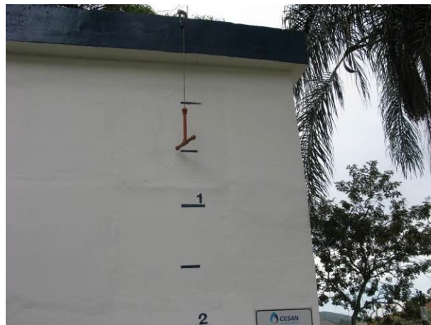
Figura 13 - Reservatório de 200m 3 localizado na ETA de Ibatiba.

Não conformidade NC9 –Inciso III do Artigo 14 da Resolução nº 018, de 30/05/2018, “Deixar de cumprir as normas técnicas, os procedimentos e/ou requisitos estabelecidos em regramento vigente para a implantação de todas as infraestruturas necessárias para a adequada prestação de serviços de abastecimento de água e de esgotamento sanitário”.