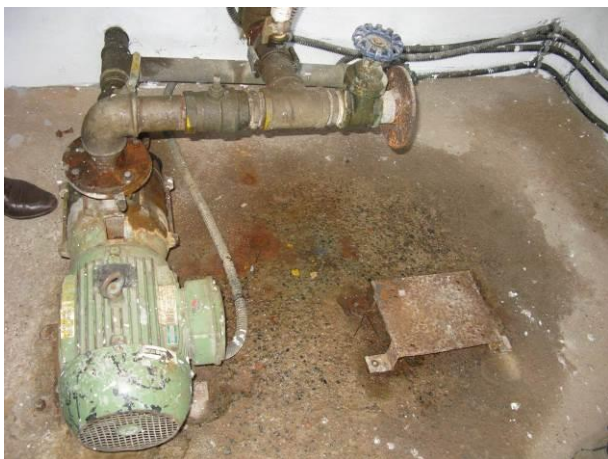
Figura 9 - Booster 2 – Bairro Floresta.

Não conformidade NC7 – Inciso III do Artigo 14 da Resolução nº 018, de 30/05/2018, “Deixar de cumprir as normas técnicas, os procedimentos e/ou requisitos estabelecidos em regramento vigente para a implantação de todas as infraestruturas necessárias para a adequada prestação de serviços de abastecimento de água e de esgotamento sanitário”.