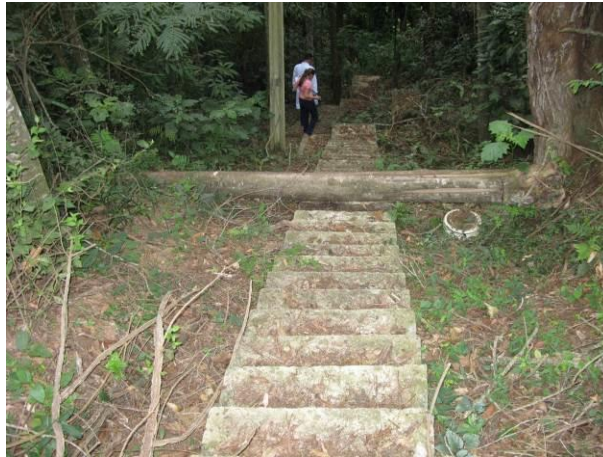
Figura 5 - Escada de acesso ao macromedidor de saída da ETA de Ibatiba.

CONSTATAÇÃO C5: Ausência de guarda corpo na escada de acesso ao macromedidor de saída da ETA de Ibatiba.