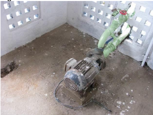
Figura 16 - Booster de Água Tratada Conceição.