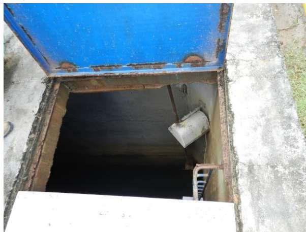
Figura 80 - Captação do Rio Benevente.

Não conformidade NC18 – Artigo 14, inciso IV da Resolução ARSP nº018/2018, “Deixar de realizar operação e manutenção adequada das unidades integrantes dos sistemas de abastecimento de água e/ou esgotamento sanitário, de acordo com as exigências dos regramentos vigentes”.