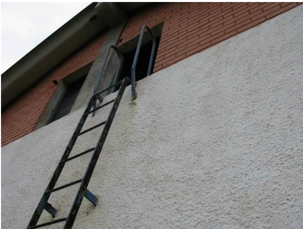
Figura 21 - Portinholas abertas Reservatório Apoiado Centro.

CONSTATAÇÃO C5: Falta integridade no fechamento de acesso aos reservatórios nos seguintes locais: Reservatório Apoiado Centro, Reservatório Semi-Enterrado Ipiranga e Reservatório Semi-enterrado Muquiçaba.