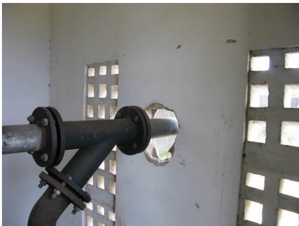
Figura 53 - EEAT Ipiranga.

CONSTATAÇÃO C12: Falta integridade nas paredes das edificações das seguintes unidades do S.A.A. de Guarapari: EEAT Ipiranga e Booster Meaípe.