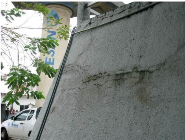
Figura 1 - Reservatório Semi-Enterrado Praia das Virtudes.

CONSTATAÇÃO C1: Há trincas aparentes nas seguintes unidades do S.A.A. de Guarapari: Reservatório Semi-Enterrado Praia das Virtudes, Reservatório Semi-Enterrado Ipiranga e EEAB Jabaquara I.