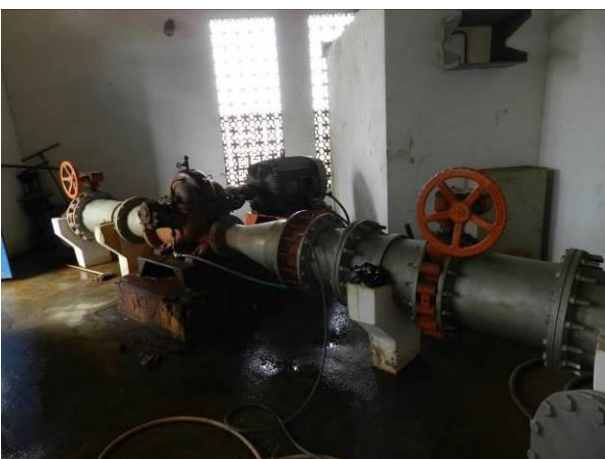
Figura 61 - Booster Água Bruta Conceição.