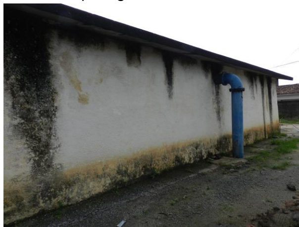
Figura 26 - Reservatório Semi-Enterrado Ipiranga.

Não conformidade NC6 – Artigo 14, incisos IV da Resolução ARSP nº018/2018, “Deixar de realizar operação e manutenção adequada das unidades integrantes dos sistemas de abastecimento de água e/ou esgotamento sanitário, de acordo com as exigências dos regramentos vigentes”.