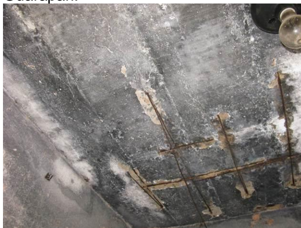
Figura 67 - EEAT Itapebussú.

Não conformidade NC14 – Artigo 14, incisos IV da Resolução ARSP nº018/2018, “Deixar de realizar operação e manutenção adequada das unidades integrantes dos sistemas de abastecimento de água e/ou esgotamento sanitário, de acordo com as exigências dos regramentos vigentes”.