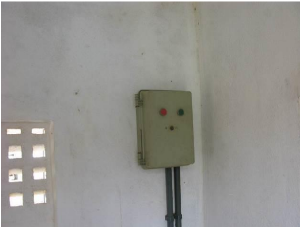
Figura 6 - Booster Concha D'Ostra.