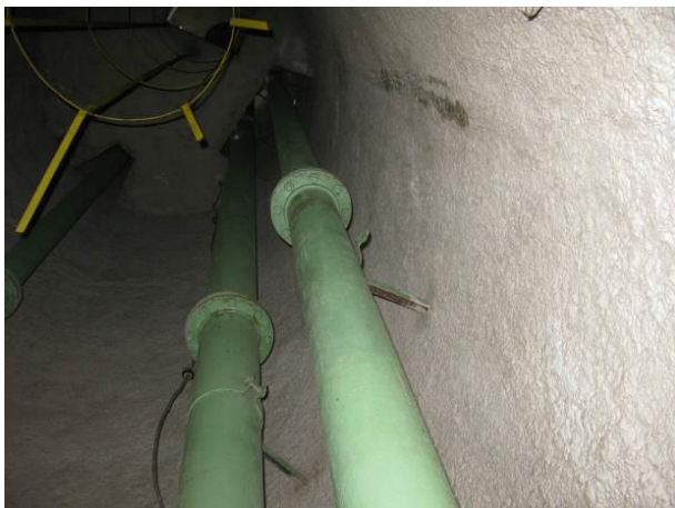
Figura 72 - Reservatório Elevado Ipiranga.