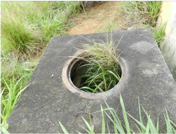
Figura 36 - Reservatório Apoiado Nova Guarapari.