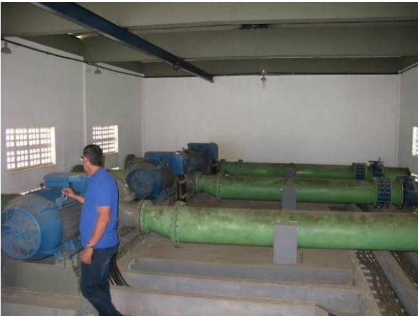
Figura 57 - Booster Rio Grande.