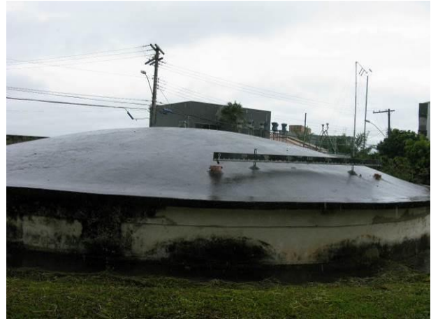
Figura 44 - Reservatório Semi-enterrado Meaípe.