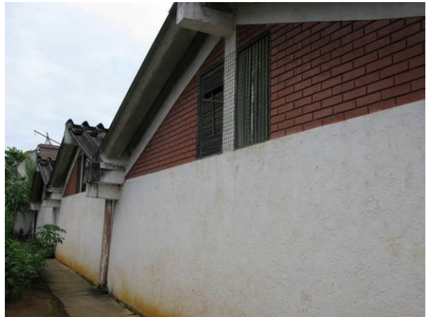
Figura 48 - Reservatório Semi - Enterrado Muquiçaba.