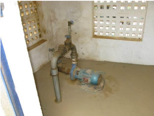
Figura 14 - Booster Concha D'Ostra.