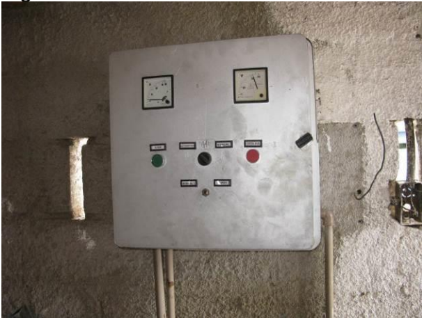
Figura 8 - Booster Muquiçaba.