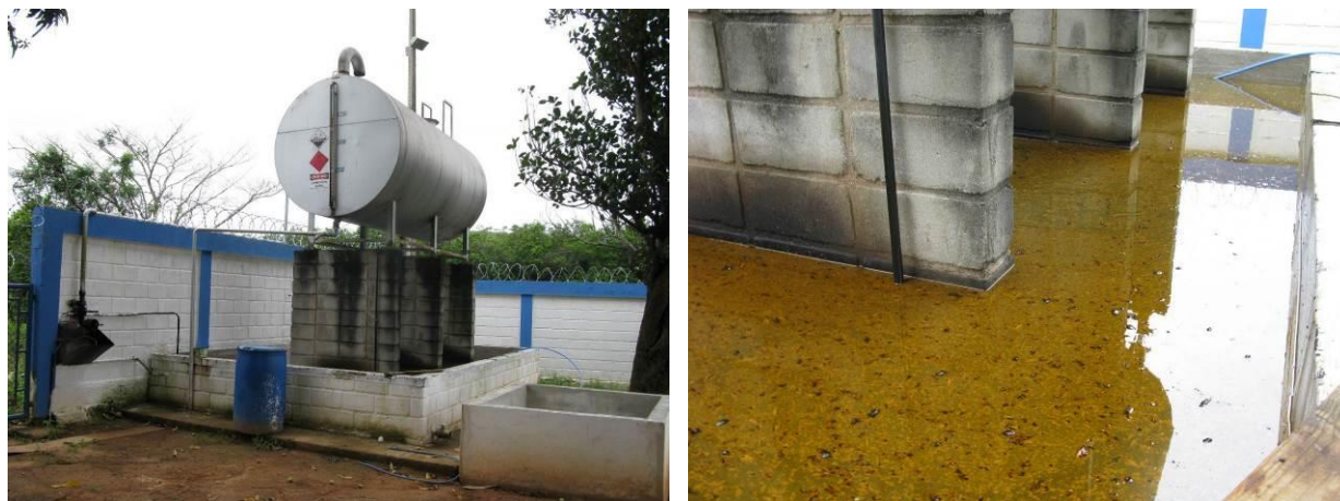
Figura 86 - Caixa retentora de óleo.

CONSTATAÇÃO C23: A caixa retentora de óleo do Tanque de Óleo Diesel do Gerador de emergência da Captação do Rio Jabuti está cheia e pode não ser suficiente em caso de sinistro.