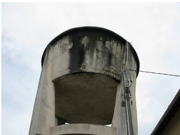
Figura 66 - Reservatório Adventista.