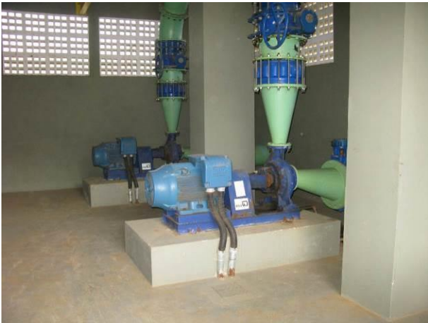
Figura 63 - Booster Perocão.

Não conformidade NC13 – Artigo 14, incisos III da Resolução ARSP nº018/2018, “Deixar de cumprir as normas técnicas, os procedimentos e/ou requisitos estabelecidos em regramento vigente para a implantação de todas as infraestruturas necessárias para a adequada prestação de serviços de abastecimento de água e de esgotamento sanitário”.