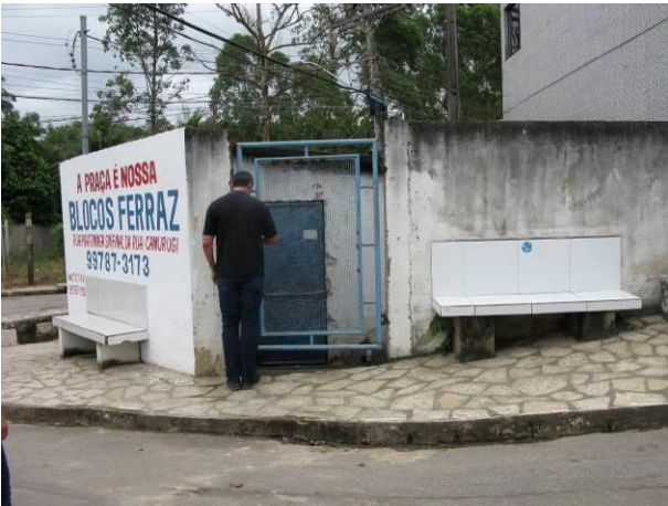
Figura 47 - EEAT Itapebussú.