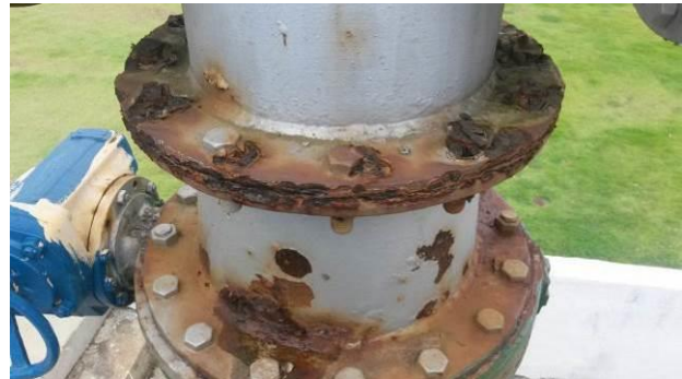
Figura 75 - ETA Guarapari.