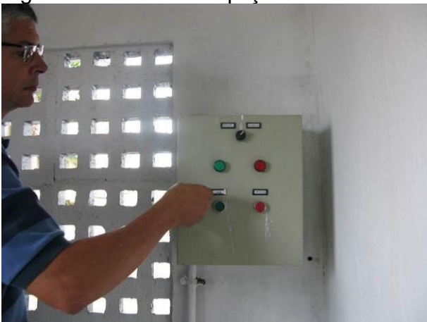
Figura 10 - Booster Água Tratada Conceição.