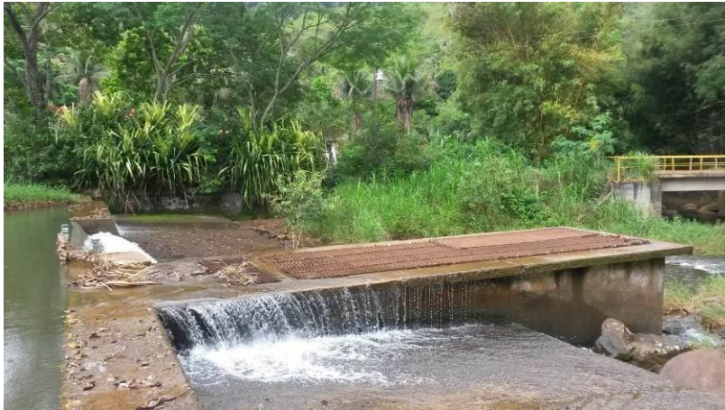
Figura 88 - Captação do Rio Conceição.

Não conformidade NC25 – Artigo 14, inciso III da Resolução ARSP nº018/2018, “Deixar de cumprir as normas técnicas, os procedimentos e/ou requisitos estabelecidos em regramento vigente para a implantação de todas as infraestruturas necessárias para a adequada prestação de serviços de abastecimento de água e de esgotamento sanitário”.