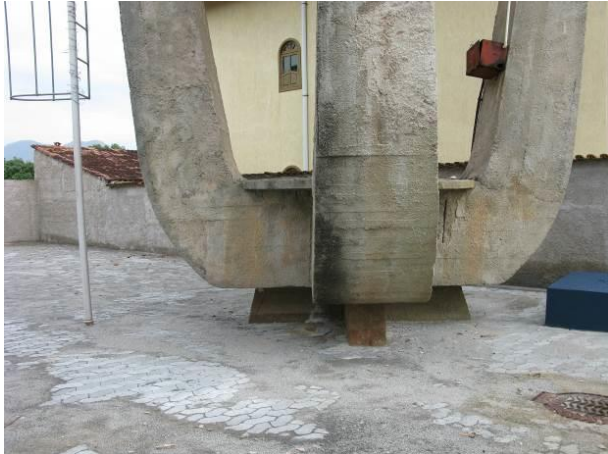
Figura 70 - Reservatório Adventista.

CONSTATAÇÃO C16: Ausência de escadas nos seguintes locais: Reservatório Adventista, Reservatório Semi-Enterrado Ipiranga, Reservatório Elevado Ipiranga, Reservatório Nova Guarapari.