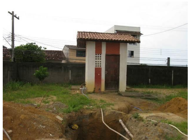
Figura 42 - EEAT Ipiranga.