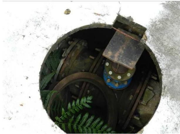
Figura 37 - Reservatório Perocão.

Não conformidade NC9 – Artigo 14, incisos IV da Resolução ARSP nº018/2018, “Deixar de realizar operação e manutenção adequada das unidades integrantes dos sistemas de abastecimento de água e/ou esgotamento sanitário, de acordo com as exigências dos regramentos vigentes”.