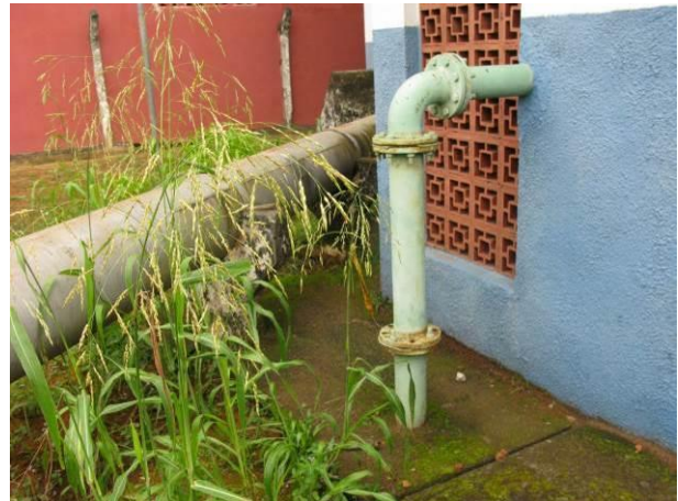
Figura 30 - Booster de Água Bruta Conceição.