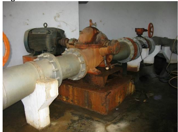
Figura 17 - Booster de Água Bruta Conceição.

Não conformidade NC3 – Artigo 14, incisos III da Resolução ARSP nº018/2018, “Deixar de cumprir as normas técnicas, os procedimentos e/ou requisitos estabelecidos em regramento vigente para a implantação de todas as infraestruturas necessárias para a adequada prestação de serviços de abastecimento de água e de esgotamento sanitário”.