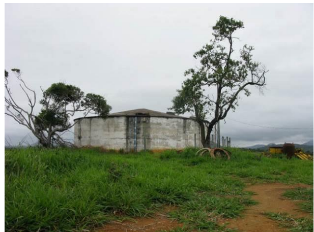
Figura 46 - Reservatório Apoiado Nova Guarapari.