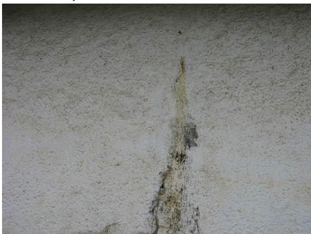
Figura 25 - Reservatório apoiado Centro.

CONSTATAÇÃO C6: Sinais de infiltração nos seguintes reservatórios: – Reservatório apoiado Centro e Reservatório Semi-Enterrado Ipiranga.