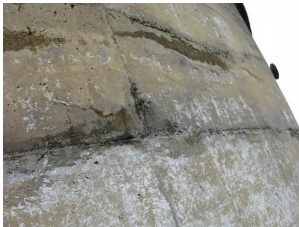
Figura 65 - Reservatório Apoiado Nova Guarapari.