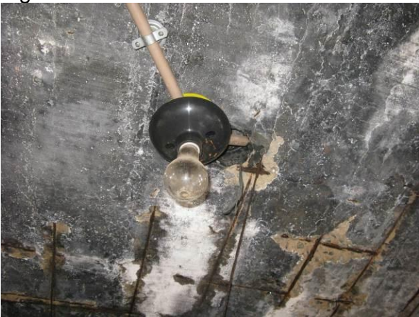
Figura 59 - Booster Itapebussú.