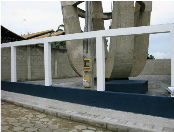
Figura 39 - Reservatório Elevado Adventista.

CONSTATAÇÃO C11: Faltam identificação das seguintes unidades do S.A.A. de Guarapari: Reservatório Elevado Adventista, Reservatório Semi – Enterrado (Praia das Virtudes), EEAT Centro, EEAT Ipiranga, Reservatório Semi - Enterrado Ipiranga, Reservatório Semi-enterrado Meaípe, Booster Meaípe, Reservatório Apoiado Nova Guarapari, EEAT Itapebussú, Reservatório Semi - Enterrado Muquiçaba, Captação no Rio Conceição, Booster Muquiçaba, Booster Adalberto e EEAT Conceição.