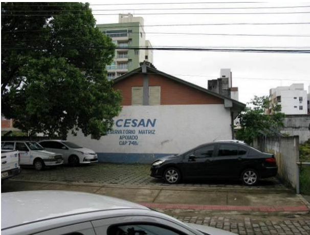
Figura 18 - Reservatório Apoiado Centro.

CONSTATAÇÃO C4: Falta cercamento ou falta integridade no cercamento das seguintes unidades: Reservatório Apoiado Centro, Reservatório Apoiado Nova Guarapari e Reservatório Adventista.