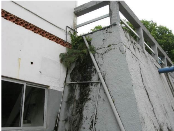
Figura 81 - Reservatório Semi-Enterrado Praia das Virtudes.

CONSTATAÇÃO C19: Vegetação na estrutura da seguinte unidade: Reservatório Semi-Enterrado Praia das Virtudes.