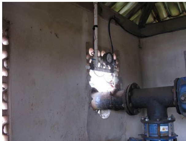
Figura 54 - Booster Meaípe.

Não conformidade NC12 – Artigo 14, incisos IV da Resolução ARSP nº018/2018, “Deixar de realizar operação e manutenção adequada das unidades integrantes dos sistemas de