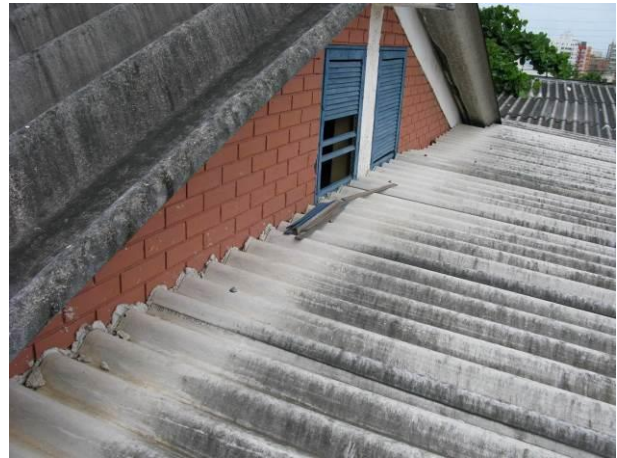
Figura 24 - Reservatório Semi-enterrado Muquiçaba.

Não conformidade NC5 – Artigo 14, incisos III da Resolução ARSP nº018/2018, “Deixar de cumprir as normas técnicas, os procedimentos e/ou requisitos estabelecidos em regramento vigente para a implantação de todas as infraestruturas necessárias para a adequada prestação de serviços de abastecimento de água e de esgotamento sanitário”.