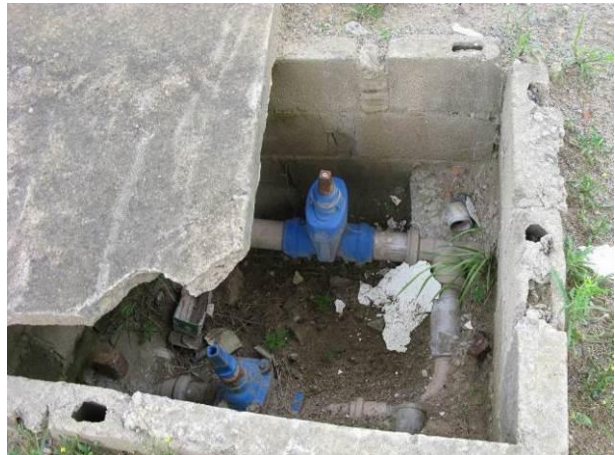
Figura 33 - EEAT Ipiranga.