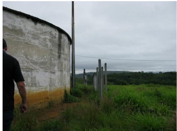
Figura 19 - Reservatório Apoiado Nova Guarapari.