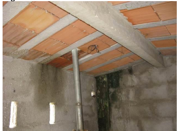
Figura 60 - Booster Muquiçaba.