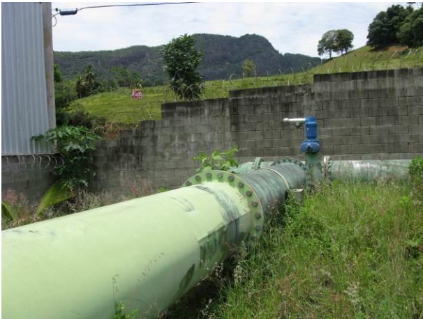
Figura 31 - Booster Rio Grande.

Não conformidade NC8 – Artigo 14, incisos IV da Resolução ARSP nº018/2018, “Deixar de realizar operação e manutenção adequada das unidades integrantes dos sistemas de abastecimento de água e/ou esgotamento sanitário, de acordo com as exigências dos regramentos vigentes”.