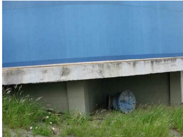
Figura 83 - RAT Perocão.

Não conformidade NC20 – Artigo 13, inciso XI da Resolução ARSP nº018/2018, “Deixar de zelar pela integridade dos bens vinculados à prestação dos serviços”.