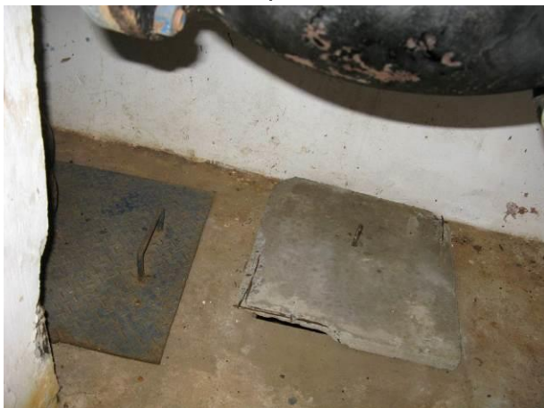
Figura 64 - Booster Nova Guarapari.

CONSTATAÇÃO C14: Há armaduras expostas nas seguintes unidades do S.A.A. de Guarapari: Booster Nova Guarapari, Reservatório Apoiado Nova Guarapari, Reservatório Adventista e EEAT Itapebussú.