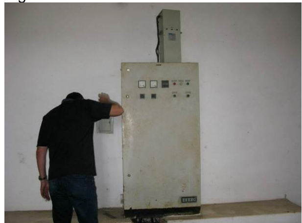
Figura 11 - Booster de Água Bruta Conceição.