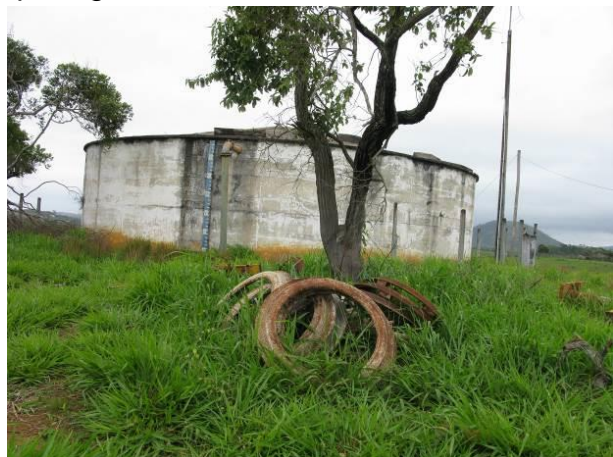
Figura 73 - Reservatório Nova Guarapari.

Não conformidade NC16 – Artigo 14, inciso III, “Deixar de cumprir as normas técnicas, os procedimentos e/ou requisitos estabelecidos em regramento vigente para a implantação de todas as infraestruturas necessárias para a adequada prestação de serviços de abastecimento de água e de esgotamento sanitário”.