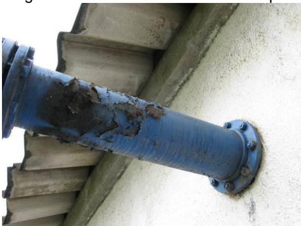
Figura 76 - Reservatório Apoiado Centro.