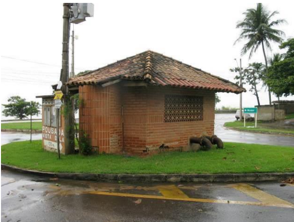
Figura 45 - Booster Meaípe.