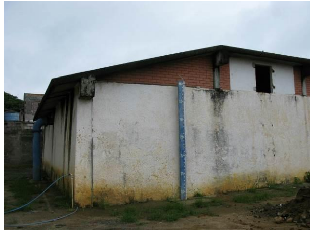
Figura 71 - Reservatório Semi-Enterrado Ipiranga.