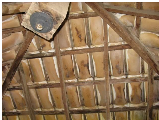
Figura 56 - Booster Meaípe.