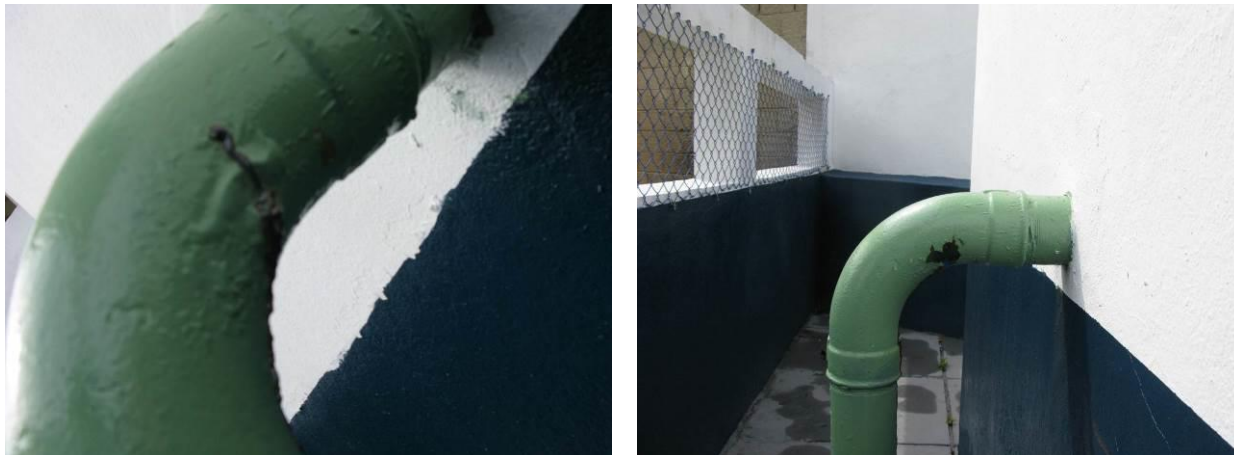
Figura 87 - EEAT Adventista .

Não conformidade NC24 – Artigo 14, inciso IV, “Deixar de realizar operação e manutenção adequada das unidades integrantes dos sistemas de abastecimento de água e/ou esgotamento sanitário, de acordo com as exigências dos regramentos vigentes”.