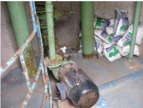
Figura 12 - Booster Centro de Guarapari.

CONSTATAÇÃO C3: Não há bomba reserva instalada nas seguintes unidades: Booster Centro de Guarapari, Booster Itapebussú, Booster Concha D’Ostra, Booster Adalberto, Booster de Água Tratada Conceição e Booster de Água Bruta Conceição.