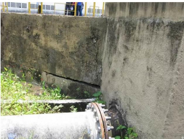
Figura 3 - EEAB Jabaquara I.

Não conformidade NC1 – Artigo 14, inciso IV da Resolução ARSP nº018/2018, “Deixar de realizar operação e manutenção adequada das unidades integrantes dos sistemas de