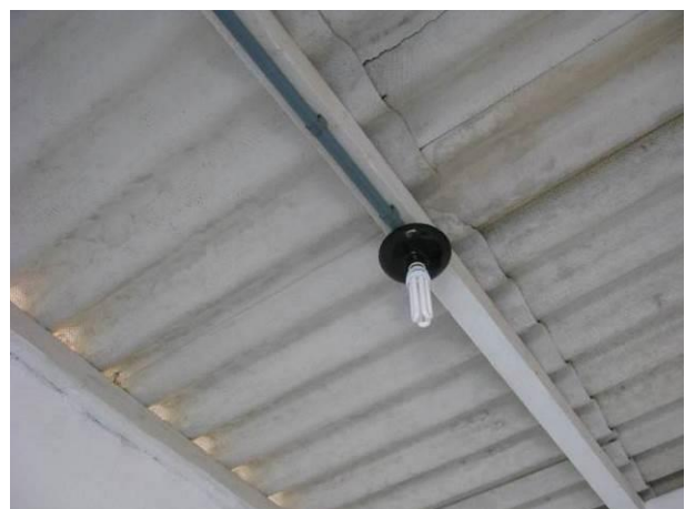
Figura 62 - EEAT Adventista.