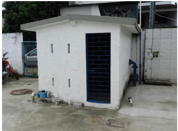
Figura 50 - Booster Muquiçaba.