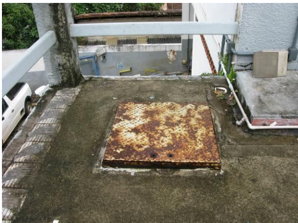
Figura 79 - Reservatório Semi – Enterrado (Praia das Virtudes).