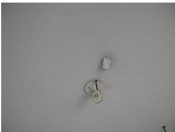
Figura 55 - EEAT Ipiranga.

CONSTATAÇÃO C13: Falta iluminação nas seguintes unidades do S.A.A. de Guarapari: EEAT Ipiranga, Booster Meaípe, Booster Rio Grande, Booster Concha D'Ostra, Booster Itapebussú, Booster Muquiçaba, Booster Água Bruta Conceição, EEAT Adventista e Booster Perocão.