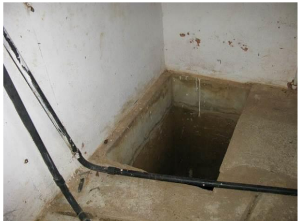
Figura 35 - Booster Nova Guarapari.