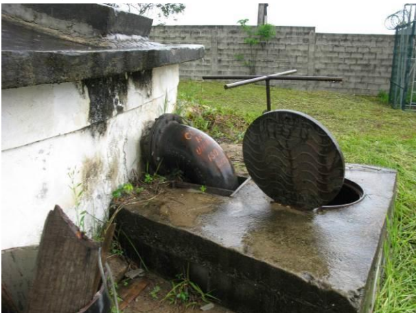
Figura 34 - Reservatório Semi-enterrado Meaípe.