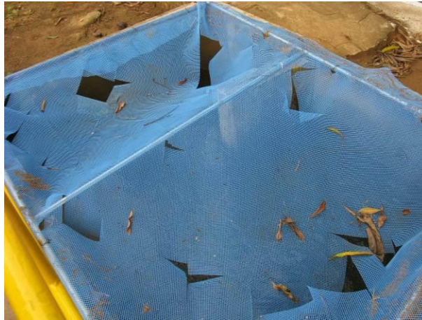
Figura 85 - Captação do Rio Jabuti .

CONSTATAÇÃO C22: As telas de proteção da Caixa Desarenadora da Captação do Rio Jabuti necessitam manutenção.