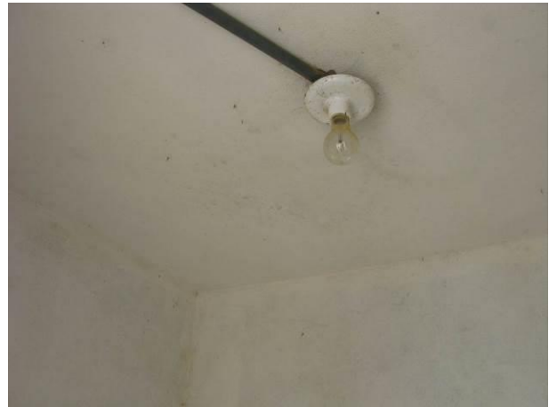
Figura 58 - Booster Concha D'Ostra.