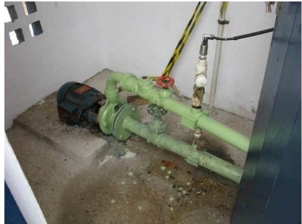
Figura 15 - Booster Adalberto.