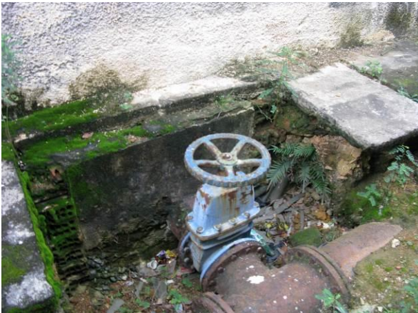
Figura 32 - Reservatório Semi-Enterrado Ipiranga.

CONSTATAÇÃO C9: Faltam tampas e / ou tampas mantidas abertas em caixas de inspeção: Reservatório Semi-Enterrado Ipiranga, EEAT Ipiranga, Reservatório Semi-enterrado Meaípe, Booster Nova Guarapari, Reservatório Apoiado Nova Guarapari e Reservatório Perocão.