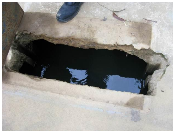
Figura 84 - Captação do Rio Jabuti.

Não conformidade NC21 – Artigo 14, inciso III da Resolução ARSP nº018/2018, “Deixar de cumprir as normas técnicas, os procedimentos e/ou requisitos estabelecidos em regramento vigente para a implantação de todas as infraestruturas necessárias para a adequada prestação de serviços de abastecimento de água e de esgotamento sanitário”.