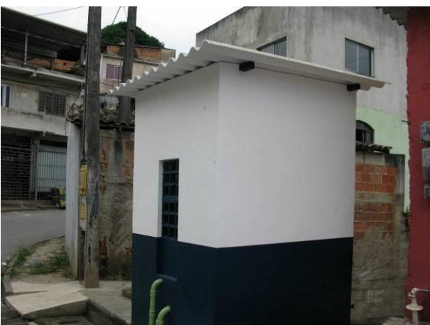
Figura 51 - Booster Adalberto.