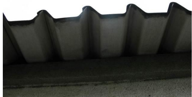
Figura 22 - Ausência de tela de vedação na lateral entre telhas e terças no Reservatório apoiado Centro.