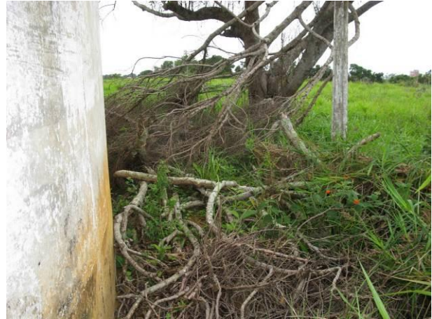
Figura 28 - Reservatório Apoiado Nova Guarapari.