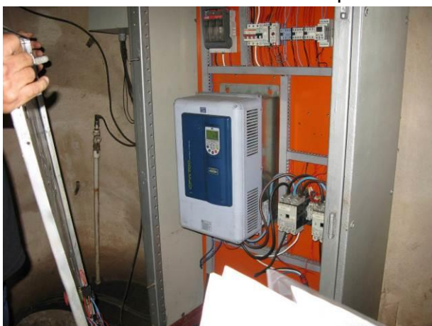
Figura 68 - Booster Meaípe.

CONSTATAÇÃO C15: Quadro Elétrico necessitando de manutenção nas seguintes unidades: Booster Meaípe e Booster Rio Grande.