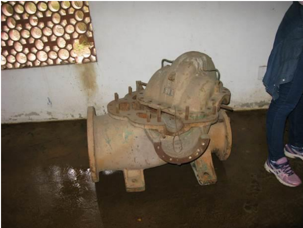
Figura 82 - Booster de Água Bruta Conceição.

CONSTATAÇÃO C20: Restos de obras / peças abandonados nas seguintes unidades: Booster de Água Bruta Conceição e RAT Perocão.