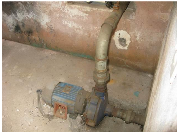
Figura 13 - Booster Itapebussú.