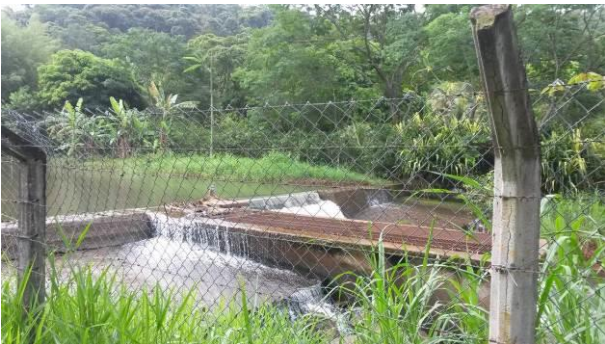
Figura 49 - Captação no Rio Conceição.