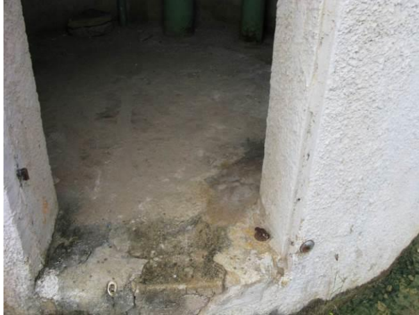
Figura 38 - Reservatório Elevado Ipiranga.

CONSTATAÇÃO C10: Falta portão de isolamento no Reservatório Elevado Ipiranga.