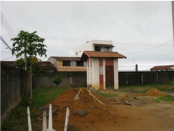
Figura 29 - Booster Ipiranga.