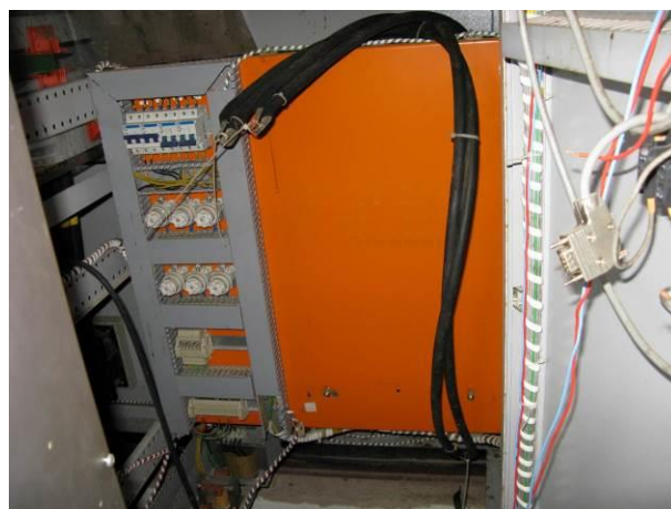
Figura 69 - Booster Rio Grande.

Não conformidade NC15 – Artigo 14, incisos IV da Resolução ARSP nº018/2018, respectivamente “Deixar de realizar operação e manutenção adequada das unidades integrantes dos sistemas de abastecimento de água e/ou esgotamento sanitário, de acordo com as exigências dos regramentos vigentes”.