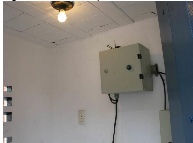
Figura 9 - Booster Adalberto.