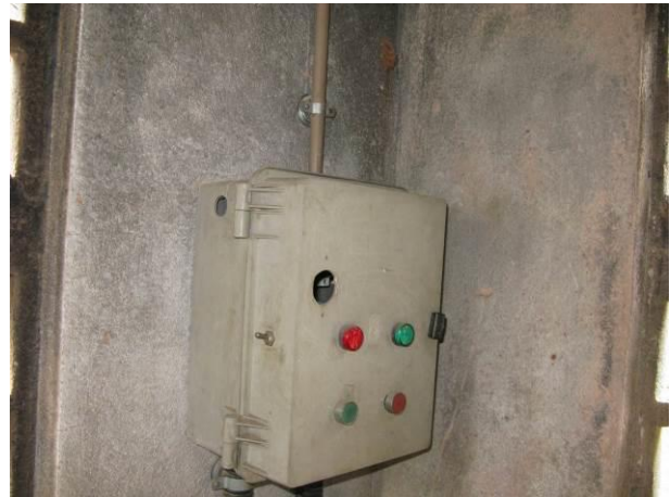
Figura 7 - Booster Itapebussú.