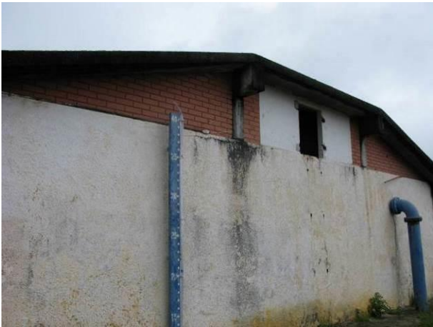
Figura 23 - Reservatório Semi-Enterrado Ipiranga.