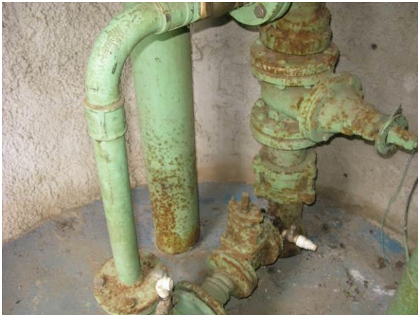
Figura 74 - Booster Centro de Guarapari.

CONSTATAÇÃO C17: Tubulações com sinais de corrosão nas seguintes unidades: Booster Centro de Guarapari, ETA Guarapari, Reservatório Apoiado Centro, Reservatório Semi-Enterrado Ipiranga e Elevado Muquiçaba.