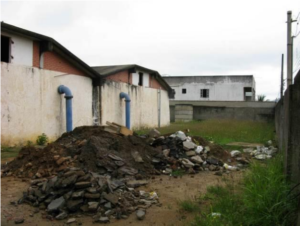
Figura 27 - Reservatório Semi-Enterrado Ipiranga.