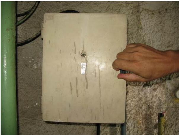
Figura 4 - Quadro elétrico do Booster Centro de Guarapari.

CONSTATAÇÃO C2: Faltam sinalizações de risco de choque elétrico nas seguintes unidades: Quadro elétrico do Booster Centro de Guarapari, Quadro elétrico do Booster Ipiranga, Booster Concha D’Ostra, Booster Itapebussú, Booster Muquiçaba, Booster Adalberto, Booster Água Tratada Conceição e Booster de Água Bruta Conceição.