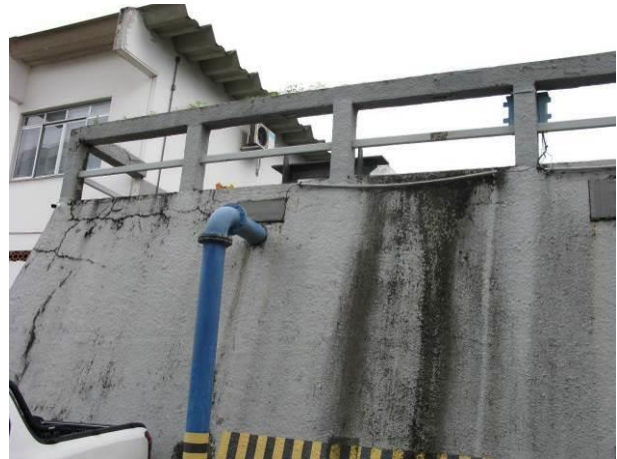
Figura 40 - Reservatório Semi – Enterrado (Praia das Virtudes).