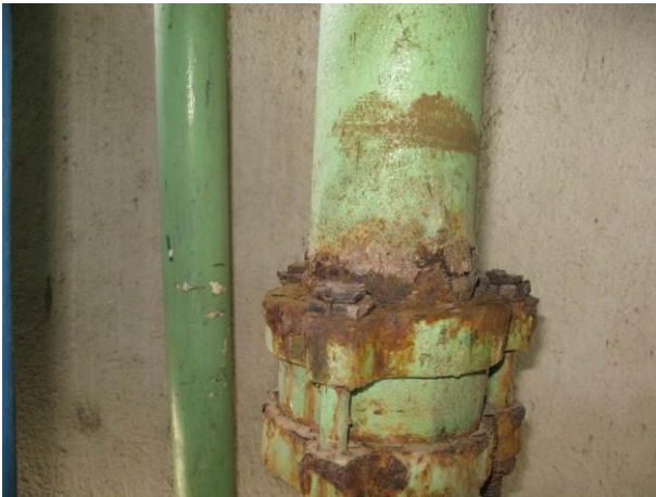
Figura 78 - Reservatório Elevado Muquiçaba.

Não conformidade NC17 – Artigo 14, inciso IV da Resolução ARSP nº018/2018, “Deixar de realizar operação e manutenção adequada das unidades integrantes dos sistemas de abastecimento de água e/ou esgotamento sanitário, de acordo com as exigências dos regramentos vigentes”.