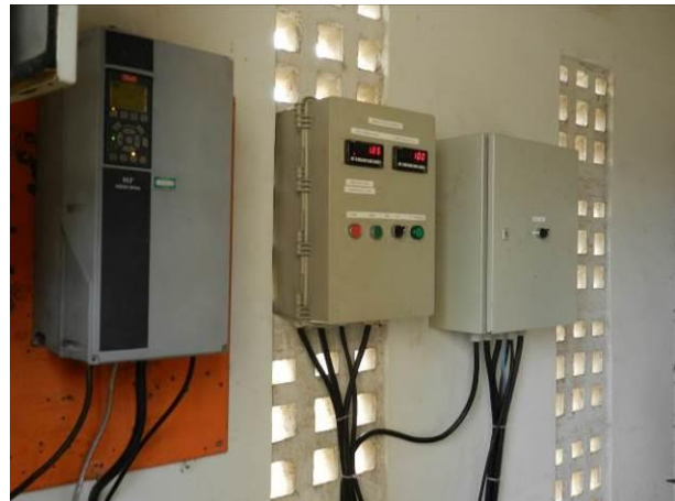
Figura 5 - Quadro elétrico do Booster Ipiranga.