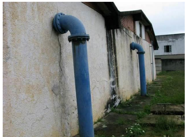
Figura 77 - Reservatório Semi-Enterrado Ipiranga.