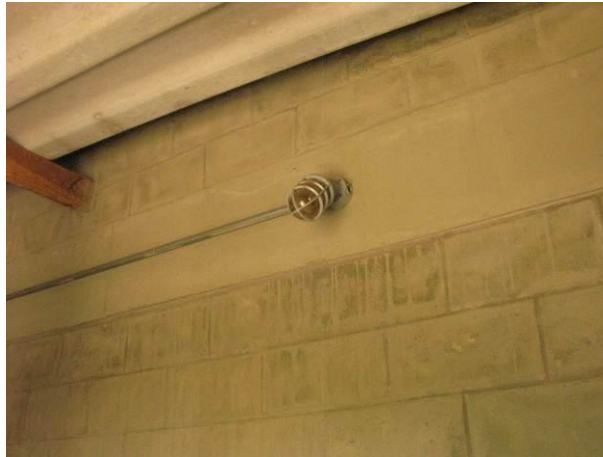
Figura 33 - EEAT Mirante da Praia II

CONSTATAÇÃO C20: Ausência de iluminação adequada na EEAT Mirante da Praia II.