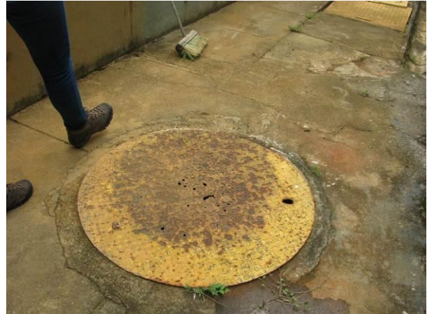
Figura 20 - Tampa no piso próxima ao Floculador da ETA Timbuí.

Não conformidade NC6 – Art 14º, inciso IV da Resolução ARSP nº 018/2018. Deixar de realizar operação e manutenção adequada das unidades integrantes dos sistemas de abastecimento de água e/ou esgotamento sanitário, de acordo com as exigências dos regramentos vigentes.