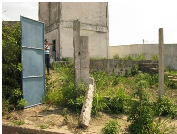
Figura 17 - Reservatório Mirante da Praia.