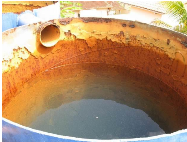
Figura 31 - Filtros da ETA Fundão.

Não conformidade NC18 – Art 14º, inciso IV da Resolução ARSP nº 018/2018. Deixar de realizar operação e manutenção adequada das unidades integrantes dos sistemas de abastecimento de água e/ou esgotamento sanitário, de acordo com as exigências dos regramentos vigentes.