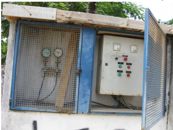
Figura 3 - EEAT Mirante da Praia I.

CONSTATAÇÃO C2: Falta sinalização contra choque nas seguintes unidades: EEAT Mirante da Praia I, EEAT Direção e EEAT Mirante da Praia II.