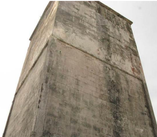
Figura 35 - Reservatório Mirante da Praia

Não conformidade NC22 – Art 14º, inciso IV da Resolução ARSP nº 018/2018. Deixar de realizar operação e manutenção adequada das unidades integrantes dos sistemas de abastecimento de água e/ou esgotamento sanitário, de acordo com as exigências dos regramentos vigentes.