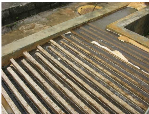
Figura 22 - Flocculador da ETA Timbuí.

CONSTATAÇÃO C8: Chicanas submersas próximo à entrada do Flocculador da ETA Timbuí.