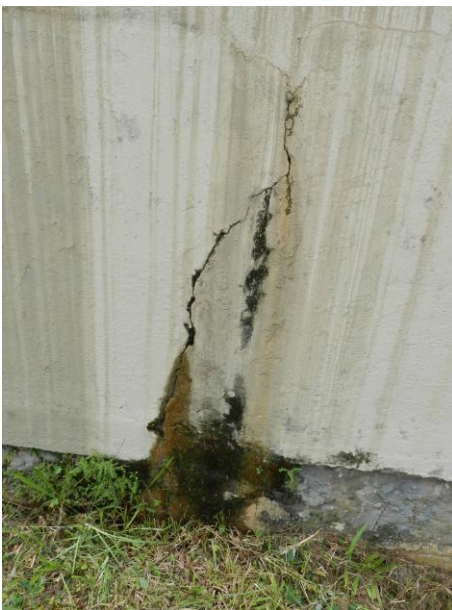
Figura 12 - Reservatório R2 – 350m 3 .

Não conformidade NC3 – Art 14º, inciso IV da Resolução ARSP nº 018/2018. Deixar de realizar operação e manutenção adequada das unidades integrantes dos sistemas de abastecimento de água e/ou esgotamento sanitário, de acordo com as exigências dos regramentos vigentes.