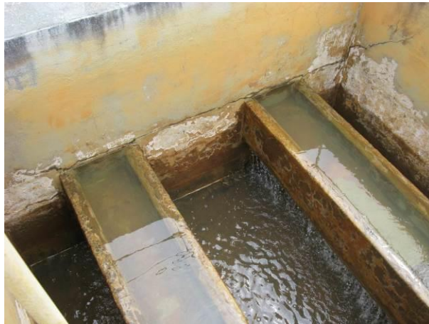
Figura 26 - Filtros da ETA Timbuí.

Não conformidade NC12 – Art 14º, inciso IV da Resolução ARSP nº 018/2018. Deixar de realizar operação e manutenção adequada das unidades integrantes dos sistemas de abastecimento de água e/ou esgotamento sanitário, de acordo com as exigências dos regramentos vigentes.