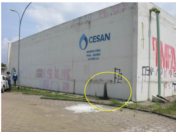
Figura 6 - Reservatório Praia Grande.

CONSTATAÇÃO C3: Sinais de infiltração nas paredes externas das seguintes unidades do município de Fundão: Reservatório Praia Grande, Reservatório R1 – 150.000L, na estrutura física da ETA Fundão, Flocculador da ETA Timbuí, Decantador da ETA Timbuí e Reservatório R2 350m 3 .