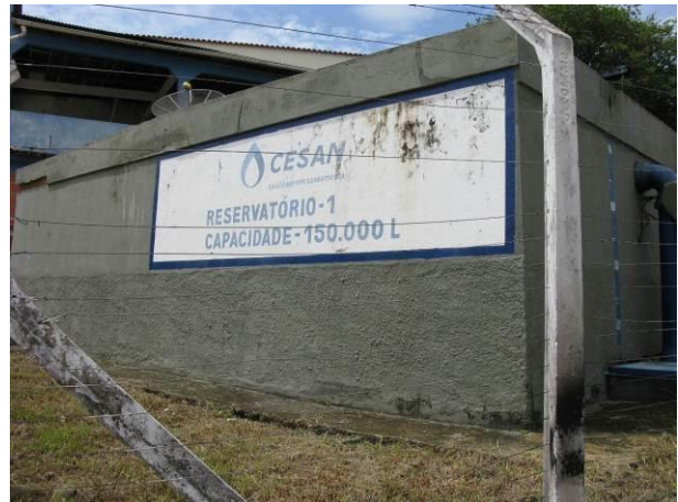
Figura 14 - Reservatório R1 – 150.000L.