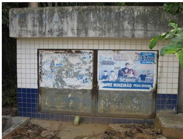
Figura 38 - EEAT Direção.

Não conformidade NC25 – Art 11º, inciso V da Resolução ARSP nº 018/2018. “Deixar de identificar as unidades operacionais e instalações pertencentes ao sistema de abastecimento de água e esgotamento sanitário, inclusive quanto ao horário de funcionamento dos postos de atendimento ao usuário”.