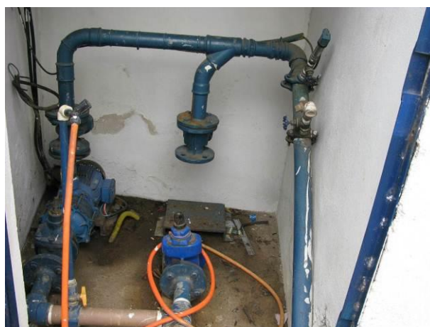
Figura 2 - EEAT Angelo Palauro.

Não conformidade NC1 – Art 14º, inciso III da Resolução ARSP nº 018/2018. Deixar de cumprir as normas técnicas, os procedimentos e/ou requisitos estabelecidos em regramento vigente para a implantação de todas as infraestruturas necessárias para a adequada prestação de serviços de abastecimento de água e de esgotamento sanitário.