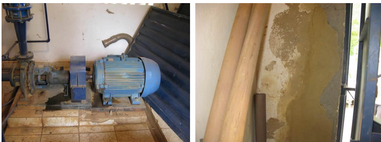
Figura 21- Muitos materiais e restos de obra a serem recolhidos na EEAB do Ribeirão Braço do Norte.

CONSTATAÇÃO C7: Necessidade de destinação adequada dos materiais e restos de obra localizados na EEAB do Ribeirão Braço do Norte, que dificultam a movimentação interna no local e consequentemente a manutenção.