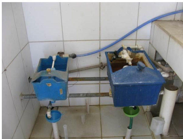
Figura 32 - Dosadoras na ETA Fundão.

Não conformidade NC19 – Artigo 11, inciso V, da Resolução ARSP 018 de 30/05/2018. “Deixar de identificar as unidades operacionais e instalações pertencentes ao sistema de abastecimento de água e esgotamento sanitário, inclusive quanto ao horário de funcionamento dos postos de atendimento ao usuário”.