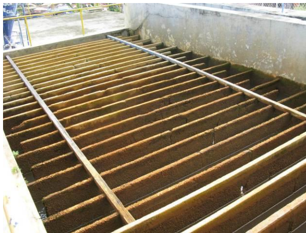
Figura 29 - Flocculador da ETA Fundão.

CONSTATAÇÃO C16: Chicanas trincadas e corroídas no Flocculador da ETA Fundão.