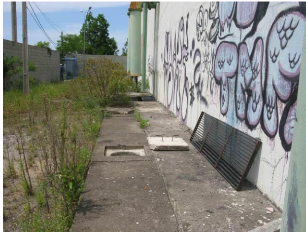
Figura 37 - Reservatório Praia Grande

Não conformidade NC24 – Art 14º, inciso IV da Resolução ARSP nº 018/2018. Deixar de realizar operação e manutenção adequada das unidades integrantes dos sistemas de abastecimento de água e/ou esgotamento sanitário, de acordo com as exigências dos regramentos vigentes.