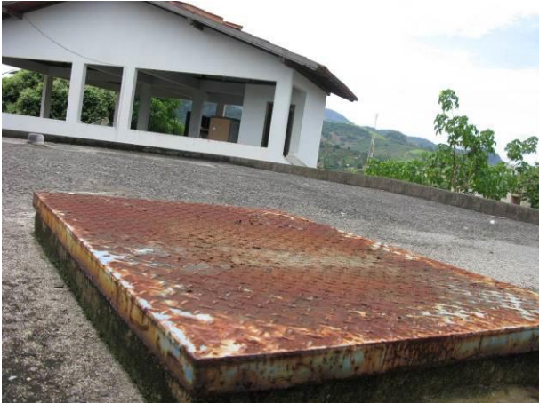
Figura 19 - Reservatório R2 – 350.000L.

CONSTATAÇÃO C6: Tampas enferrujadas nas seguintes unidades do município de Fundão: Reservatório R2 (350.000L) e no piso próxima ao Floculador da ETA Timbuí.