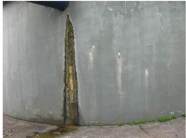
Figura 11 - Decantador da ETA Timbuí.