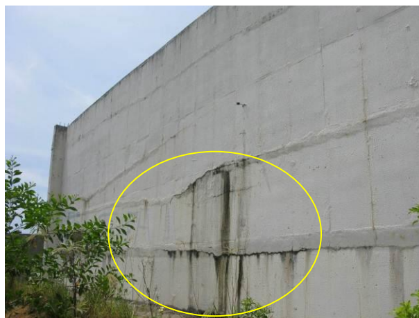
Figura 7 - Reservatório Praia Grande.