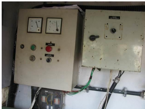
Figura 4 - EEAT Direção.