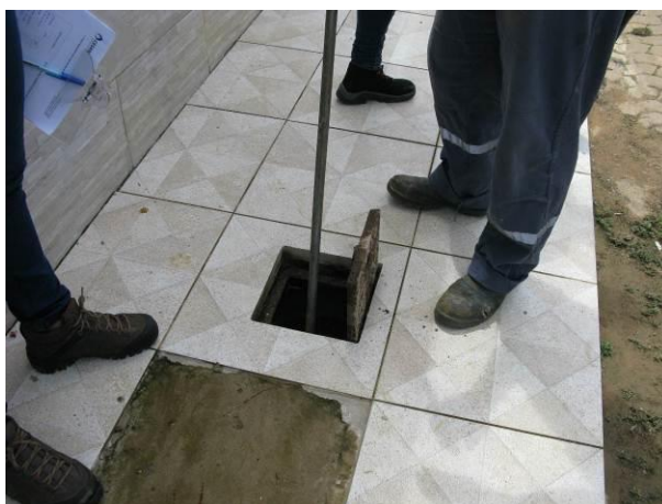
Figura 27 - Descarga localizada na Rua Santa Tereza.

CONSTATAÇÃO C14: Descarga localizada na Rua Santa Tereza com tampa identificada para esgoto.