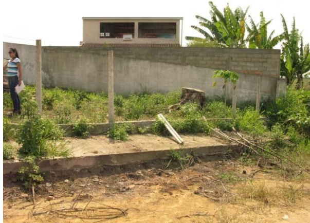
Figura 34 - Reservatório Mirante da Praia

Não conformidade NC21 – Inciso VII do Artigo 11º da Resolução nº 018, de 30/05/2018, “Deixar de prover as áreas de risco com estruturas e equipamentos de segurança que possam evitar a ocorrência de acidentes e o acesso de terceiros a área física das unidades operacionais”.