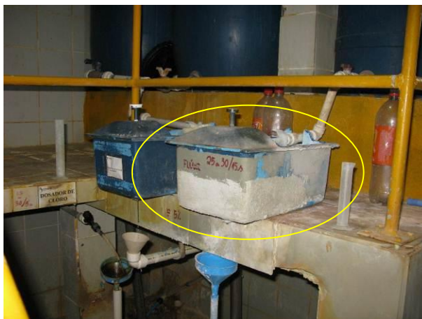
Figura 25 - Caixa dosadora.

Não conformidade NC11 – Art 14º, inciso IV da Resolução ARSP nº 018/2018. Deixar de realizar operação e manutenção adequada das unidades integrantes dos sistemas de abastecimento de água e/ou esgotamento sanitário, de acordo com as exigências dos regramentos vigentes.