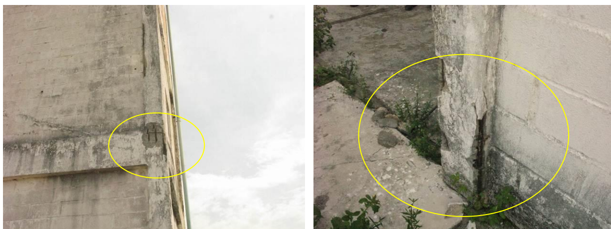
Figura 36 - Reservatório Mirante da Praia

Não conformidade NC23 – Art 14º, inciso IV da Resolução ARSP nº 018/2018. Deixar de realizar operação e manutenção adequada das unidades integrantes dos sistemas de abastecimento de água e/ou esgotamento sanitário, de acordo com as exigências dos regramentos vigentes.