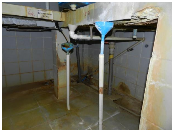
Figura 24 - Casa de Química.

Não conformidade NC10 – Art 14º, inciso IV da Resolução ARSP nº 018/2018. Deixar de realizar operação e manutenção adequada das unidades integrantes dos sistemas de abastecimento de água e/ou esgotamento sanitário, de acordo com as exigências dos regramentos vigentes.