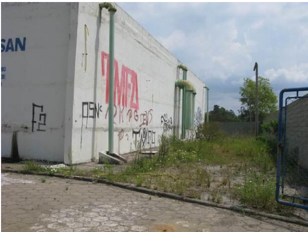
Figura 13 - Reservatório Praia Grande.

CONSTATAÇÃO C4: Ausência de escada de acesso à parte superior dos seguintes reservatórios: Praia Grande, Reservatório R1 – 150.000L e Reservatório R2 – 350.000L