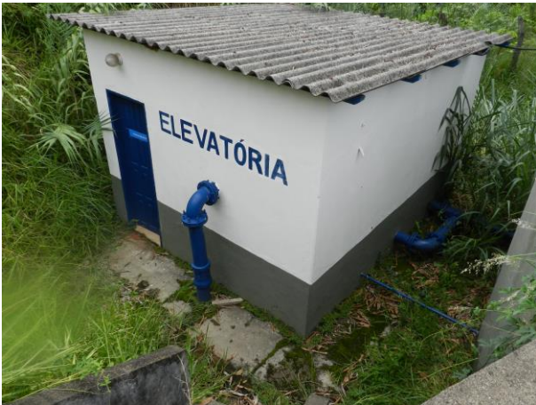
Figura 18 - Em torno da EEAT (ETA Timbuí).

Não conformidade NC5 – Art 14º, inciso IV da Resolução ARSP nº 018/2018. Deixar de realizar operação e manutenção adequada das unidades integrantes dos sistemas de abastecimento de água e/ou esgotamento sanitário, de acordo com as exigências dos regramentos vigentes.