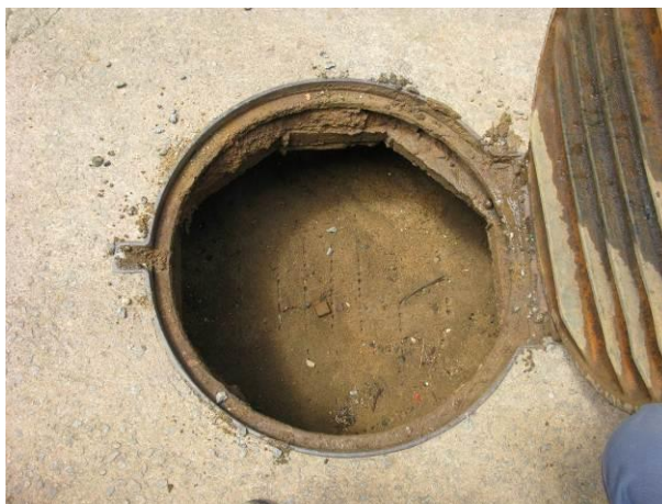
Figura 28 - Descarga localizada na Rua Jeronimo Sírtole.

CONSTATAÇÃO C15: Descarga localizada na Rua Jeronimo Sírtole com excesso de resíduos.