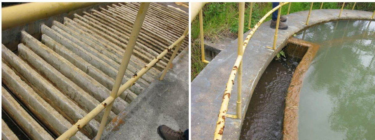
Figura 23 – Guarda corpo apresenta corrosão.

CONSTATAÇÃO C9: Guarda corpo de proteção no Floculador e no Decantador apresenta corrosão na ETA Timbuí.