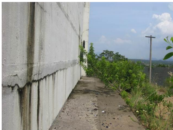
Figura 16 - Reservatório Praia Grande.

CONSTATAÇÃO C5: Excesso de vegetação nas seguintes unidades do município de Fundão: Reservatório Praia Grande, Reservatório Mirante da Praia, parte do terreno da ETA Timbuí.