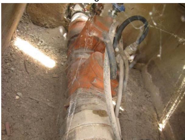
Figura 1 - EEAT Mirante da Praia I.

CONSTATAÇÃO C1 Falta bomba reserva nas seguintes unidades: EEAT Mirante da Praia I e EEAT Angelo Palauro.