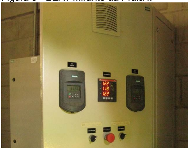
Figura 5 - EEAT Mirante da Praia II.

Não conformidade NC2 – Art 11º, inciso VI da Resolução ARSP nº 018/2018. “Deixar de prover as áreas de risco das instalações com sinalização de risco e/ou avisos de advertência de forma adequada à visualização de terceiros”.