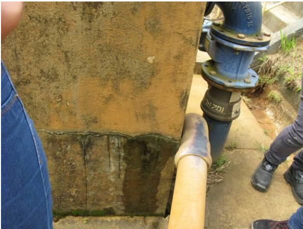
Figura 10 - Floculador da ETA Timbuí.