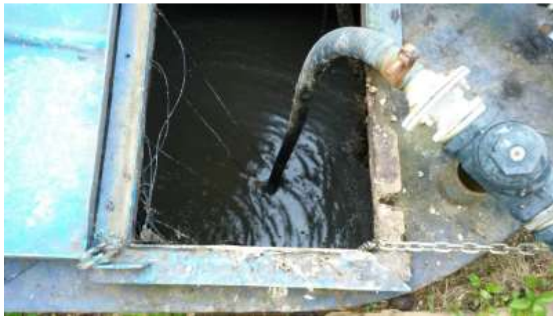
Figura 6 - EEEB da ETE Santa Isabel

CONSTATAÇÃO C6: Ausência de mecanismo de remoção de sólidos grosseiros na EEEB da ETE Santa Isabel.