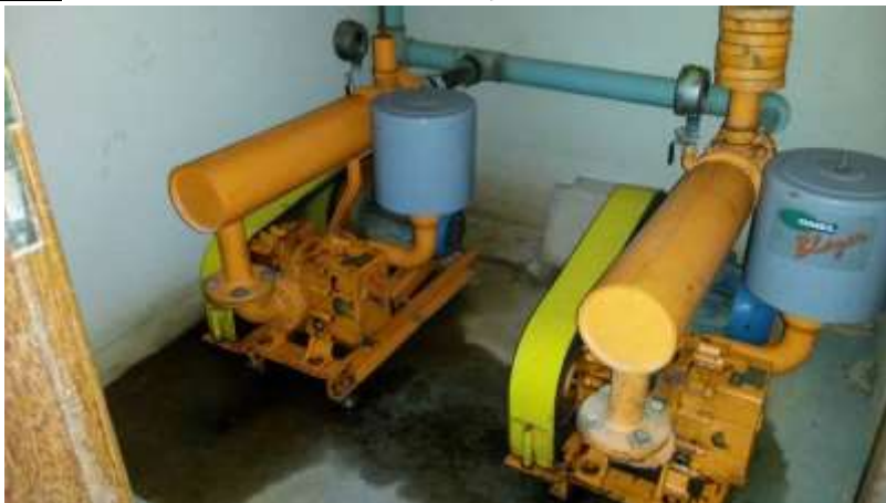
Figura 4 - ETE Vivendas de Pedra Azul.

Não conformidade NC4 - Artigo 14, inciso IV da Resolução ARSP nº 018/2018. Deixar de realizar operação e manutenção adequada das unidades integrantes dos sistemas de abastecimento de água e/ou esgotamento sanitário, de acordo com as exigências dos regramentos vigentes”.