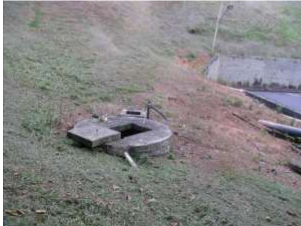
Figura 2 - ETE Domingos Martins.

CONSTATAÇÃO C2: Estação Elevatória de recirculação da ETE Domingos Martins não é operada.