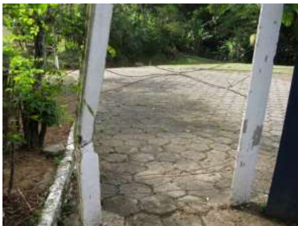
Figura 1 - ETE Domingos Martins.

CONSTATAÇÃO C1: Isolamento comprometido na ETE Domingos Martins, cerca danificada.