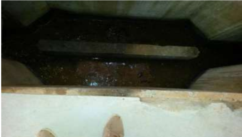
Figura 3 - ETE Vivendas de Pedra Azul.

CONSTATAÇÃO C3: Caixa de areia com excesso de material na ETE Vivendas de Pedra Azul.