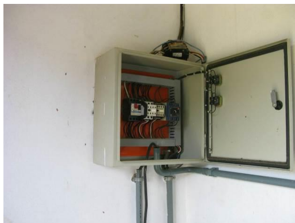
Figura 4 - EEAT localizada no interior da ETA de Brejetuba.