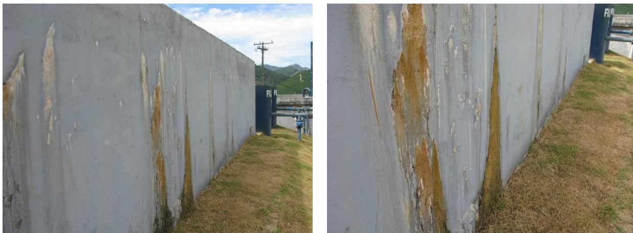
Figura 7 - Decantador da ETA Brejetuba.

Não conformidade NC5 – Artigo 14, inciso IV, da Resolução ARSP 018 de. 30/05/2018. Deixar de realizar operação e manutenção adequada das unidades integrantes dos sistemas de abastecimento de água e/ou esgotamento sanitário, de acordo com as exigências dos regramentos vigentes.