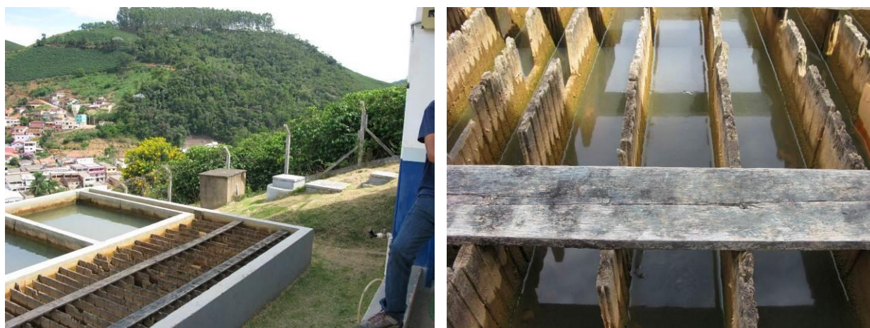
Figura 6 - Chicanas danificadas no Flocculador.

CONSTATAÇÃO C4: Chicanas danificadas no flocculador da ETA de Brejetuba.