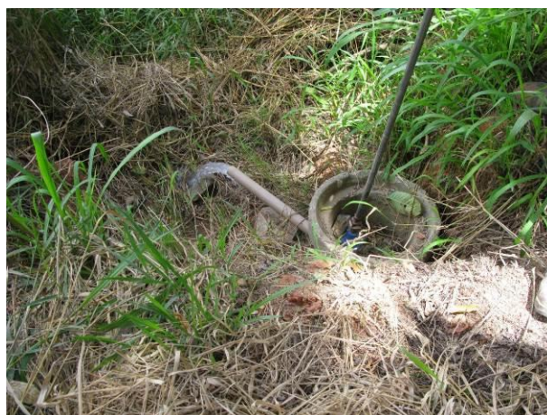
Figura 11 -Descarga 2.

Não conformidade NC10 – Artigo 14, inciso IV, da Resolução ARSP 018 de 30/05/2018. Deixar de realizar operação e manutenção adequada das unidades integrantes dos sistemas de abastecimento de água e/ou esgotamento sanitário, de acordo com as exigências dos regramentos vigentes.