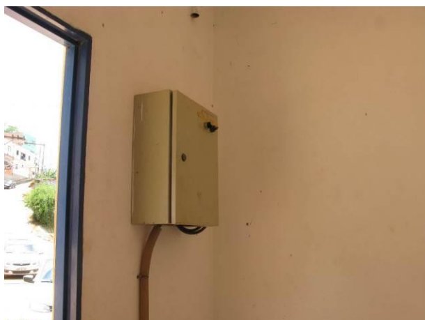
Figura 5 - EEAT Bairro Nobre.

Não conformidade NC3 – Inciso VI do Artigo 11º da Resolução nº 018, de 30/05/2018, “Deixar de prover as áreas de risco das instalações com sinalização de risco e/ou avisos de advertência de forma adequada à visualização de terceiros”.