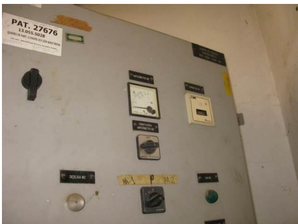
Figura 3 - EEAB de Brejetuba.

CONSTATAÇÃO C3: Ausência de sinalização de risco de choque no painel de comando da EEAB de Brejetuba, EEAT localizada no interior da ETA de Brejetuba e EEAT Bairro Nobre.