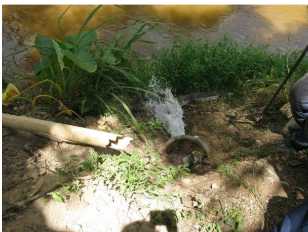
Figura 10 - Descarga 1.

CONSTATAÇÃO C10: Ausência de tampas nas caixas de descargas 1 (Av. Beira Rio, defronte ao número 25) e 2 (Beira Rio, final de bairro) do S.A.A. de Brejetuba.