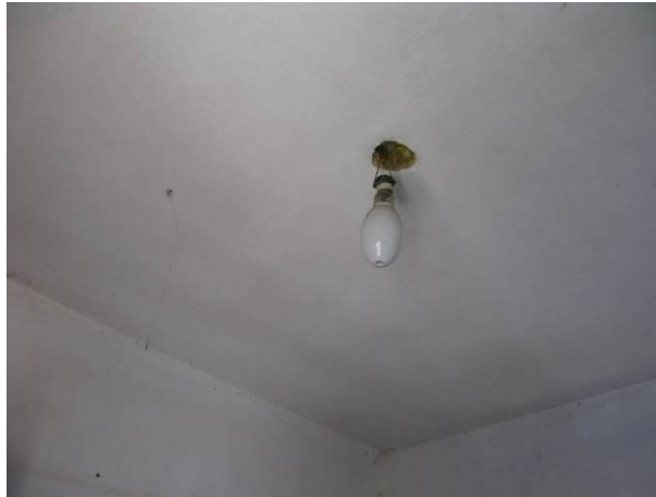
Figura 2 - EEAB de Brejetuba.

Não conformidade NC2 – Artigo 14, inciso III, da Resolução ARSP 018 de. 30/05/2018. Deixar de cumprir as normas técnicas, os procedimentos e/ou requisitos estabelecidos em regramento vigente para a implantação de todas as infraestruturas necessárias para a adequada prestação de serviços de abastecimento de água e de esgotamento sanitário.