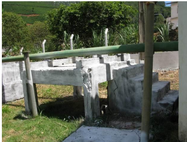
Figura 1 - EEAB de Brejetuba.

CONSTATAÇÃO C1: Presença de trincas e armaduras expostas na escada de acesso ao bloco de apoio da tubulação de sucção na captação da EEAB de Brejetuba, bem como no próprio bloco.