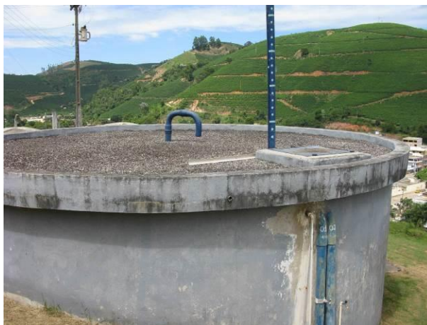
Figura 9 - Reservatório de 100m 3 da ETA Brejetuba.

CONSTATAÇÃO C7: Não há escada de acesso ao topo do reservatório de concreto da ETA (100m 3 ).