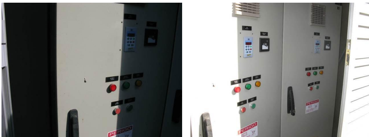
Figura 2 - Quadro elétrico/comando.

CONSTATAÇÃO C2: Quadro elétrico/comando não fecha completamente na EEAB da captação do Ribeirão Sumidouro.