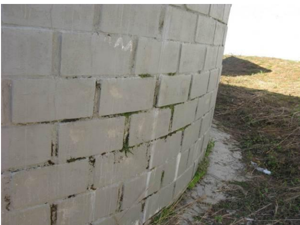
Figura 10 - Reservatório Niterói.