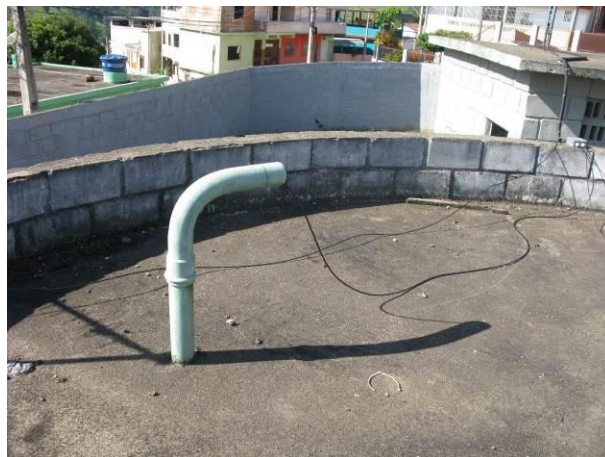
Figura 15 - Reservatório Niterói.