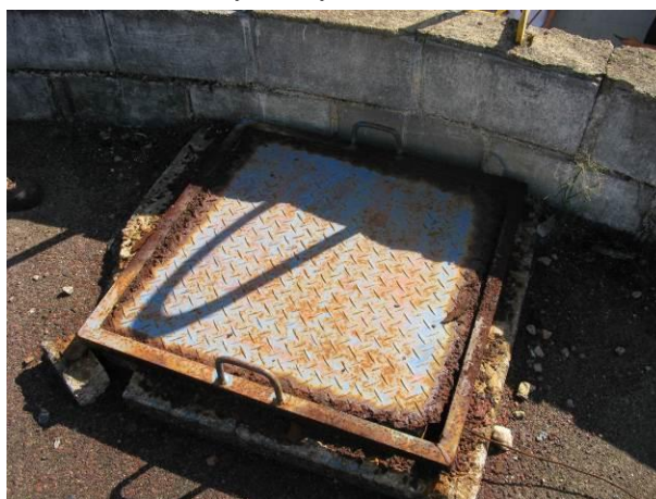
Figura 17 - Reservatório Niterói.

CONSTATAÇÃO C8: Corrosão na tampa superior do reservatório Niterói.