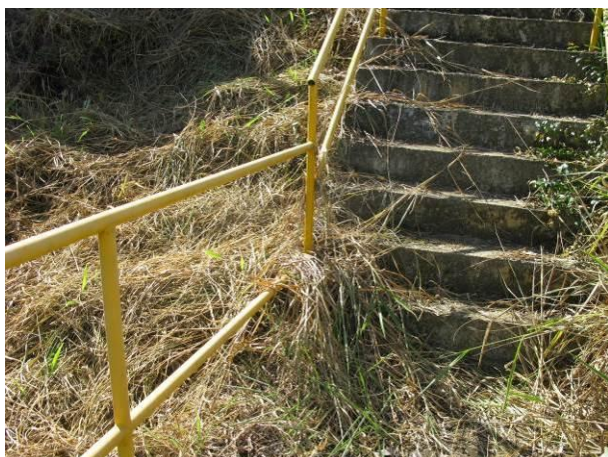
Figura 5 - Terreno do Reservatório da ETA Velha.

CONSTATAÇÃO C5: Excesso vegetação no terreno do Reservatório da ETA Velha, em caixa de inspeção no Reservatório Niterói e na unidade de tratamento dos efluentes da ETA Atilio Vivacqua.