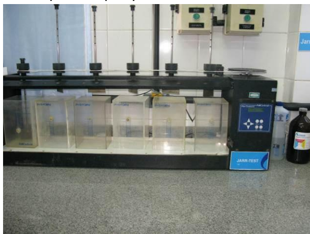
Figura 3 - Jar Test.

CONSTATAÇÃO C3: Jar Test parado por problemas técnicos na ETA Atílio Vivacqua.