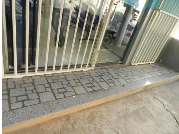
Figura 21 - Escritório de Atendimento de Atílio Vivacqua.

CONSTATAÇÃO C12: Ausência de rampa de acessibilidade ao Escritório de Atendimento de Atílio Vivacqua.