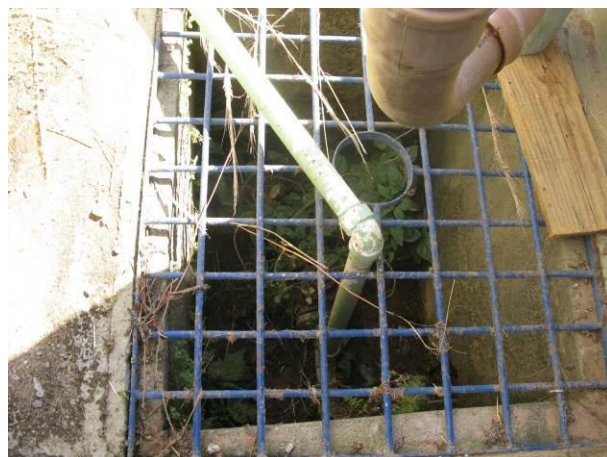
Figura 6 - Caixa de inspeção no Reservatório Niterói.