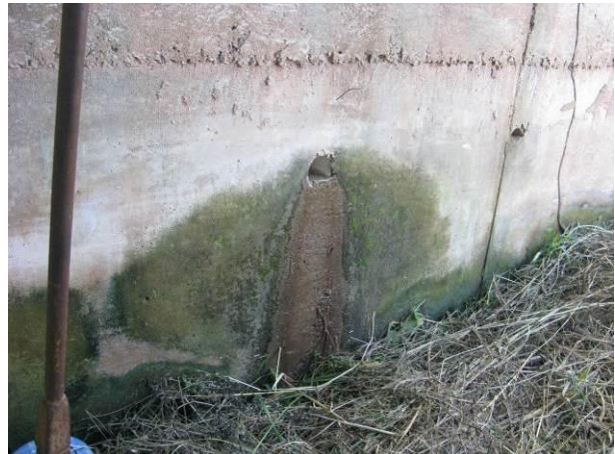
Figura 9 - Reservatório da ETA Velha.