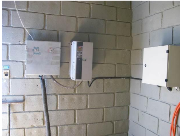
Figura 19 - Booster 02 – Alto Niterói.

CONSTATAÇÃO C10: Ausência de sinalização contra choque elétrico nas seguintes unidades do S.A.A. Atílio Vivacqua: Booster 02 – Alto Niterói.