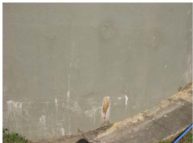
Figura 11 - Reservatório da ETA nova.