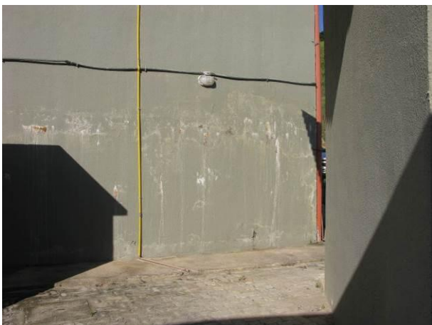
Figura 12 - ETA Atílio Vivácqua.