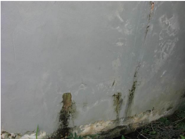
Figura 8 - Reservatório da ETA Velha.

CONSTATAÇÃO C6: Sinais de infiltração nos seguintes unidades do S.A.A. de Atílio Vivacqua: Reservatório da ETA Velha, Reservatório Niterói, Reservatório da ETA Nova e na estrutura física da ETA de Atílio Vivacqua..