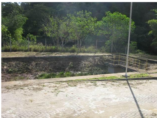
Figura 7 - Unidade de tratamento dos efluentes da ETA Atilio Vivacqua.

Não conformidade NC5 – Inciso IV do Artigo 14º da Resolução nº 018, de 30/05/2018 Deixar de realizar operação e manutenção adequada das unidades integrantes dos sistemas de abastecimento de água e/ou esgotamento sanitário, de acordo com as exigências dos regramentos vigentes.