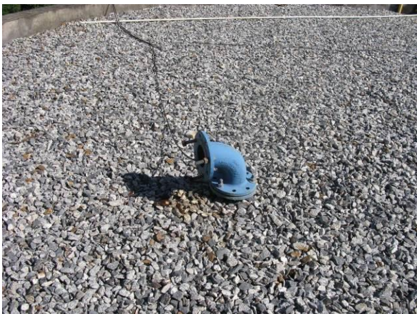
Figura 14 - Reservatório da ETA Velha.

CONSTATAÇÃO C7: Falta tela de proteção na abertura dos dutos de ventilação nas seguintes unidades do S.A.A. Atílio Vivacqua: Reservatório da ETA Velha, Reservatório Niterói e Reservatório da ETA Nova