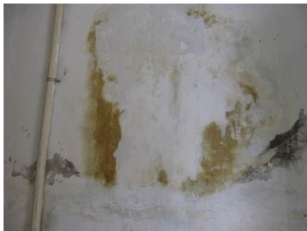
Figura 13 - ETA Atílio Vivacqua.

Não conformidade NC6 – Inciso IV do Artigo 14º da Resolução nº 018, de 30/05/2018. Deixar de realizar operação e manutenção adequada das unidades integrantes dos sistemas de abastecimento de água e/ou esgotamento sanitário, de acordo com as exigências dos regramentos vigentes.