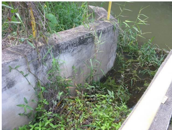
Figura 1 - Canal de Captação.

CONSTATAÇÃO C1: Presença de muita vegetação no canal de captação e no tratamento preliminar do Ribeirão Sumidouro.