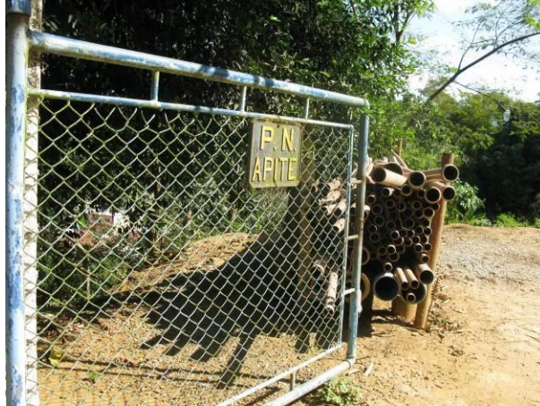
Figura 18 - Reservatório da ETA Velha.

CONSTATAÇÃO C9: Ausência de placas de identificação do Reservatório da ETA Velha.