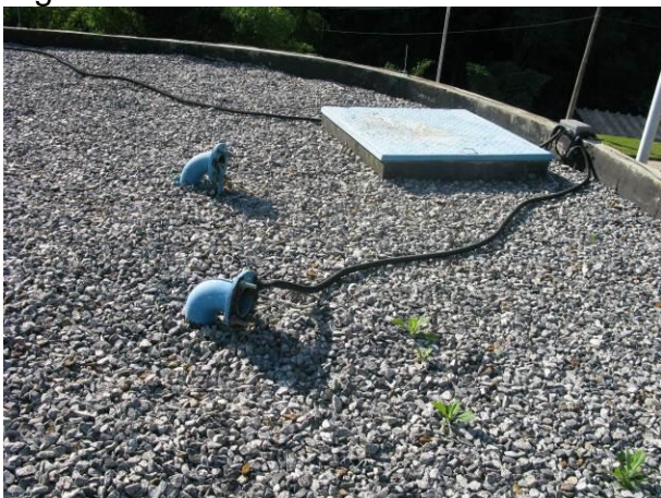
Figura 16 - Reservatório da ETA Nova.

Não conformidade NC7 – Inciso III do Artigo 14º da Resolução nº 018, de 30/05/2018. Deixar de cumprir as normas técnicas, os procedimentos e/ou requisitos estabelecidos em regramento vigente para a implantação de todas as infraestruturas necessárias para a adequada prestação de serviços de abastecimento de água e de esgotamento sanitário.