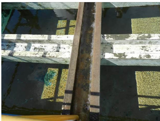
Figura 57 – ETA Barra do Riacho.

CONSTATAÇÃO C12: Necessidade de manutenção nos filtros nas seguintes unidades operacionais do S.A.A. da Região Litorânea de Aracruz: ETA Barra do Riacho, ETA Barra do Sahy, ETA Coqueiral e ETA Vila do Riacho.