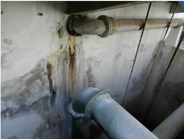
Figura 26 - ETA Coqueiral.