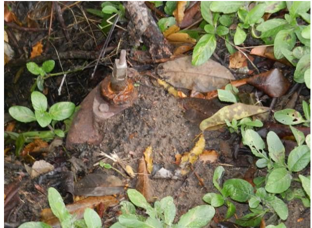
Figura 54 - Descarga Estrada Municipal (Coqueiral de Aracruz)