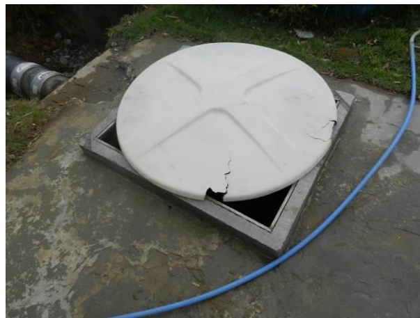
Figura 46 - EEAT Santa Cruz.

Não conformidade NC8 – Artigo 14, inciso IV, da Resolução ARSP 018 de 30/05/2018. Deixar de realizar operação e manutenção adequada das unidades integrantes dos sistemas de abastecimento de água e/ou esgotamento sanitário, de acordo com as exigências dos regramentos vigentes.