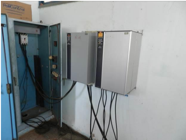
Figura 17 - EEAT Coqueiral 1.