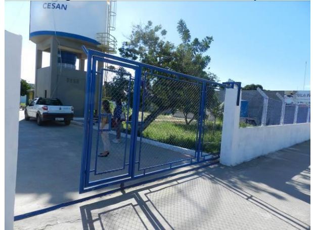
Figura 2 - ETA Barra do Sahy.