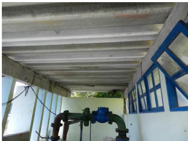
Figura 43 - Captação ETA Coqueiral.

CONSTATAÇÃO C7: Ausência de iluminação nas seguintes unidades operacionais do S.A.A. da Região Litorânea de Aracruz: Captação ETA Coqueiral e EEAT Santa Cruz.