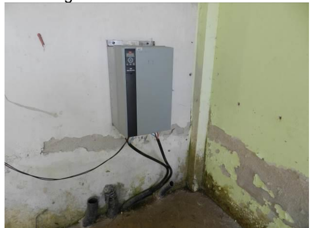
Figura 20 - Captação ETA Coqueiral.