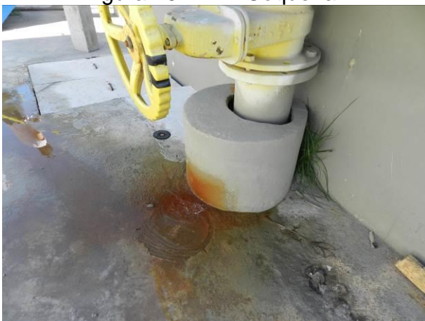
Figura 28 - ETA Vila do Riacho.