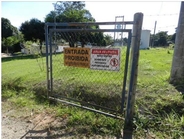
Figura 11 - ETA Coqueiral.

CONSTATAÇÃO C2: Necessidade de manutenção de portões e/ou muros com padrão do prestador de serviços (cores e logo) nas seguintes unidades operacionais do S.A.A. da Região Litorânea de Aracruz: ETA Coqueiral, Captação Barra do Riacho, Captação Barra do Sahy, Captação Vila do Riacho, RAT Elevado e RAT Sauê.