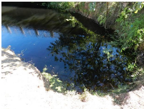
Figura 50 – Captação Barra do Sahy