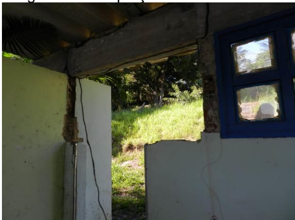
Figura 34 - Captação ETA Coqueiral.