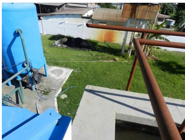
Figura 48 – ETA Vila do Riacho.

Não conformidade NC9 – Artigo 14, inciso III, da Resolução ARSP 018 de 30/05/2018. Deixar de cumprir as normas técnicas, os procedimentos e/ou requisitos estabelecidos em regramento vigente para a implantação de todas as infraestruturas necessárias para a adequada prestação de serviços de abastecimento de água e de esgotamento sanitário.