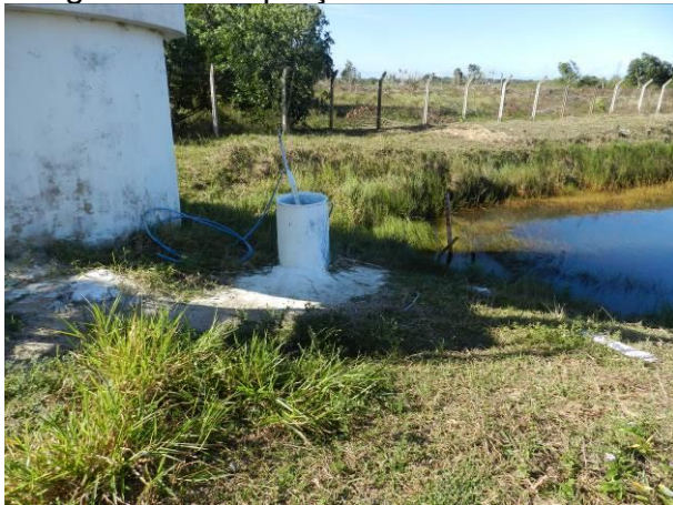
Figura 38 - Captação Vila do Riacho.