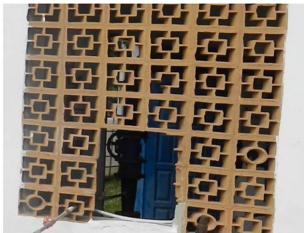
Figura 30 – EEAT Santa Cruz.

Não conformidade NC4 – Inciso IV do Artigo 14º da Resolução nº 018, de 30/05/2018. Deixar de realizar operação e manutenção adequada das unidades integrantes dos sistemas de abastecimento de água e/ou esgotamento sanitário, de acordo com as exigências dos regramentos vigentes.