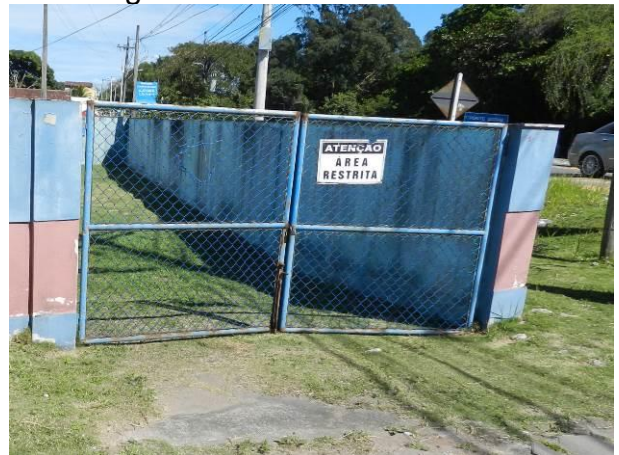
Figura 4 - ETA Vila do Riacho.