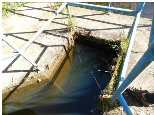
Figura 51 - Captação ETA Coqueiral.