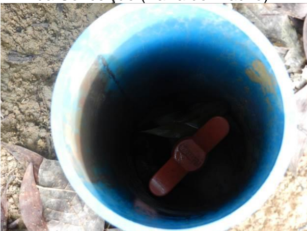
Figura 55 - Descarga Rua da Associação (Coqueiral de Aracruz).