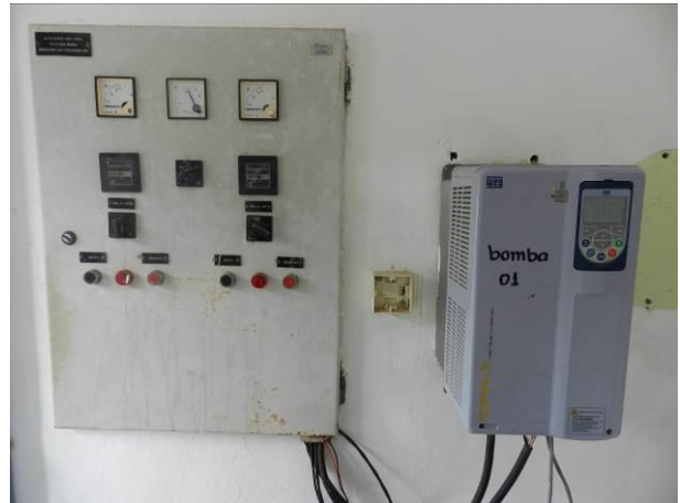
Figura 18 - EEAT Santa Cruz.