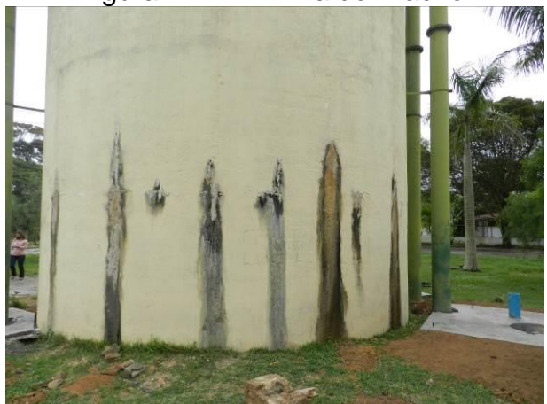
Figura 29 - RAT Coqueiral.