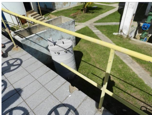
Figura 47 - ETA Barra do Sahy.

CONSTATAÇÃO C9: Inexistência ou necessidade de manutenção de guarda-corpo/corrimão nas seguintes unidades operacionais do S.A.A. da Região Litorânea de Aracruz: ETA Barra do Sahy e ETA Vila do Riacho.