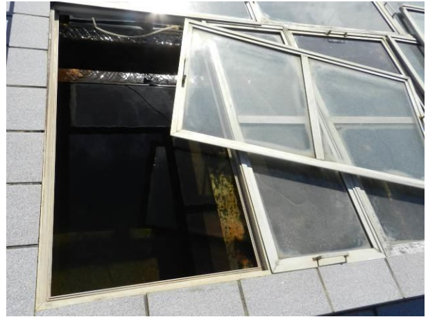
Figura 60 – ETA Vila do Riacho.

Não conformidade NC12 – Artigo 14, inciso IV, da Resolução ARSP 018 de. 30/05/2018. Deixar de realizar operação e manutenção adequada das unidades integrantes dos sistemas de abastecimento de água e/ou esgotamento sanitário, de acordo com as exigências dos regramentos vigentes.