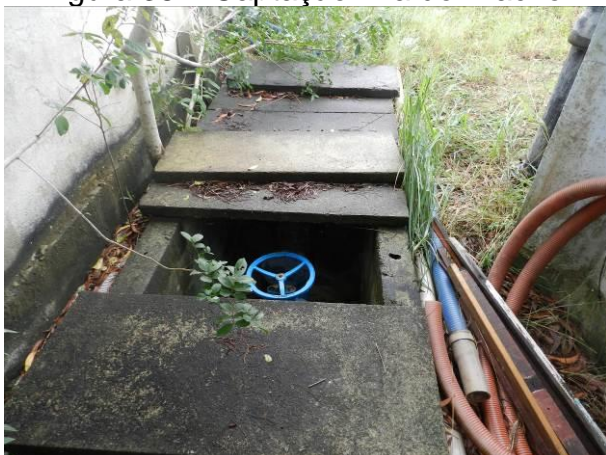
Figura 40 - RAT Sauê.