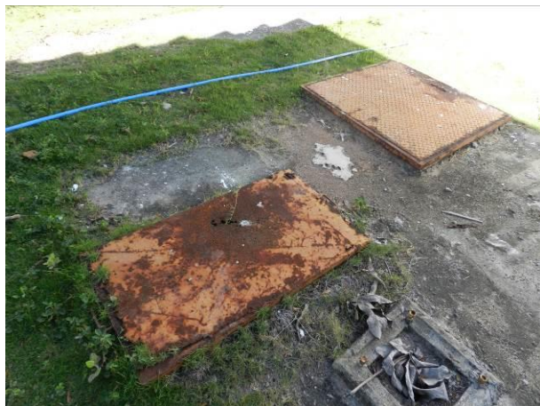
Figura 45 - ETA Coqueiral.

CONSTATAÇÃO C8: Necessidade de manutenção das tampas nas seguintes unidades operacionais do S.A.A. da Região Litorânea de Aracruz: ETA Coqueiral e EEAT Santa Cruz.