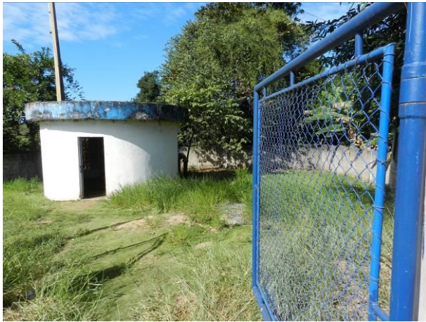
Figura 36 - Captação Barra do Riacho.