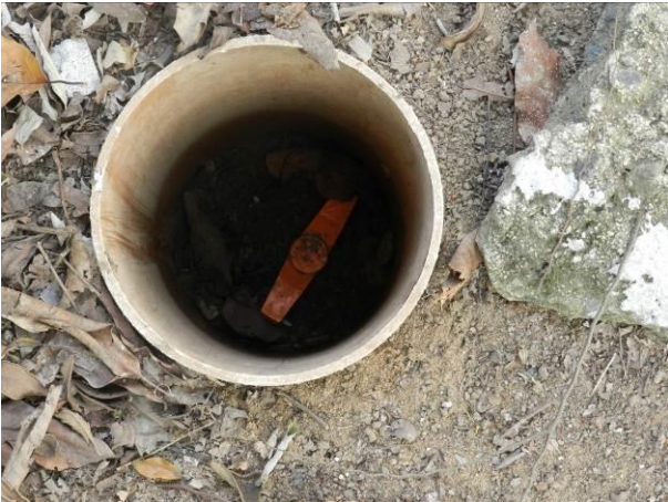
Figura 53 - Descarga Rua José Coutinho da Conceição (Barra do Riacho).

CONSTATAÇÃO C11: Ausência de tampa nas seguintes unidades operacionais do S.A.A. da Região Litorânea de Aracruz: Descarga Rua José Coutinho da Conceição (Barra do Riacho), Descarga Estrada Municipal (Coqueiral de Aracruz), Descarga Rua da Associação (Coqueiral de Aracruz) e Descarga Captação Vila do Riacho.