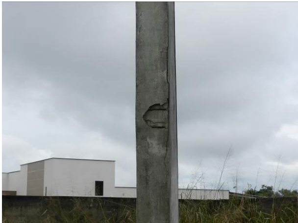
Figura 30 - RAT Elevado.