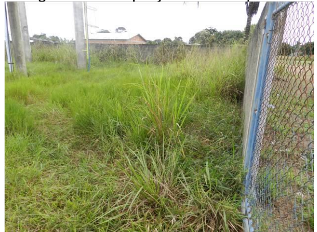
Figura 39 - RAT Elevado.