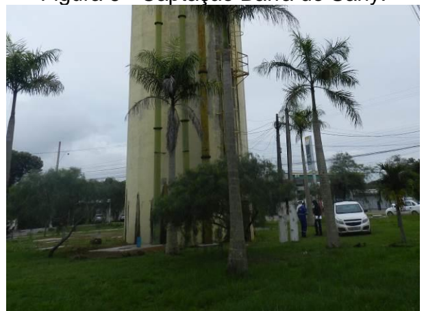
Figura 6 - Captação Barra do Sahy.