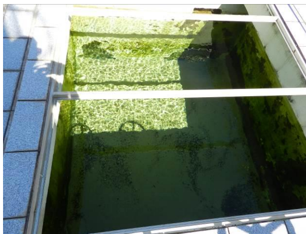
Figura 58– ETA Barra do Sahy.