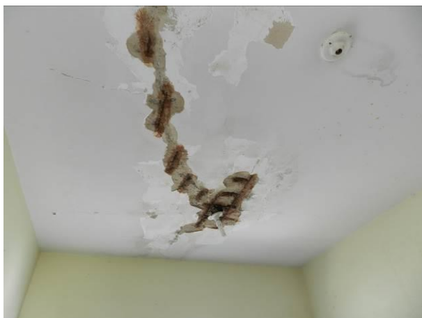
Figura 22 - ETA Barra do Riacho.

CONSTATAÇÃO C4: Necessidade de manutenção na estrutura física das seguintes unidades operacionais do S.A.A. da Região Litorânea de Aracruz: ETA Barra do Riacho (Armadura exposta), ETA Barra do Sahy (Armadura exposta e vazamentos na estrutura que comporta o tratamento), ETA Coqueiral (Infiltrações e vazamento no registro de lavagem do filtro), ETA Vila do Riacho (Infiltrações, rachaduras e vazamento no reregistro da ETA), RAT Coqueiral (infiltrações), RAT Elevado (Armadura exposta), RAT Sauê (Manutenção na estrutura física), Captação Barra do Riacho (Manutenção na casa de bombas), Captação Barra do Sahy (Manutenção na casa de bombas), Captação ETA Coqueiral (Manutenção na casa de bombas), EEAT Coqueiral 1 (Manutenção na casa de bombas) e EEAT Santa Cruz (Manutenção na casa de bombas).