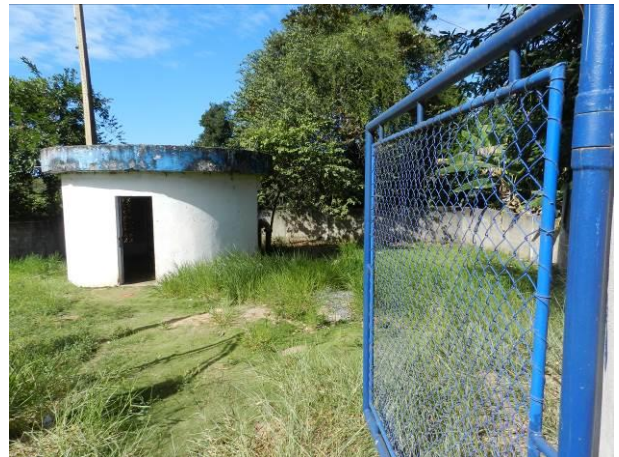
Figura 12 - Captação Barra do Riacho