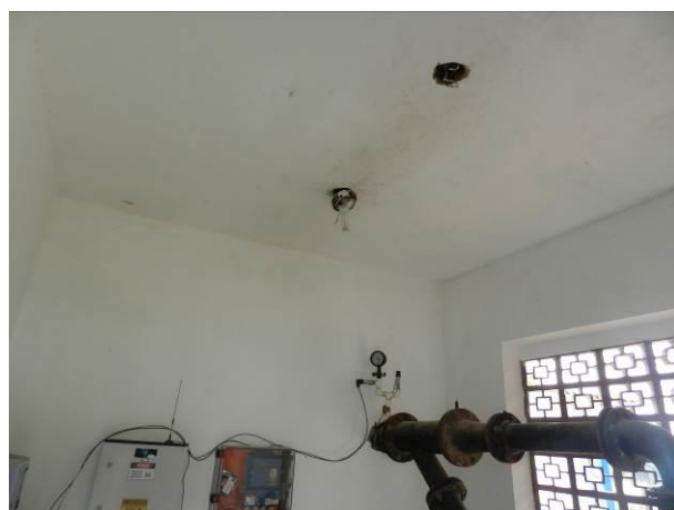
Figura 44 – EEAT Santa Cruz.

Não conformidade NC7 – Artigo 14, inciso III, da Resolução ARSP 018 de 30/05/2018. Deixar de cumprir as normas técnicas, os procedimentos e/ou requisitos estabelecidos em regramento vigente para a implantação de todas as infraestruturas necessárias para a adequada prestação de serviços de abastecimento de água e de esgotamento sanitário.