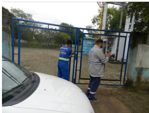
Figura 16 – RAT Sauê.

Não conformidade NC2 – Artigo 14, inciso IV da Resolução ARSP nº 018/2018. Deixar de realizar operação e manutenção adequada das unidades integrantes dos sistemas de abastecimento de água e/ou esgotamento sanitário, de acordo com as exigências dos regramentos vigentes.