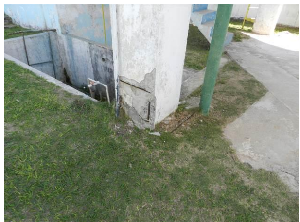
Figura 23 - ETA Barra do Sahy