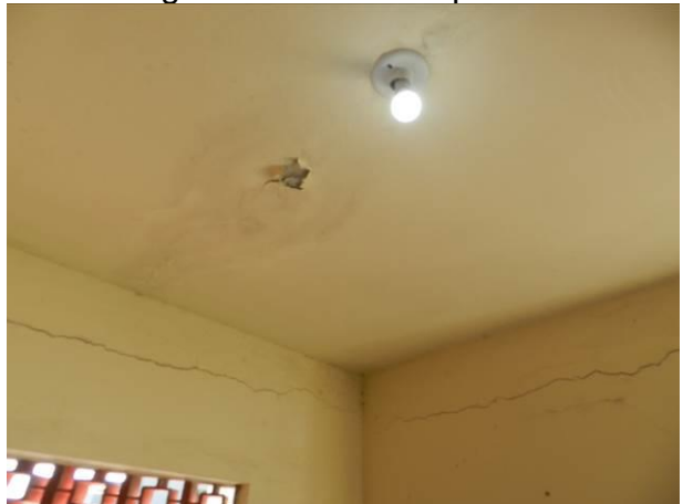
Figura 27 - ETA Vila do Riacho.