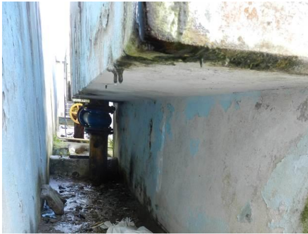
Figura 24 - ETA Barra do Sahy.