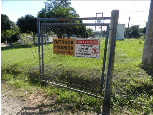
Figura 1 - ETA Barra do Riacho.