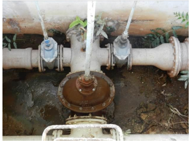
Figura 25 - ETA Coqueiral.