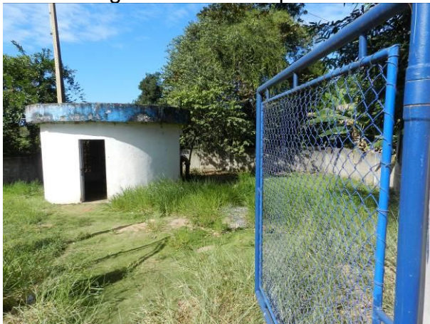
Figura 3 - ETA Coqueiral.