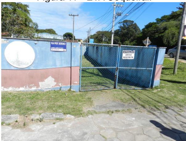
Figura 13 - Captação Barra do Sahy.