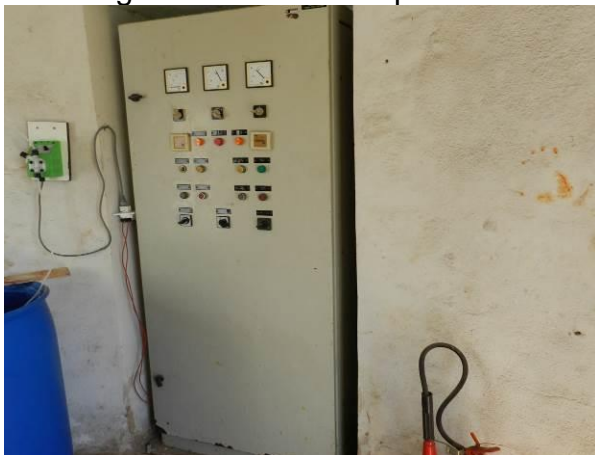
Figura 19 - Captação Barra do Sahy.