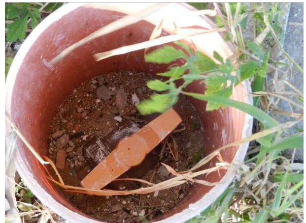
Figura 56 - Descarga Captação Vila do Riacho.