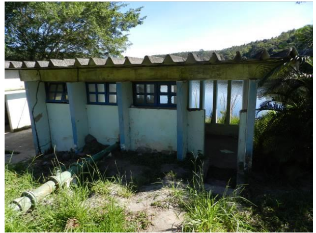
Figura 37 - Captação ETA Coqueiral.