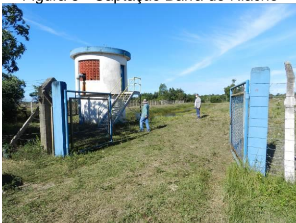
Figura 5 - Captação Barra do Riacho