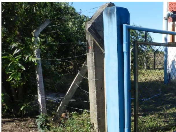
Figura 41 - Captação Vila do Riacho.

CONSTATAÇÃO C6: Isolamento deficiente nas seguintes unidades operacionais do S.A.A. da Região Litorânea de Aracruz: Captação Vila do Riacho e ETA Coqueiral.