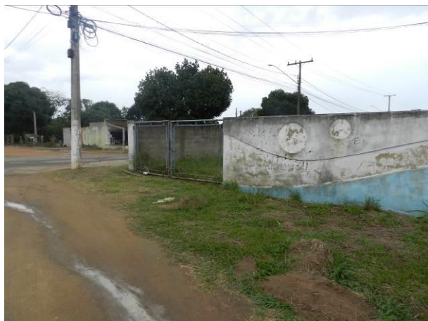
Figura 9 – RAT Elevado.