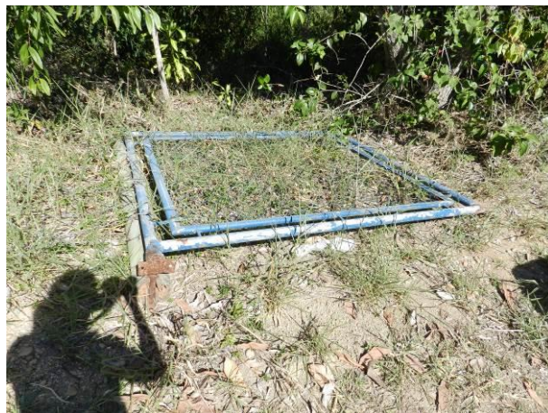
Figura 42 – ETA Coqueiral.

Não conformidade NC6 – Artigo 11, inciso VII, da Resolução ARSP 018 de 30/05/2018. Deixar de prover as áreas de risco com estruturas e equipamentos de segurança que possam evitar a ocorrência de acidentes e o acesso de terceiros a área física das unidades operacionais.