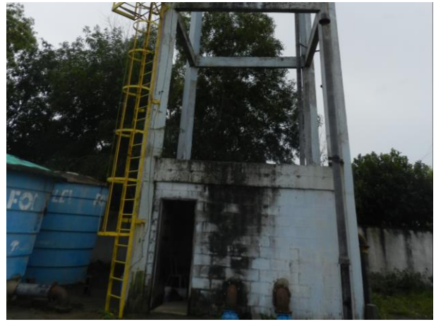
Figura 31 - RAT Sauê.