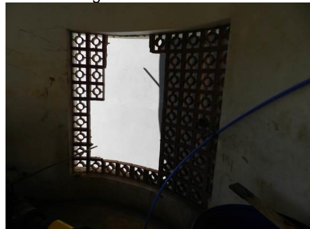
Figura 33 - Captação Barra do Sahy.