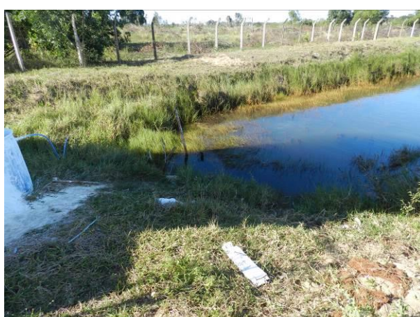
Figura 52 – Captação Vila do Riacho.

Não conformidade NC10 – Artigo 14, inciso III, da Resolução ARSP 018 de 30/05/2018. Deixar de cumprir as normas técnicas, os procedimentos e/ou requisitos estabelecidos em regramento vigente para a implantação de todas as infraestruturas necessárias para a adequada prestação de serviços de abastecimento de água e de esgotamento sanitário.