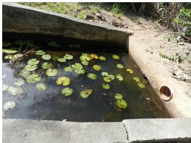
Figura 49 – Captação Barra do Riacho.

CONSTATAÇÃO C10: Ausência de tratamento preliminar nas seguintes unidades operacionais do S.A.A. da Região Litorânea de Aracruz: Captação Barra do Riacho, Captação Barra do Sahy, Captação ETA Coqueiral e Captação Vila do Riacho.