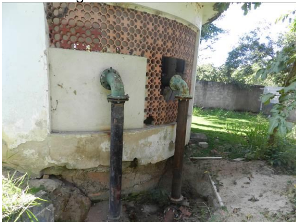
Figura 32 - Captação Barra do Riacho.