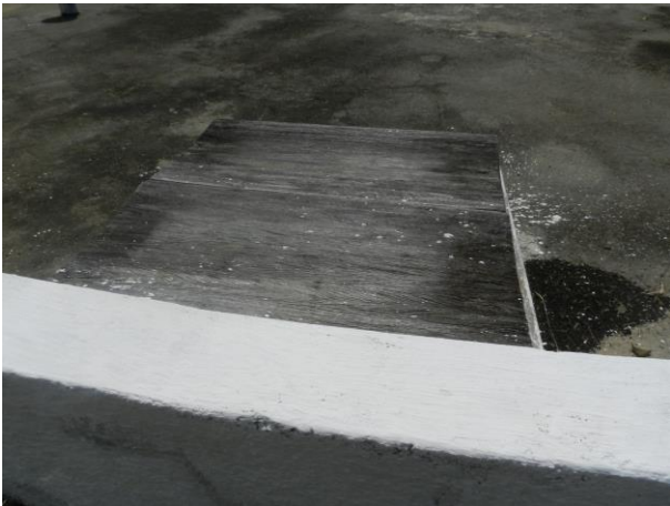
Figura 24 - Reservatório ETA Iriri.

CONSTATAÇÃO C7: Necessidade de substituição da tampa do reservatório da ETA Iriri (Anchieta) e do RAT Ilkiara (Sistema Integrado Piúma/Anchieta).