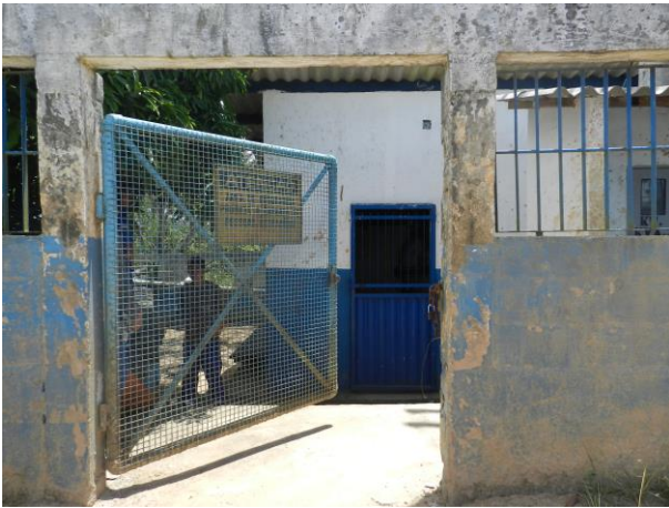
Figura 5 - Captação do sistema integrado Piúma/Anchieta.