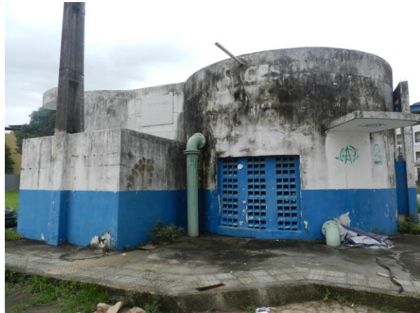
Figura 4 - Booster Acaiaca (Sistema Integrado Piúma/Anchieta).

Não conformidade NC1 – Artigo 11, inciso V, da Resolução ARSP 018 de 30/05/2018. Deixar de identificar as unidades operacionais e instalações pertencentes ao sistema de abastecimento de água e esgotamento sanitário, inclusive quanto ao horário de funcionamento dos postos de atendimento ao usuário.