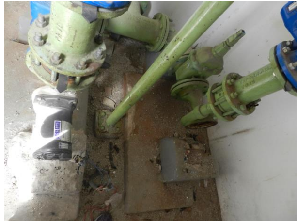
Figura 23 - EEAT Morro da Penha.

Não conformidade NC6 – Inciso III do Artigo 14 da Resolução nº 018, de 30/05/2018. Deixar de cumprir as normas técnicas, os procedimentos e/ou requisitos estabelecidos em regramento vigente para a implantação de todas as infraestruturas necessárias para a adequada prestação de serviços de abastecimento de água e de esgotamento sanitário.