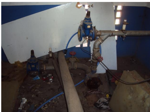
Figura 17 - Booster PA.

CONSTATAÇÃO C5: Ausência de iluminação nas seguintes unidades operacionais do S.A.A. de Anchieta: Booster PA, EEAT 15 A, captação do sistema integrado Piúma/Anchieta, Booster Acaiaca (Sistema Intergrado Piúma/Anchieta) e Booster Niterói (Sistema Intergrado Piúma/Anchieta) .