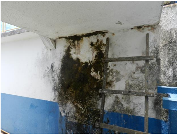
Figura 14 - ETA do Sistema Integrado Piúma/Anchieta.