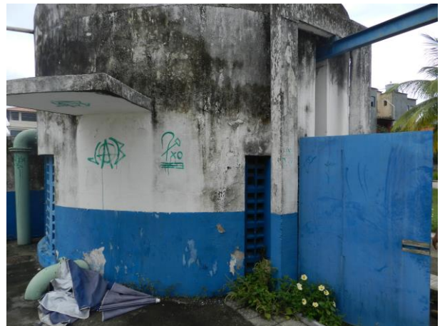
Figura 8 - Booster Acaiaca (Sistema Integrado Piúma/Anchieta).

Não conformidade NC2 – Artigo 14, inciso IV da Resolução ARSP nº 018/2018. Deixar de realizar operação e manutenção adequada das unidades integrantes dos sistemas de abastecimento de água e/ou esgotamento sanitário, de acordo com as exigências dos regramentos vigentes.