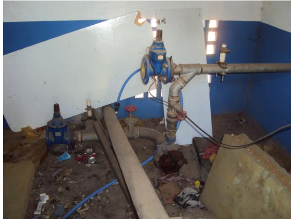
Figura 26 - Booster PA.

Não conformidade NC8 – Inciso IV do Artigo 14º da Resolução nº 018, de 30/05/2018. Deixar de realizar operação e manutenção adequada das unidades integrantes dos sistemas de abastecimento de água e/ou esgotamento sanitário, de acordo com as exigências dos regramentos vigentes.