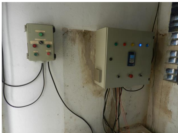
Figura 11 - EEAT Morro da Penha.