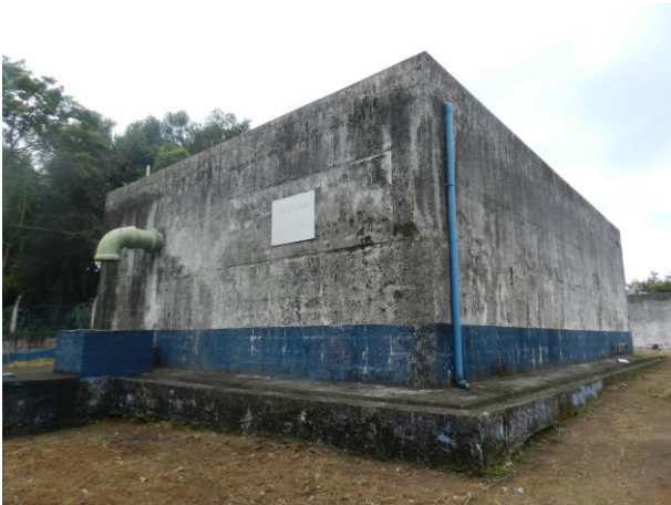
Figura 3 - RAT Ilkiara (Sistema integrado Piúma/Anchieta).