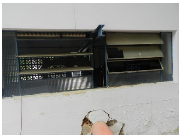
Figura 13 - Booster Pongal.