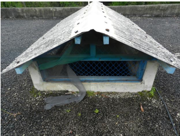
Figura 16 - Sistema de ventilação do RAT Ilkiara.

Não conformidade NC4 – Inciso IV do Artigo 14º da Resolução nº 018, de 30/05/2018. Deixar de realizar operação e manutenção adequada das unidades integrantes dos sistemas de abastecimento de água e/ou esgotamento sanitário, de acordo com as exigências dos regramentos vigentes.