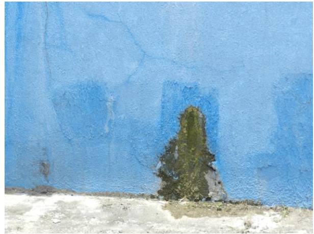
Figura 15 - ETA do Sistema Integrado Piúma/Anchieta.