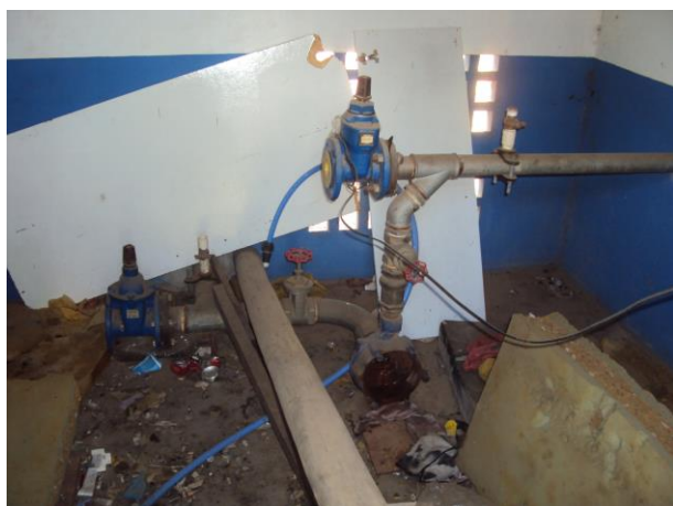
Figura 12 - Booster PA.

CONSTATAÇÃO C4: Necessidade de manutenção na estrutura física das seguintes unidades operacionais do S.A.A. de Anchieta: Área interna do Booster PA, Janelas do Booster Pongal, ETA do Sistema Integrado Piúma/Anchieta (Pontos com infiltração) e sistema de ventilação do RAT Ilkiara (Sistema Integrado Piúma/Anchieta).