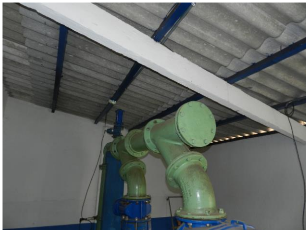
Figura 21 - Booster Niterói (Sistema Intergrado Piúma/Anchieta).

Não conformidade NC5 – Artigo 14, inciso III, da Resolução ARSP 018 de 30/05/2018. Deixar de cumprir as normas técnicas, os procedimentos e/ou requisitos estabelecidos em regramento vigente para a implantação de todas as infraestruturas necessárias para a adequada prestação de serviços de abastecimento de água e de esgotamento sanitário.