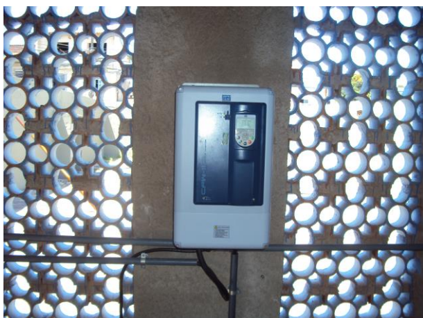
Figura 9 - EEAT 15 A.

CONSTATAÇÃO C3: Ausência de sinalização contra risco de choque elétrico nas seguintes unidades operacionais do S.A.A. de Anchieta: EEAT 15 A e EEAT Morro da Penha.