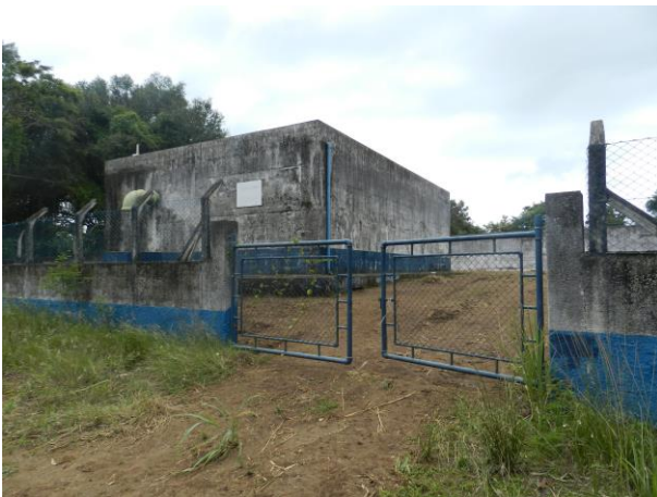
Figura 7 - RAT Ilkiara (Sistema integrado Piúma/Anchieta).