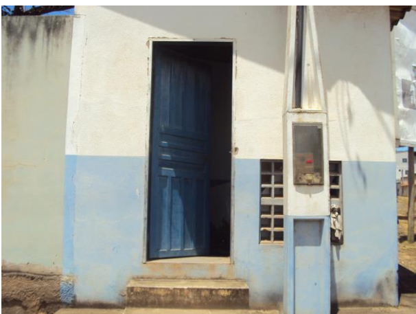
Figura 1 - Booster PA.

CONSTATAÇÃO C1: Ausência de identificação ou identificação antiga e precária nas seguintes unidades operacionais do S.A.A. de Anchieta: Booster PA, Captação do sistema integrado Piúma/Anchieta, RAT Ilkiara (Sistema integrado Piúma/Anchieta) e Booster Acaiaca (Sistema Intergrado Piúma/Anchieta).