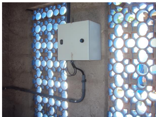
Figura 10 - EEAT 15 A.