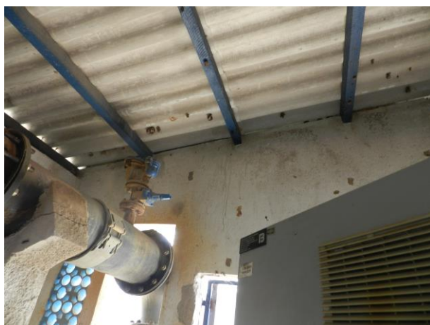
Figura 19 - Captação do Sistema Integrado Piúma/Anchieta.