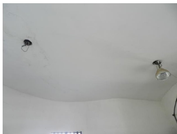
Figura 20 - Booster Acaiaca (Sistema Intergrado Piúma/Anchieta).