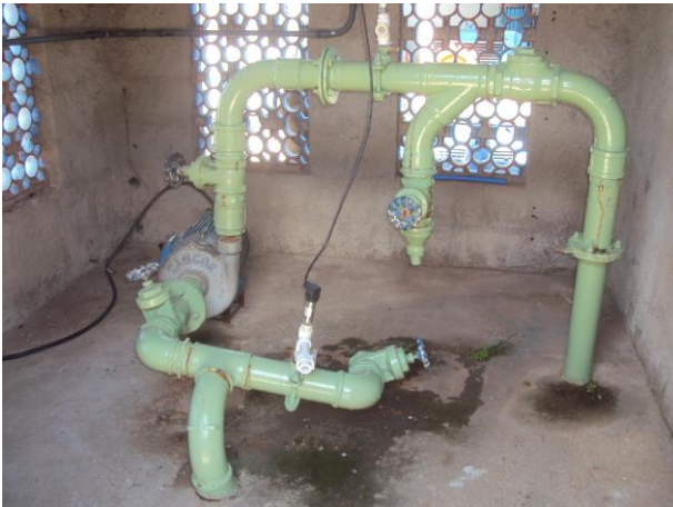
Figura 22 - EEAT 15 A.

CONSTATAÇÃO C6: Ausência de bomba reserva instalada nas seguintes unidades operacionais do SAA de Anchieta: EEAT 15 A e EEAT Morro da Penha.