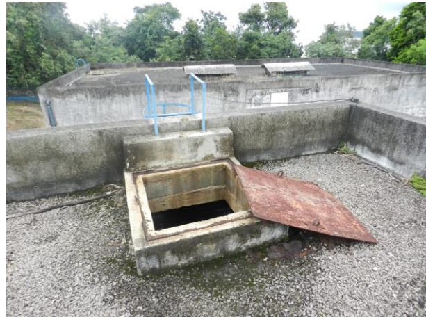
Figura 25 - RAT Ilkiara (Sistema Integrado Piúma/Anchieta).

Não conformidade NC7 – Inciso IV do Artigo 14º da Resolução nº 018, de 30/05/2018. Deixar de realizar operação e manutenção adequada das unidades integrantes dos sistemas de abastecimento de água e/ou esgotamento sanitário, de acordo com as exigências dos regramentos vigentes.