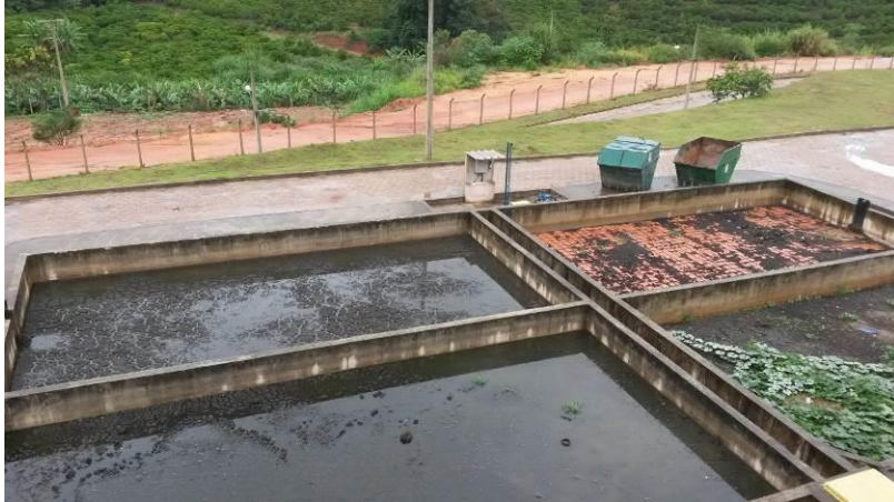
Figura 4 - Ausência de cobertura nos Leitos de secagem.

Não conformidade NC4 - Artigo 14, inciso IV da Resolução ARSP nº 018/2018: “Deixar de realizar operação e manutenção adequada das unidades integrantes dos sistemas de abastecimento de água e/ou esgotamento sanitário, de acordo com as exigências dos regramentos vigentes”.