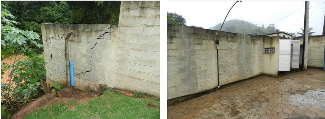
Figura 2 - Muros da EEEB 7.

Não conformidade NC2 – Artigo 14, inciso IV da Resolução ARSP nº 018/2018: “Deixar de realizar operação e manutenção adequada das unidades integrantes dos sistemas de abastecimento de água e/ou esgotamento sanitário, de acordo com as exigências dos regramentos vigentes”.