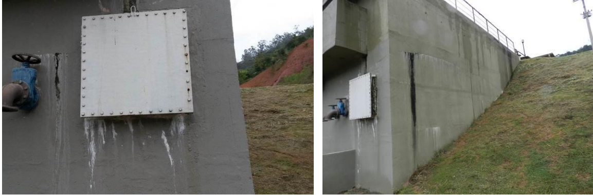
Figura 6 - Sinais de infiltração.

Não conformidade NC6- Artigo 14, inciso IV da Resolução ARSP nº 018/2018: “Deixar de realizar operação e manutenção adequada das unidades integrantes dos sistemas de abastecimento de água e/ou esgotamento sanitário, de acordo com as exigências dos regimentos vigentes”.