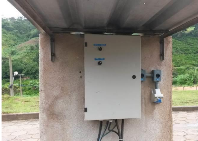
Figura 8 - Ausência de sinalização de risco.

CONSTATAÇÃO C8: Ausência de sinalização de risco de choque no painel da EEEB da ETE de Afonso Cláudio.