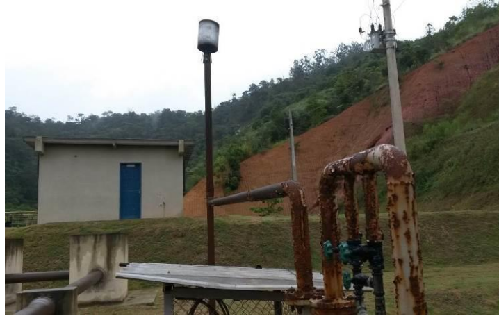
Figura 7 - Tubulação coletora de gás.

CONSTATAÇÃO C7: Tubulação coletora de gás do reator UASB apresenta ferrugem e demanda manutenção.