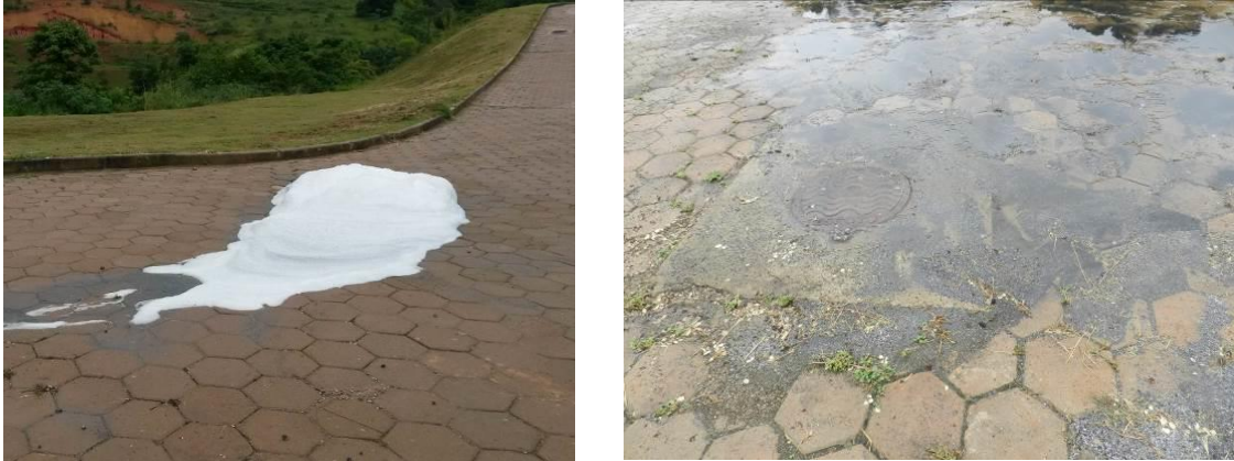
Figura 3 - Transbordamento de efluente e formação de espuma.

CONSTATAÇÃO C3: Transbordamento de efluente e formação de espuma no Poço de Visita localizado entre o UASB e a lagoa facultativa na ETE de Afonso Cláudio.