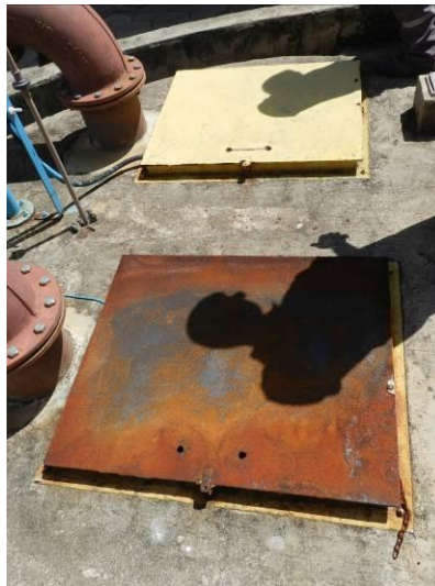
Figura 1 - Tampa do poço da EEEB 6.

CONSTATAÇÃO C1: Tampa do poço da EEEB 6 está enferrujada e demanda manutenção.