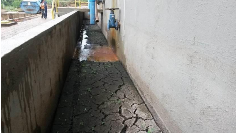
Figura 5 - Canal coleta do deságue do lodo do reator UASB

CONSTATAÇÃO C5: Presença de resíduos no canal de coleta do deságue do lodo do reator UASB.