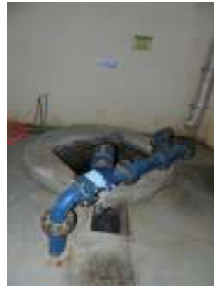
Figura 4 - Ausência de tampa no poço de sucção da ETE Vivendas de Pedra Azul.