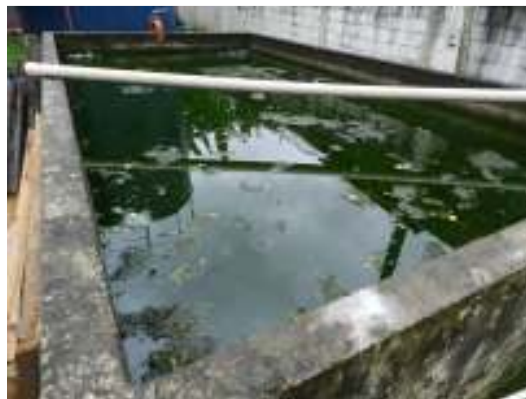
Figura 23 - Leito de secagem da ETE Santa Isabel.

Não conformidade NC2 – Não atendimento ao Artigo 8º da Resolução ARSI nº008/2010.