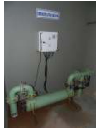
Figura 10 - Unidade Ultra Violeta inoperante na ETE Vivendas de Pedra Azul.