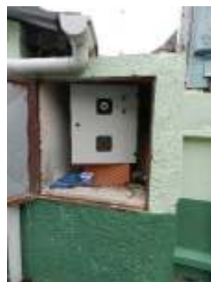
Figura 24 – Ausência de sinalização de risco na EEBE Centro - Izac Lampier.