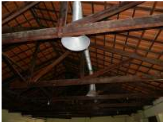
Figura 21 - Iluminação insuficiente na ETE Vila de Pedra Azul.