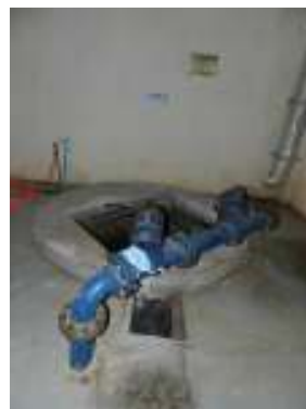
Figura 26 - Ausência de bomba reserva da EEEB da ETE Vivendas de Pedra Azul.