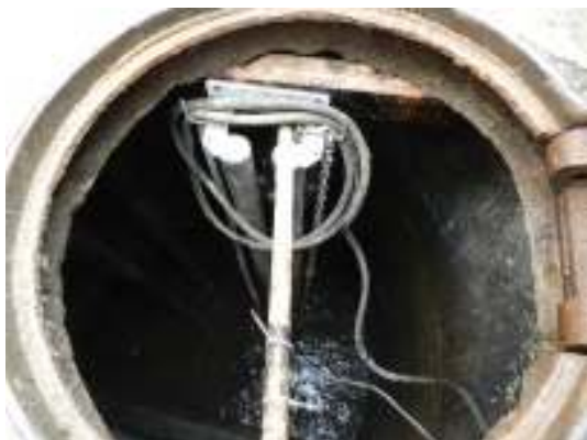
Figura 27 - Ausência de bomba reserva na EEEB Centro - Izac Lampier.