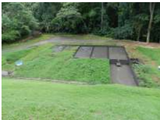
Figura 13 - Leitos de secagem - ETE Domingos Martins - Sede.