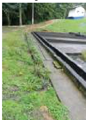
Figura 18 - Sistema de drenagem no entorno dos leitos de secagem da ETE Domingos Martins - Sede necessitando de melhorias.