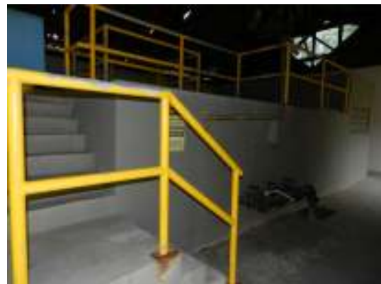
Figura 22 - Iluminação insuficiente na ETE Vivendas de Pedra Azul.