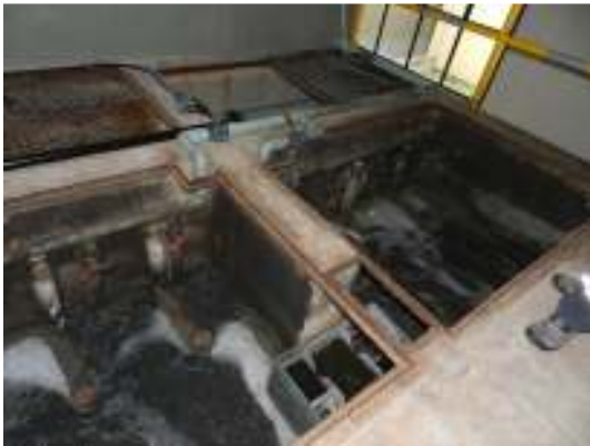
Figura 9 - Ausência de grades de proteção nos biofiltros aerados e nos decantadores da ETE Vivendas de Pedra Azul.