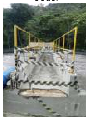
Figura 16 - Necessidade de manutenção da passarela do tanque de aerção da ETE Domingos Martins.