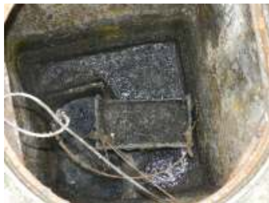
Figura 28 - Mecanismo de remoção de sólidos grosseiros da EEEB Centro - Izac Lampier instalado/disposto de forma inadequada.

Não conformidade NC4 – Não atendimento ao Artigo 8º da Resolução ARSI nº008/2010 e à NBR 12208/1992 itens 4.2.3.4 e 5.3.