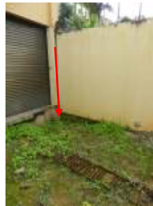
Figura 6 - Erosão no solo na ETE Vivendas de Pedra Azul.