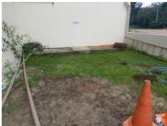
Figura 5 - Biofiltro inoperante na ETE Vila de Pedra Azul (Aracê).