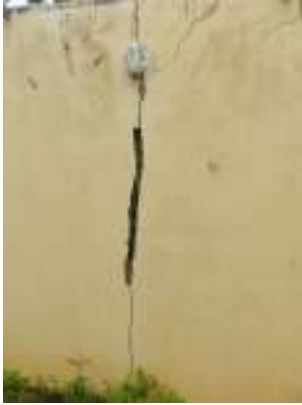
Figura 7 - Fissuras/Trincas na parede da ETE Vivendas de Pedra Azul.