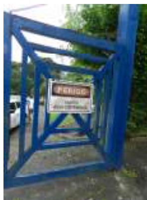
Figura 2 - ETE Domingos Martins sem identificação.

Não conformidade NC1 – Não atendimento ao Artigo 8º da Resolução ARSI nº008/2010.