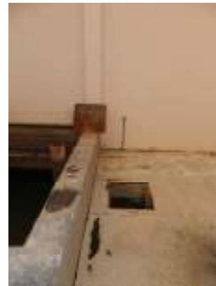
Figura 12 - Ausência de tampa de proteção ao lado do leito de secagem da ETE Vivendas de Pedra Azul.