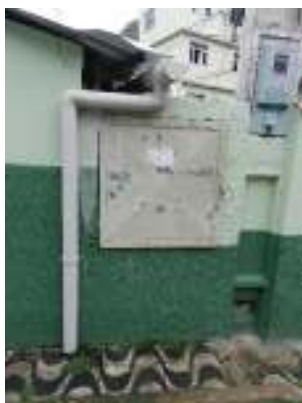
Figura 1 – EEEB Centro – Izac Lampier sem identificação

CONSTATAÇÃO C1: Não há identificação na estação elevatória de esgoto bruto (EEEB) Centro - Izac Lampier e na ETE Domingos Martins – Sede.