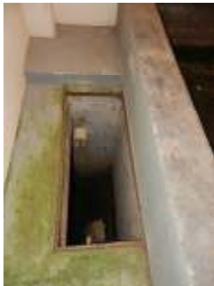
Figura 11 - Ausência de tampa de proteção ao lado do leito de secagem da ETE Vivendas de Pedra Azul.