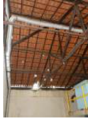
Figura 8 - Telhas danificadas na ETE Vivendas de Pedra Azul.