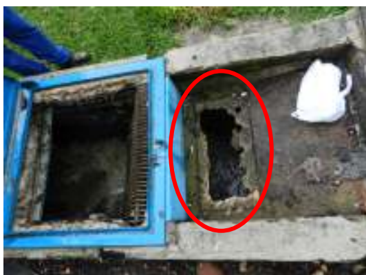
Figura 15 - Necessidade de manutenção do local para depósito de resíduos oriundos do tratamento preliminar.