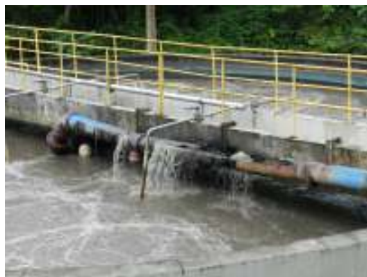
Figura 14 - Necessidade de manutenção da tubulação de distribuição (chegada) de efluentes da ETE Domingos Martins - Sede.