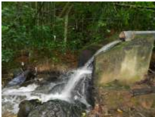
Figura 19 - Ponto de lançamento da ETE Domingos Martins - Sede.