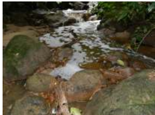
Figura 20 - Presença de espuma no corpo hídrico receptor do efluente tratado da ETE Domingos Martins -Sede.