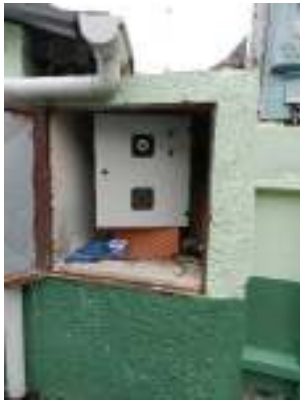
Figura 3 - Quadro de força da EEEB Centro - Izac Lampier demandando manutenção.