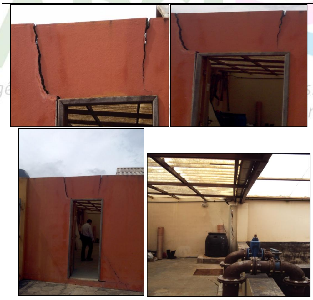
Figura 1: Fotos de rachaduras na estrutura dos leitos de secagem.

Na vistoria realizada na ETE Pedra Azul em 09/01/2014 foi identificada a presença de fissuras, trincas e rachaduras, no piso e paredes do prédio da ETE Pedra Azul, como pode ser constatado nas diversas fotografias apresentadas a seguir.