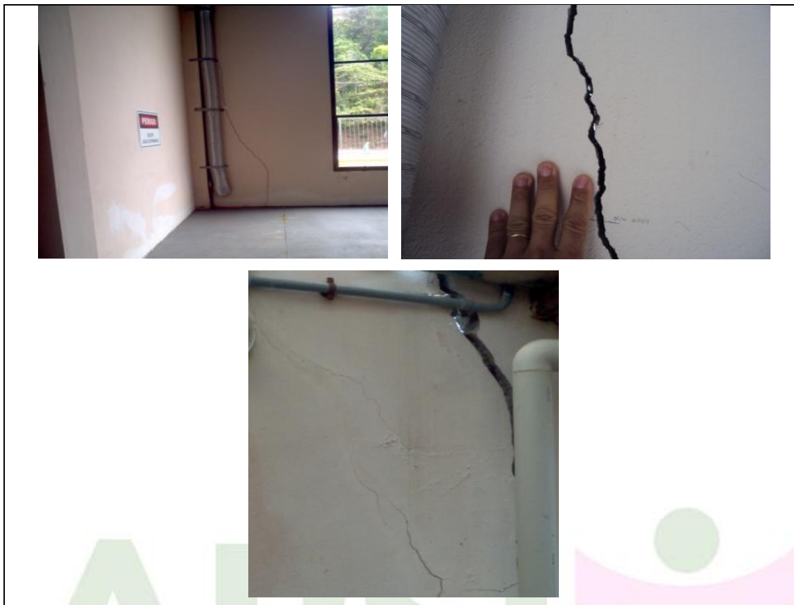
Figura 3: Fotos de rachaduras da parede externa.

Conforme apontado nas fotos acima, constatamos avaria na estrutura física da edificação da ETE Pedra Azul, uma vez que à presença de rachaduras diagonais das paredes e horizontais dos pisos configuram o risco estrutural.