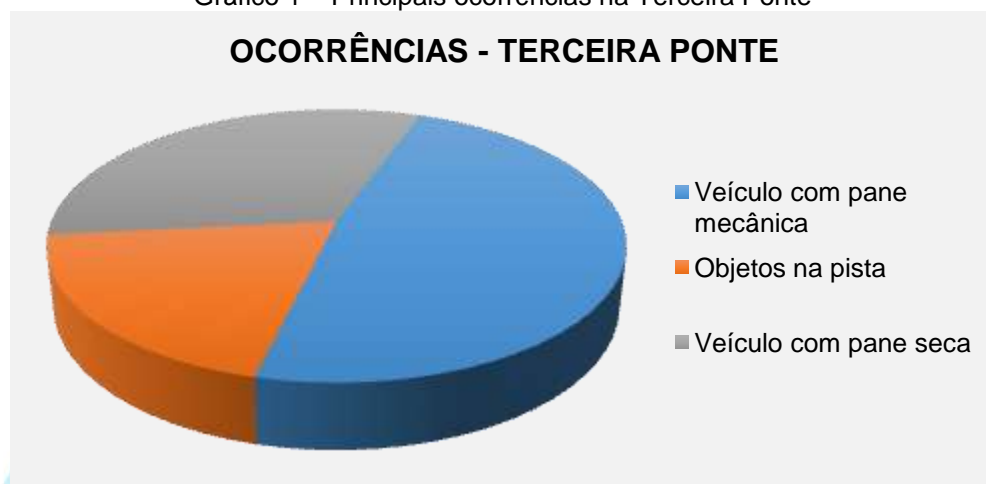
Gráfico 1 – Principais ocorrências na Terceira Ponte

AGÊNCIA DE REGULAÇÃO DE SERVIÇOS PÚBLICOS