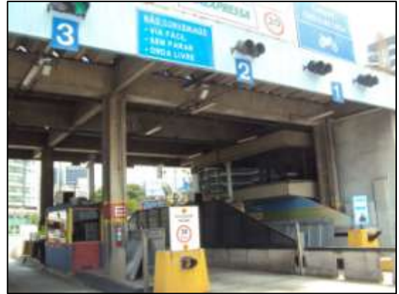
Fotos 07 e 08 – Fiscalização periódica do trecho urbano da Barra do Jucu e das Praças de Pedágio.