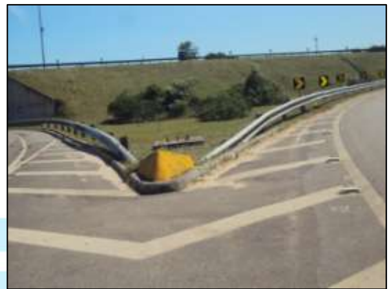
Fotos 03 e 04 – Fiscalização periódica dos elementos de segurança rodoviária.