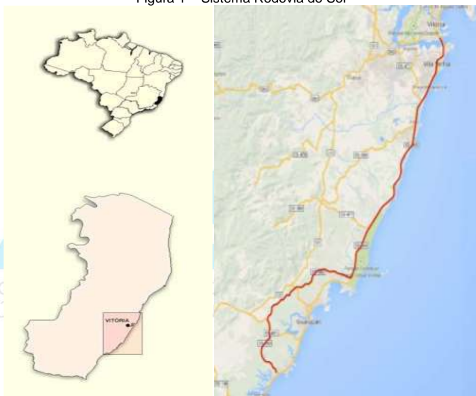
Figura 1 – Sistema Rodovia do Sol