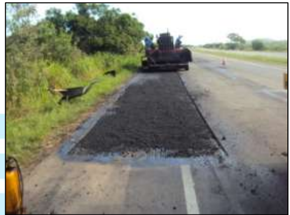
Fotos 09 e 10 – Fiscalização específica da conserva especial do pavimento.