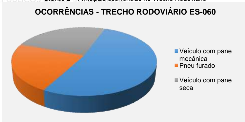
Gráfico 2 – Principais ocorrências no Trecho Rodoviário

O registro de acidentes no Sistema Rodovia do Sol é fundamentado na necessidade constante da identificação e mitigação destes. Através deste