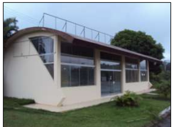
Fotos 11 e 12 – Fiscalização específica do novo módulo do BPTran - km 50