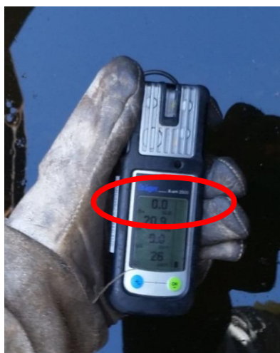
Figura 02 – Caixa de válvula do Posto Monza (zoom medidor)

Constatação (C02): No dia 31/08/2020 a equipe de fiscalização não identificou sinais de vazamento de gás, como por exemplo bolhas na água ou odor característico. Adicionalmente foi solicitado à equipe da concessionária que aproximasse o medidor de CH 4 à superfície da água, porém o mesmo não acusou a presença de CH 4 .